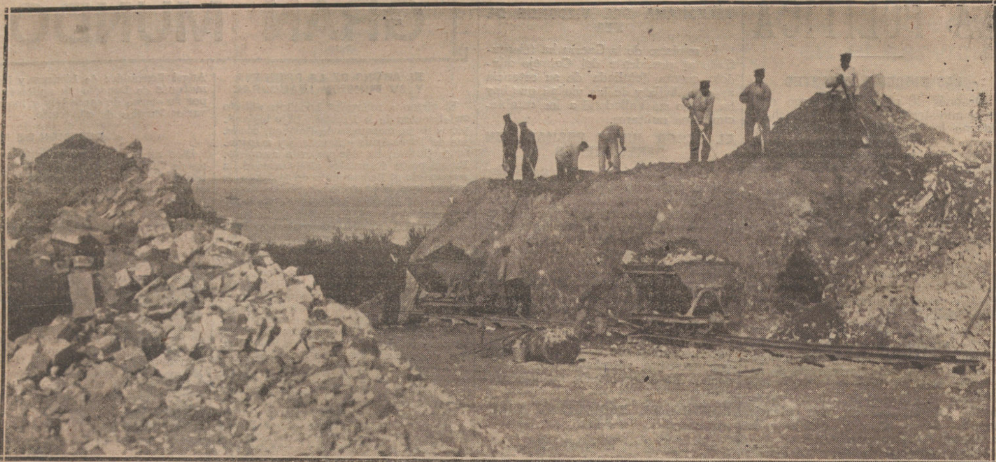
EL CUMPLIMIENTO DEL TRATADO DE VERSALLES.—OBREROS ALEMANES DEMOLIENDO EL FAMOSO FUERTE DE KORÜNGEN, UNO DE LOS MAS IMPORTANTES DE LAS FORTIFICACIONES DE KIEL.