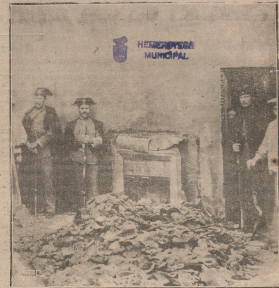
UN FORMIDABLE INCENDIO EN GUADALAJARA.—UN ASPECTO DEL ESTADO EN QUE QUEDA EL PALACIO DEL MARQUÉS DE VILLAMEJOR, HABITADO EN LA ACTUALIDAD POR LOS DUQUES DEL INFANTADO. EN LA FOTOGRAFIA SE VE LA CHIMENEA POR DONDE EMPEZO EL INCENDIO.

Por eso se esperaba que la campaña emprendida ahora contra el Gobierno había de tomar caracteres imponentes, y que el señor Dato, ante los discursos amenazadores del señor La Cierva, dimitiría sin hacer las elecciones. Así lo creyó incluso el mismo señor La Cierva cuando se atrevió a retar al Gobierno en Valencia. Pero el tiempo pasa, y nada de cuanto se venía vaticinando ha ocurrido, y en cambio el telégrafo nos trae noticias de las