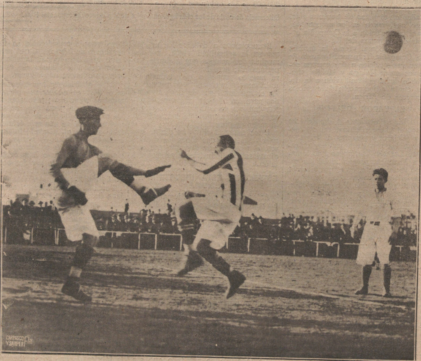
LOS DEPORTES EN SEVILLA.—UN MOMENTO INTERESANTISIMO DEL PARTIDO DE «FOOT-BALL» JUGADO ENTRE LOS EQUIPOS RIVALES «SEVILLA» Y «REAL RETIS BALO MPIO». Y EN EL QUE GANO EL PRIMERO POR CUATRO «GOALS».

La portería grecorromana es algo pretencioso, vivienda para unos arrivistas, y queda en el portal como un pabellón de otra época, como los restos de alguna gran casa del mismo estilo.