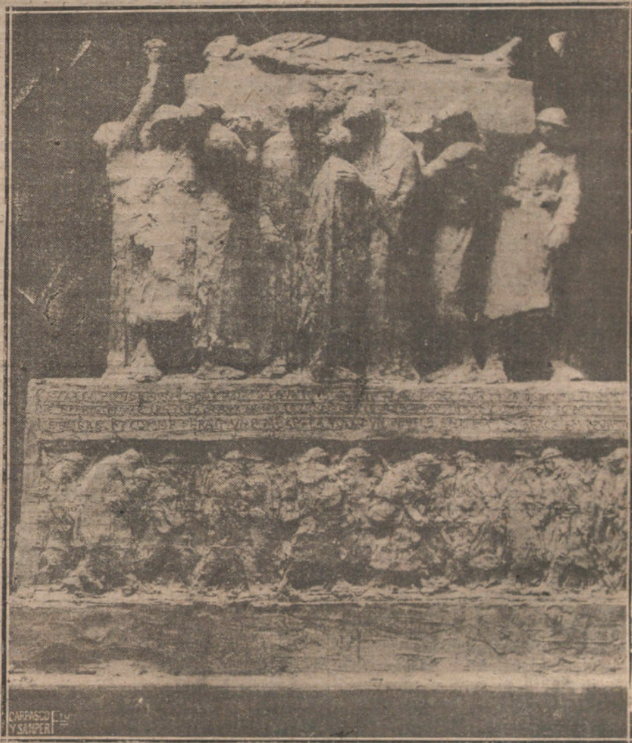
LA TUMBA DEL SOLDADO.-PROYECTO DE MONUMENTO A LAS VÍCTIMAS DE LA GUERRA. ERIGIDO EN HOMENAJE AL SOLDADO DESCONOCIDO. OBRA DEL ESCULTOR PAUL LANZ DOWSKI