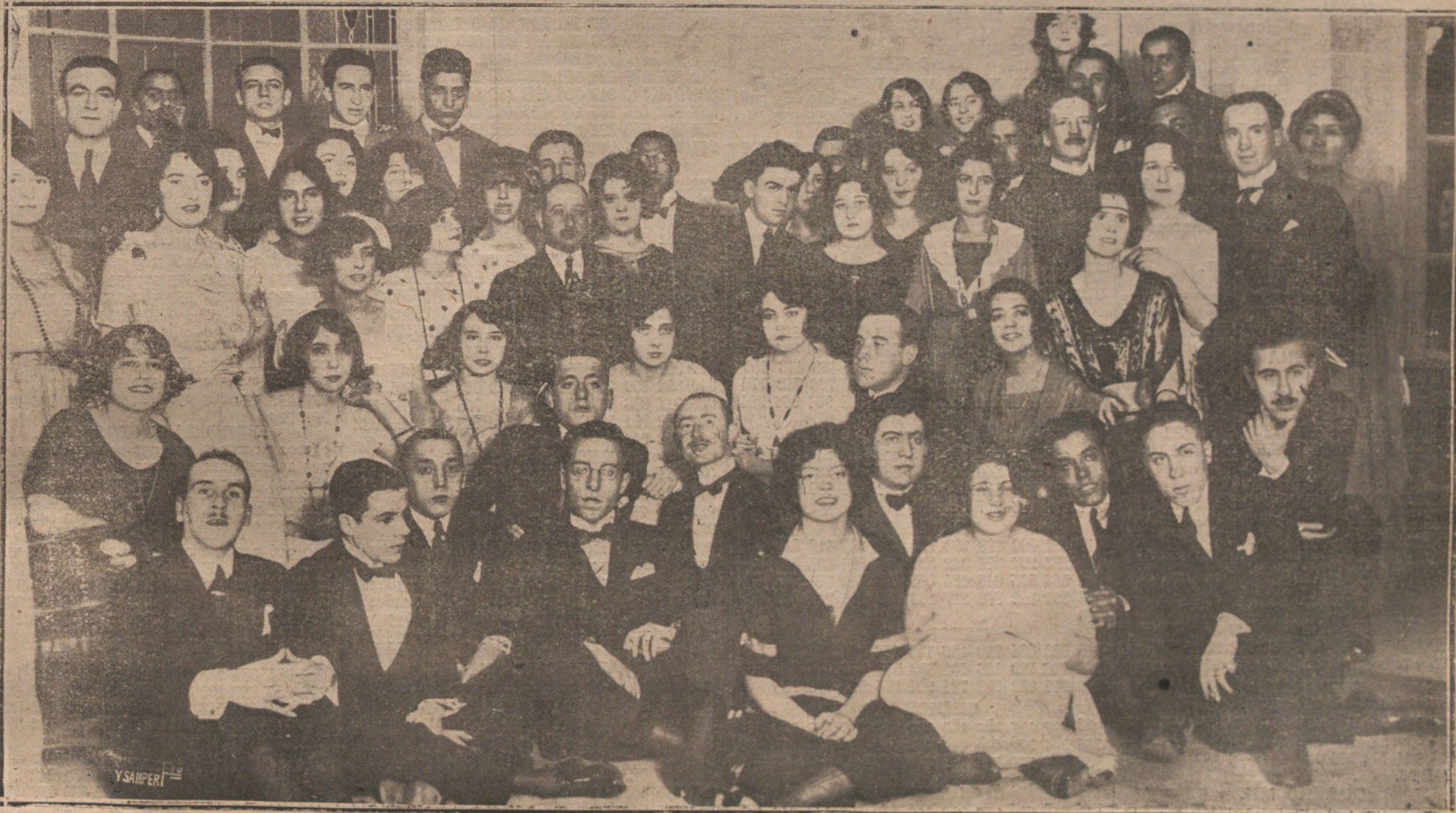
GRUPO DE PERSONALIDADES FRANCESAS CONCURRENTES AL BANQUETE CELEBRADO AYER NOCHE EN EL PALACE HOTEL, PARA FESTEJAR EL SEGUNDO ANIVERSARIO DE LA FIRMA DEL ARMISTICIO.

De conformidad a lo dispuesto en la Real orden de 1 de mayo de 1920 y la dictada en 21 de septiembre del mismo año para ejecución de la anterior, esta Facultad abre un concurso para pensionar al alumno o alumnos que hayan cursado los