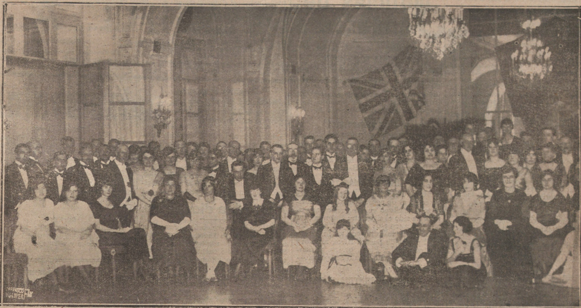
GRUPO DE PERSONALIDADES INGLESAS EN EL RITZ, DONDE CELEBRARON UNA INTERESANTE FIESTA CON MOTIVO DEL SEGUNDO ANIVERSARIO DE LA FIRMA DEL ARMISTICIO.