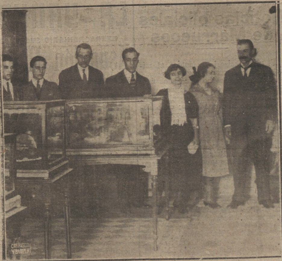
UN DETALLE DEL MUSEO CERAMICO PORTUGUES, INAUGURADO EN EL CENTRO ASTORIANO