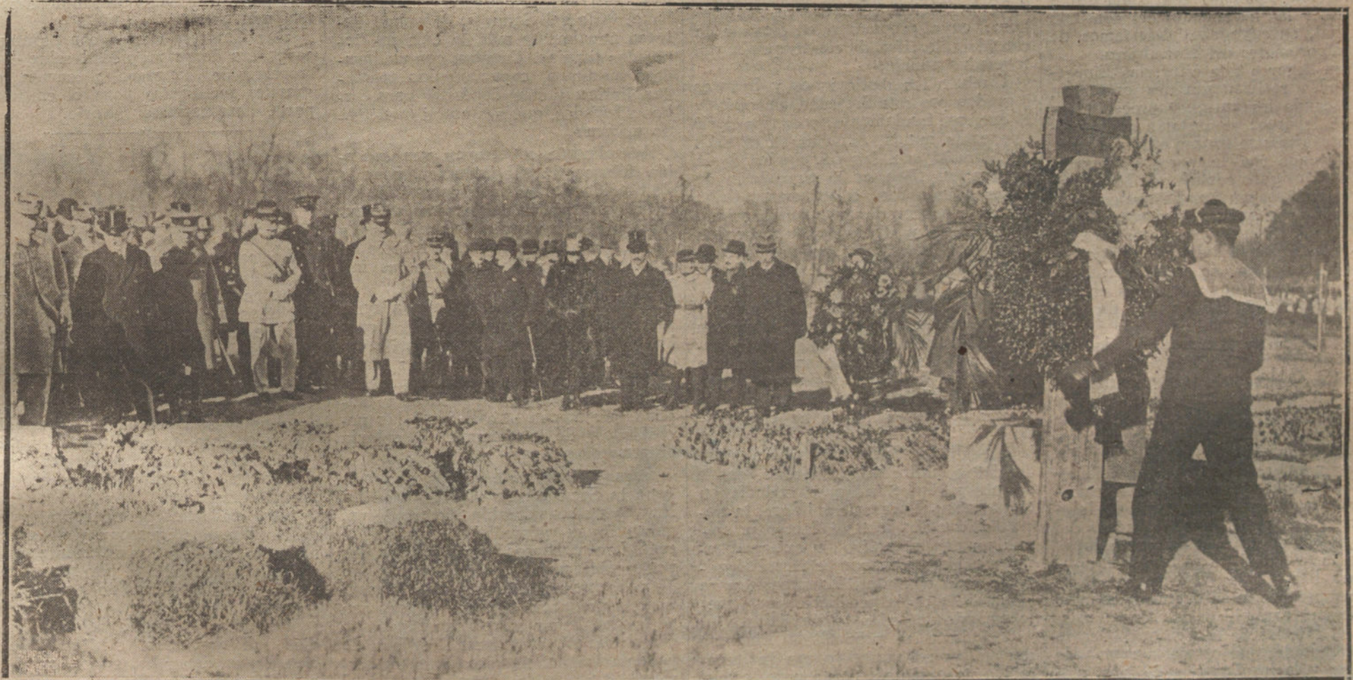
HOMENAJE A LAS VICTIMAS DE LA GUERRA EN BERLIN. EL NUEVO EMBAJADOR DE FRANCIA VISITANDO LAS TUMBAS DE LOS PRISIONEROS FRANCESES MUERTOS DURANTE SU CAUTIVERIO EN ALEMANIA.

LA TAREA DE DEVOLVER TODOS LOS ORIGINALES QUE NO PUBLICAMOS SERIA ABRUMADORA, Y PARA EVITARLA, COMO PARA PREVENIR RECLAMACIONES, QUE RESULTARIA IMPOSIBLE ATENDER, RECORDAMOS QUE NO SE DEVUELVEN LOS ORIGINALES.