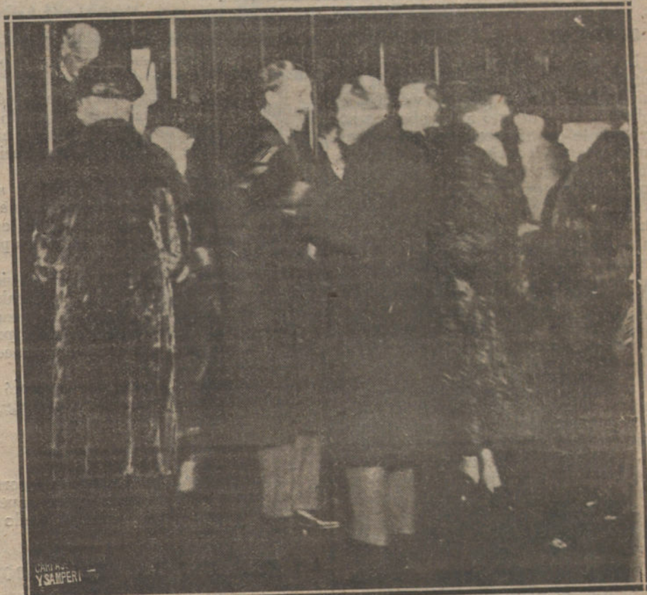
LLGADA DE SS. MM. LOS REYES DE ESPAÑA A LONDRES, DON ALFONSO Y DOÑA VICTORIA SON RECIBIDOS EN LA ESTACION POR SS. MM. LOS REYES DE INGLATERRA.

Tienen responsabilidad los Poderes públicos, porque siempre hurtaron al conocimiento del país la entera verdad