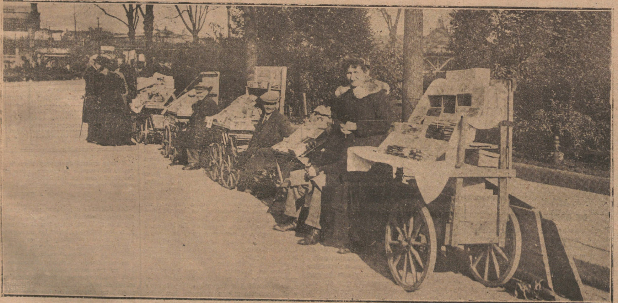
LOS COMERCIOS AMBULANTES EN BERLIN.—LA ESCASEZ DE VIVIENDAS EN ALEMANIA HA FAVORECIDO EL INCREMENTO DEL COMERCIO CALLEJERO. HE AQUI VARIOS PUESTOS AMBULANTES DESTINADOS A LA VENTA DE TABACO.