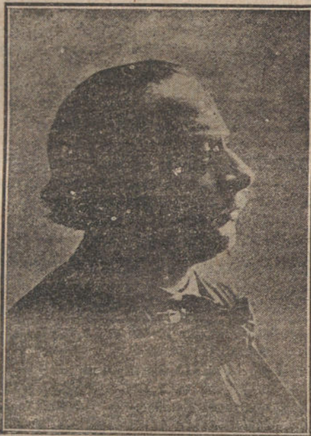
CONTRALUZ DE EUGENIO NOEL.

tad de Noel con varias gentes, Julio Antonio, Ciges Aparicio, Viladrich, logrando Ciges que el «Cuento Semanal» le publicase la primera novela corta, y logrando yo de Julio Antonio que se lo ilustrase, apareciendo así una obra que fue una verdadera joya de arte en aquel tiempo, algo inquietante, que fue la tarjeta de que se valió Noel para hacer algo más que hablar de su obra al primero que se encontraba—una obra que era sólo una gran hipótesis.