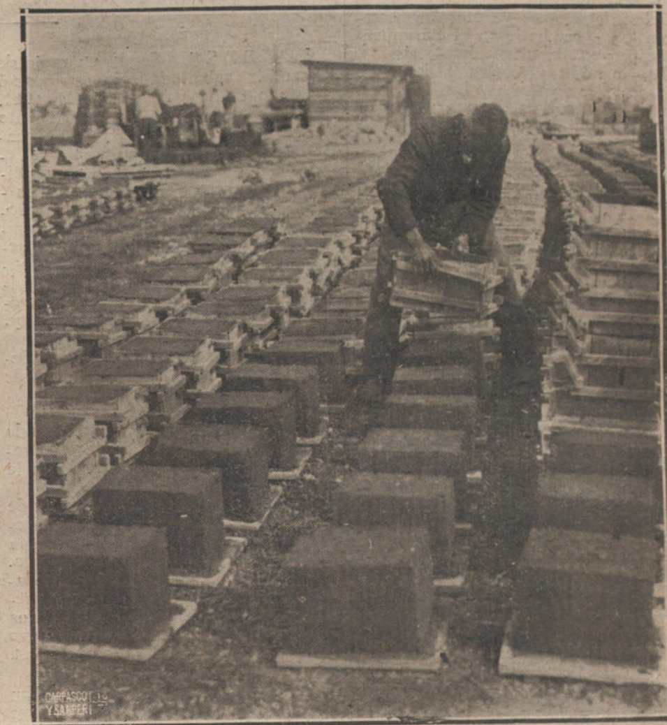
LA ESCASEZ DE VIVIENDAS EN ALEMANIA.—CONSTRUCCION DE COMPRIMIDOS DE ESCORIAS PARA LA SUSTITUCION DE LA PIEDRA NATURAL EN LAS EDIFICACIONES. PROCEDIMIENTO QUE ESTA CONSIGUIENDO EXCELENTE RESULTADO EN ALEMANIA.

Los partidos políticos deben incluir preferentemente en sus programas de gobierno, como un dogma de patrio-