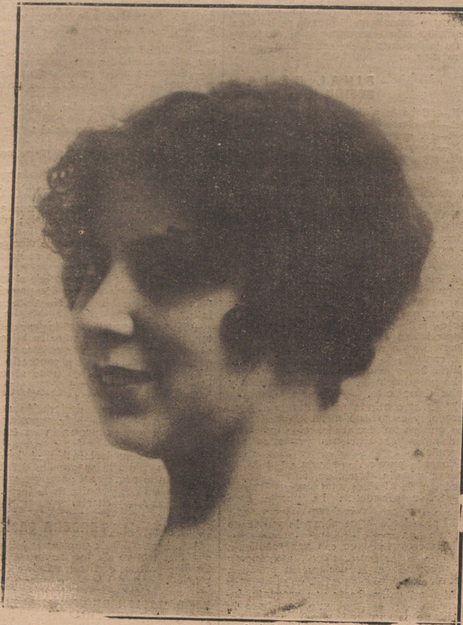
JULIA LAJOS, NOTABLE Y BELLA ACTRIZ, QUE ACTUA CON GRAN ÉXITO EN EL TEATRO DE LA LATINA