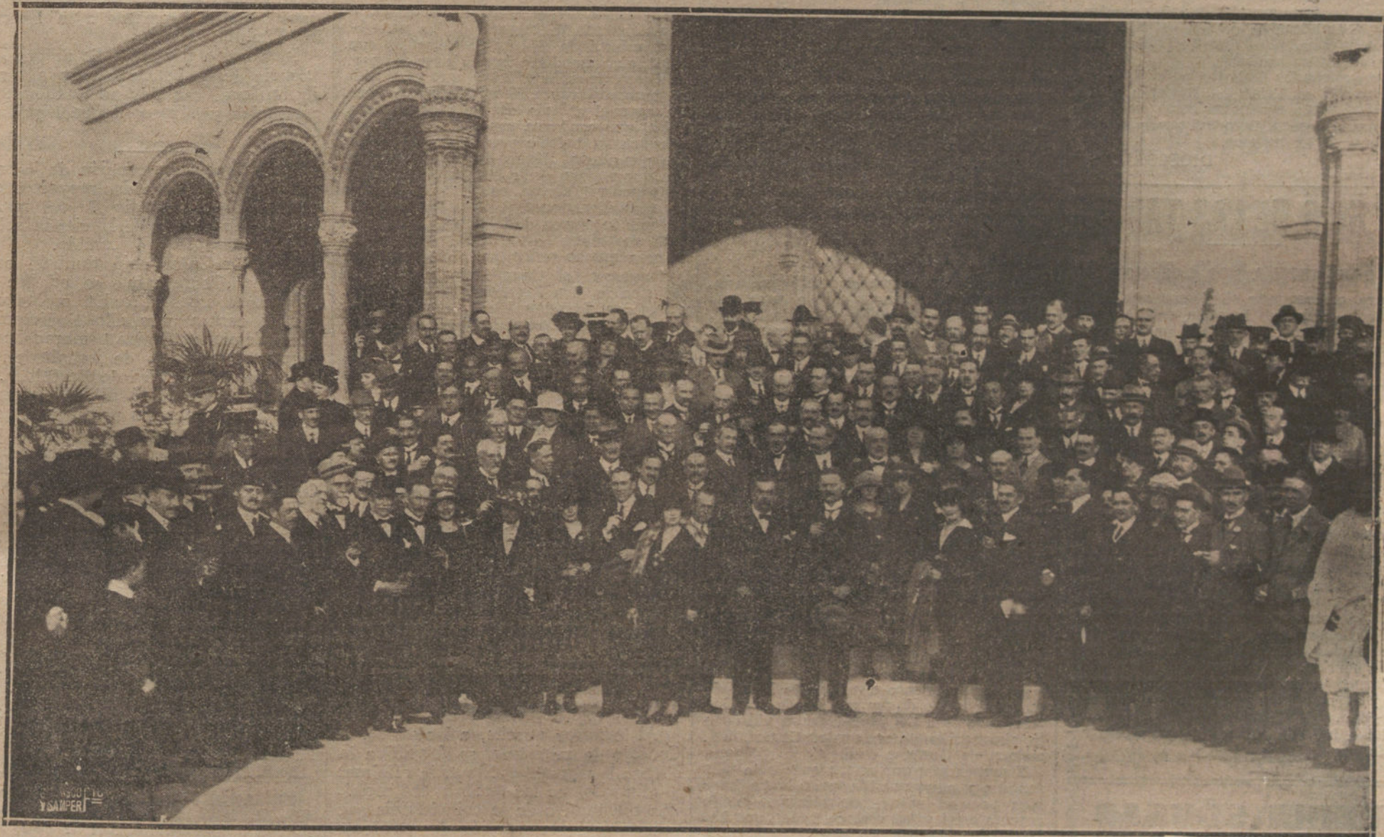
LOS DELEGADOS DEL CONGRESO POSTAL EN SEVILLA.—EL CONDE DE COLOMBI Y M. DECOPPET CON LOS CONGRESISTAS, SALIENDO DEL BANQUETE QUE LES FUE OFRECIDO EN EL PABELLON REAL DE LA FUTURA EXPOSICION HISPANOAMERICANA.

La literatura donjuanesca constituye dos períodos: el romántico, precursor