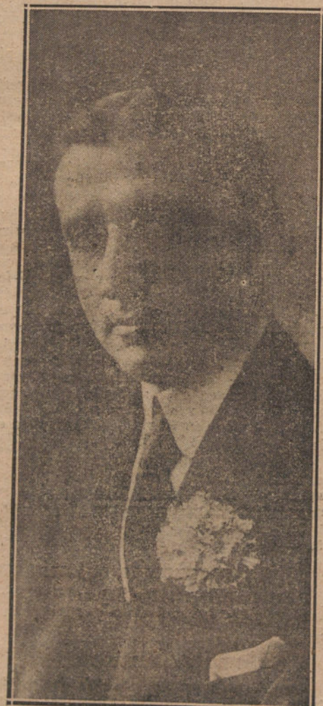
EL NOTABLE ACTOR PEDRO CABRE, QUE VIERNE REALIZANDO UNA BRILLANTE LABOR EN EL TEATRO DE LA LATINA

fué el primer actor que fué justos elogios está mereciendo, y Mario Albar el actor de imponderable caracterización y escuela moderna, que pronto será uno de los actores de mayor prestigio.