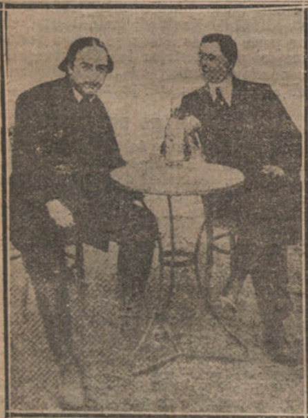
NOEL Y RELAMPAGUITO

El Alsina apócrifo guita, se enfada y protesta; pero no escribe. Alsina, el au-téntico, en cambio muy silencioso, con una modestia que se aproxima a la timi-dez, gusta de pensar inadvertido.