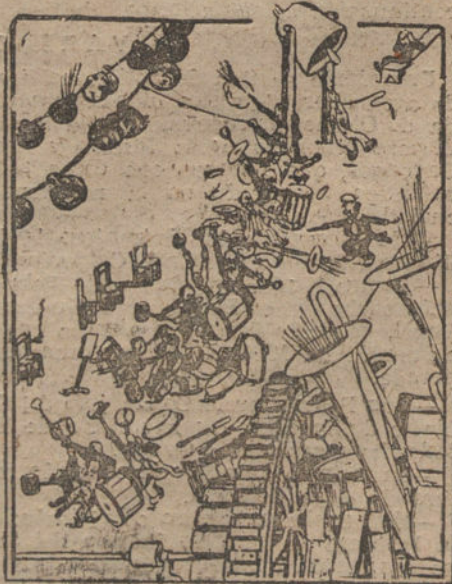
LA MUSICA DULCIFICA LAS COSTUMBRES (SO-BRE TODO LA MUSICA AMERICANA) (DE «COMEDIE ILLUSTRE».)