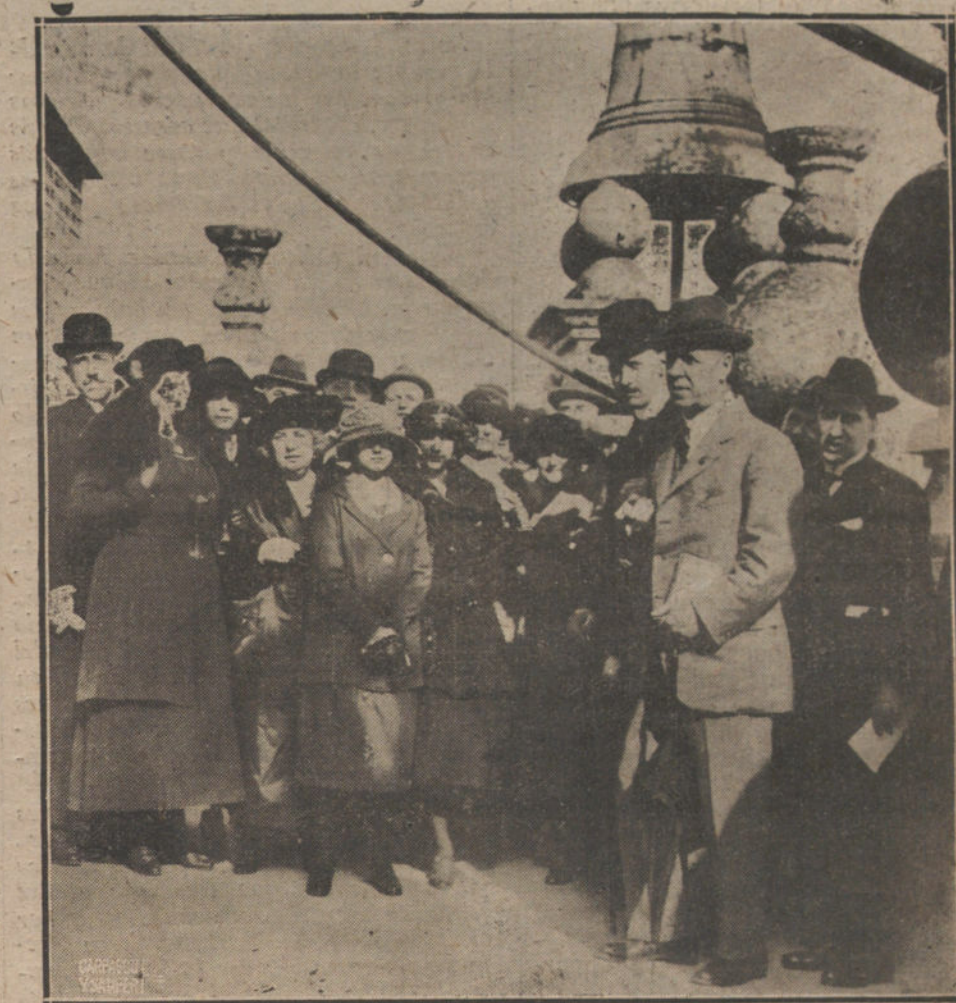
LOS DELEGADOS DEL CONGRESO POSTAL EN SEVILLA.—LOS CONGRESISTAS EN LO ALTO DE LA GIRALDA, ADMIRANDO EL PINTORESCO PANORAMA DE SEVILLA.

La guerra es cara; pero resulta más cara todavía cuando se hace en pobres condiciones y con escasez de material. Entonces se exige al soldado más es- fuerzo y se dificulta el desarrollo de la campaña. El país debe saber que