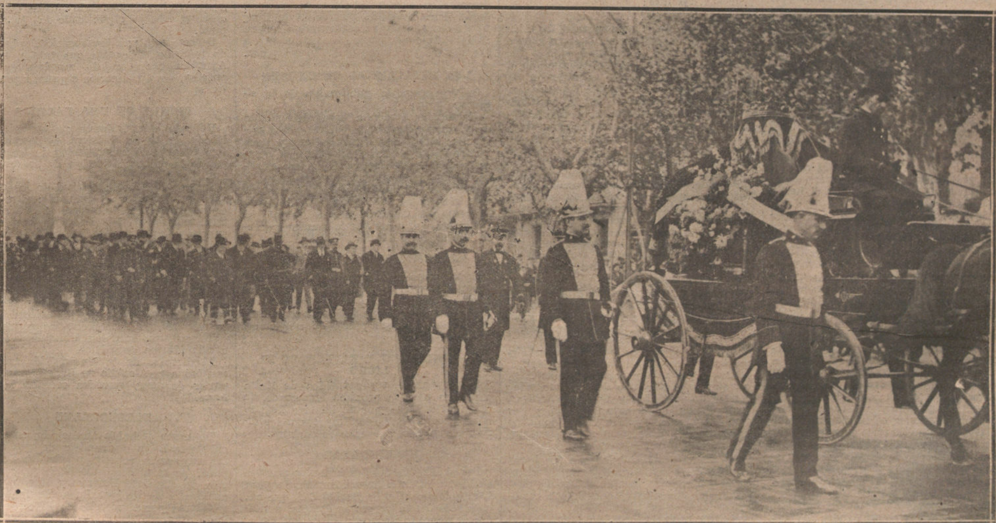
EL ENTIERRO DE POMPEYO GENER A SU PASO POR EL PASEO DE GRACIA. (FOT. BADOSA.)