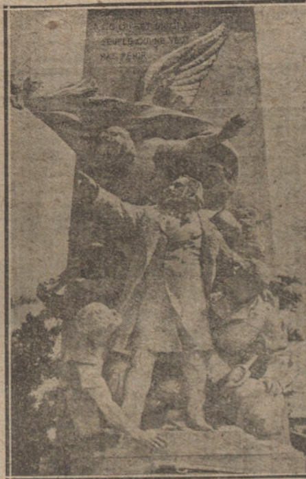
ESTATUA DE GAMBETTA

Muchas más son las historias de corazones célebres, como el de San Luis, al que cuando murió en Túnez se le sacó el corazón y fue hervido en agua y vino al fin de conservarlo, y como los de los Habsburgos, que desde el siglo XIII son conservados junto a sus cadáveres en vasos de cristal montados en oro; y como aquellos corazones que se supone, el de Napoleón I, comido