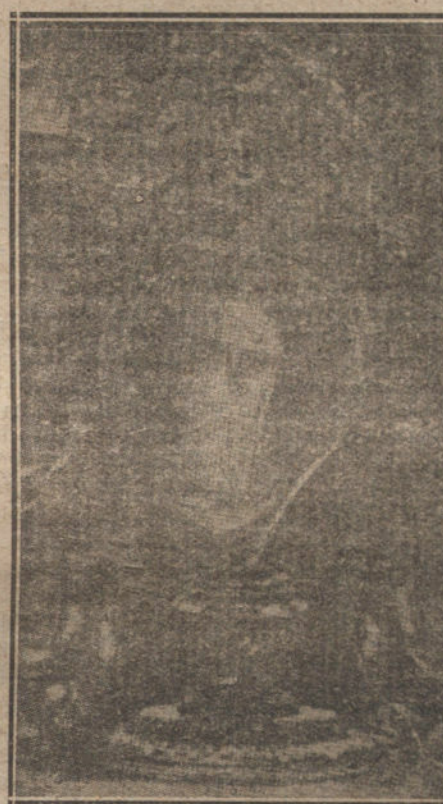
EL CORAZÓN DE SANTA TERESA DE JESÚS

Algo se arranca al cadáver de sus ilusiones, de sus cábalas, de las cosas que en las mismas cenizas se organizan