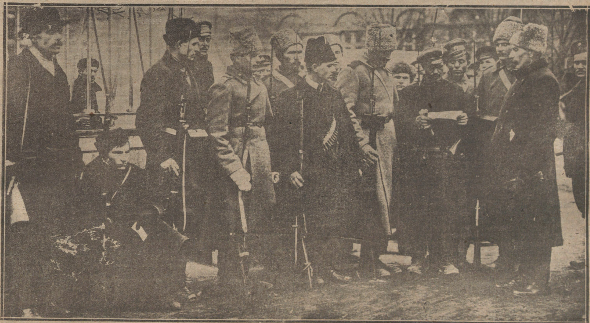
LOS BOLCHEVIQUES RUSOS.—TIPOS DE SOLDADOS DEL EJERCITO ROJO ESCUCHANDO LA LECTURA DE UNA ORDEN MILITAR. (PHOTO-THÉATRE)

Sólo ese divino color representa la pureza, el romanticismo y la virtud, y para los poetas, pensadores y artistas, sólo será Químico de hermana, madre o santa la de los ojos de cielo.