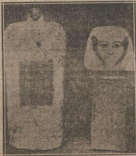
VASOS CANÓPICOS, DONDE LOS EGIPCOS CONSERVABAN EL CORAZÓN DE LOS DIFUNTOS

Los cristianos sólo con sus grandes hombres han hecho esa excepción, y por eso, entre otros corazones, se conservan el de Carlos de Anjón, en Angers; el