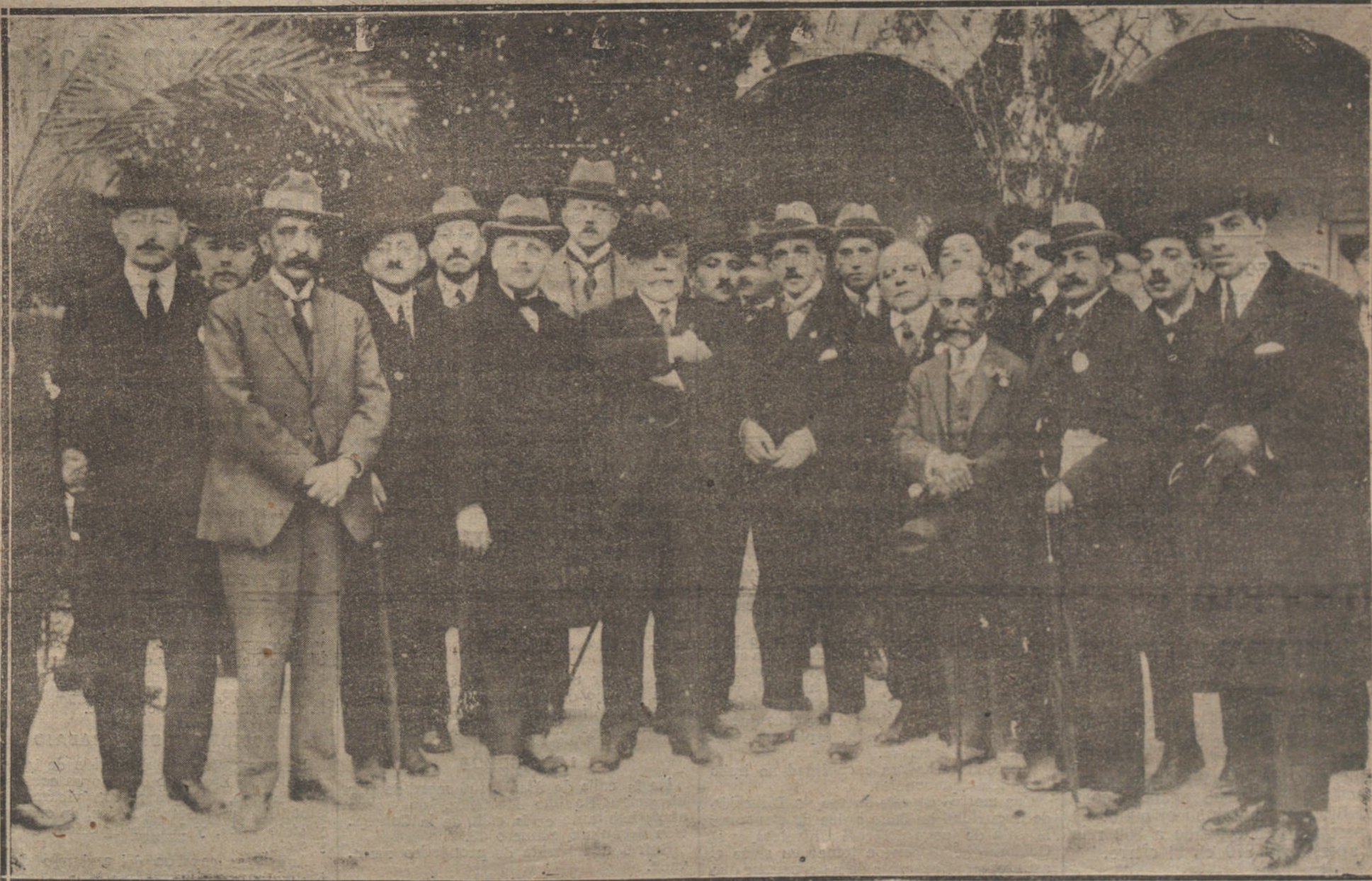
LOS DELEGADOS DEL CONGRESO POSTAL EN ANDALUCIA.—ARRIBA: LOS CONGRESISTAS VISITANDO LA MEZQUITA DE CORDOBA. EL DELEGADO DE ETIOPIA EN UN ANGULO DEL PATIO DE LOS LEONES DE LA ALHAMBRA. DE GRANADA. DEBAJO, LOS DELEGADOS AMERICANOS EN LA FINCA "RUZAFÁ", DE LOS SEÑORES CARBONELL, EN CORDOBA.