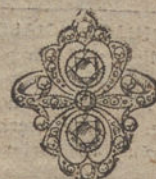
Núm. 15.—7 brillantes y diamantes. Ptas. 500.