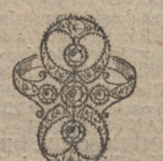
Núm. 8.—5 brillantes y diamantes. Ptas. 290.