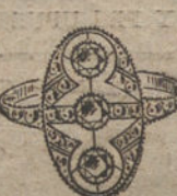
Núm. 12.—3 brillantes y diamantes. Ptas. 375.