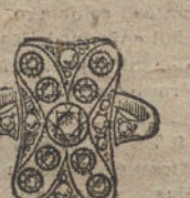
Núm. 14.—9 brillantes y diamantes. Ptas. 450.