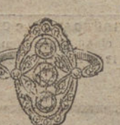
Núm. 9.—3 brillantes y diamantes. Ptas. 300.