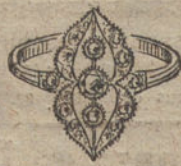
Núm. 3.—3 brillantes y diamantes. Ptas. 200.