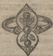
Núm. 1.—3 brillantes y diamantes. Ptas. 150.

MONTURAS DE PLATINO FINO Y ORO DE LEY 18 KILATES CONTRASTADO