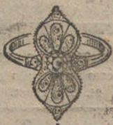
Núm. 2.—1 brillante y diamantes. Ptas. 175.