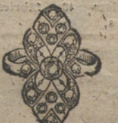
Núm. 11.—7 brillantes y diamantes. Ptas. 350.