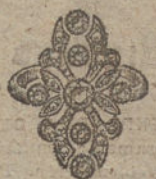
Núm. 10.—7 brillantes y diamantes. Ptas. 310.