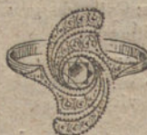
Núm. 7.—1 brillante y diamantes. Ptas. 275.