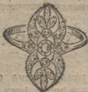
Núm. 6.—3 brillantes y diamantes. Ptas. 250.