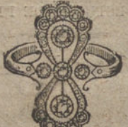
Núm. 13.—5 brillantes y diamantes. Ptas. 400.