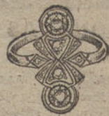
Núm. 5.—2 brillantes y diamantes. Ptas. 240.