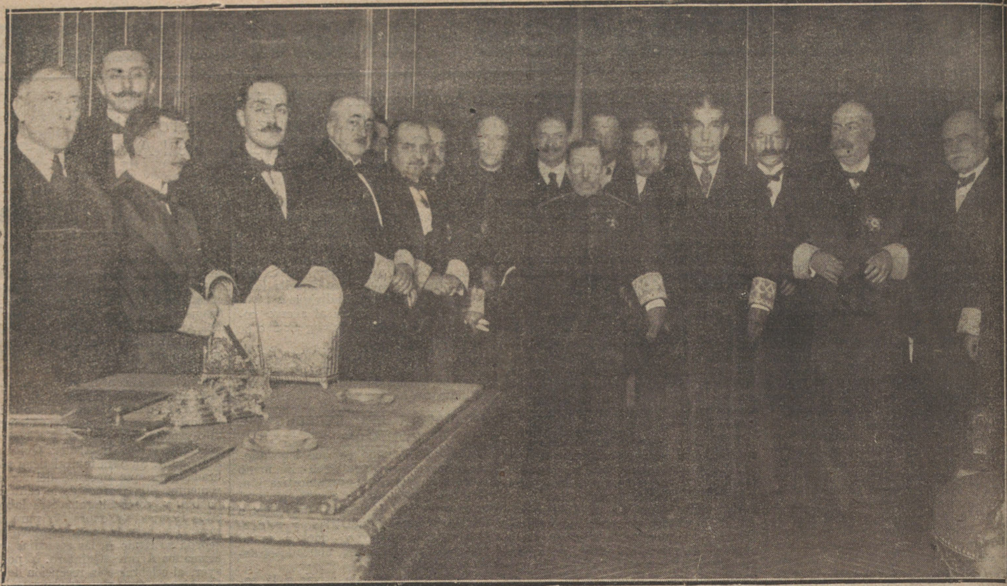
EL ILUSTRE EX MINISTRO DON FRANCISCO BERGAMÍN, AL TERMINAR SU NOTABLE DISCURSO DE APERTURA DEL CURSO DE LA REAL ACADEMIA DE JURISPRUDENCIA.

fera a decirnos que soy ahora mismo un académico