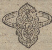
Núm. 4.—3 brillantes y diamantes. Ptas. 225.