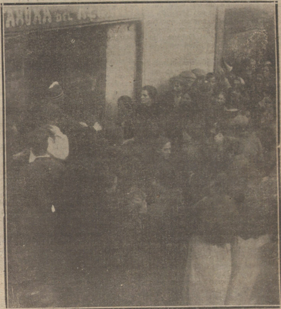
EL NUEVO CONFLICTO DEL PAN.—EL PÚBLICO AGOLPÁNDOSE A LA PUERTA DE UNA TALLERÍA, DONDE IMPREVISTAMENTE SE HAN ELEVADO LOS PRECIOS.

Desde los comienzos de la popularidad maurista, comienzos que, debemos repetirlo con orgullo tuvieron lugar en estas columnas, venimos anunciando los peligros. Se formó el Gobierno del 19, y vimos cómo la preponderancia del maurismo averiado podía traer una catástrofe para la parte sana. Se hicieron las elecciones, y otra vez el dominio de los averiados