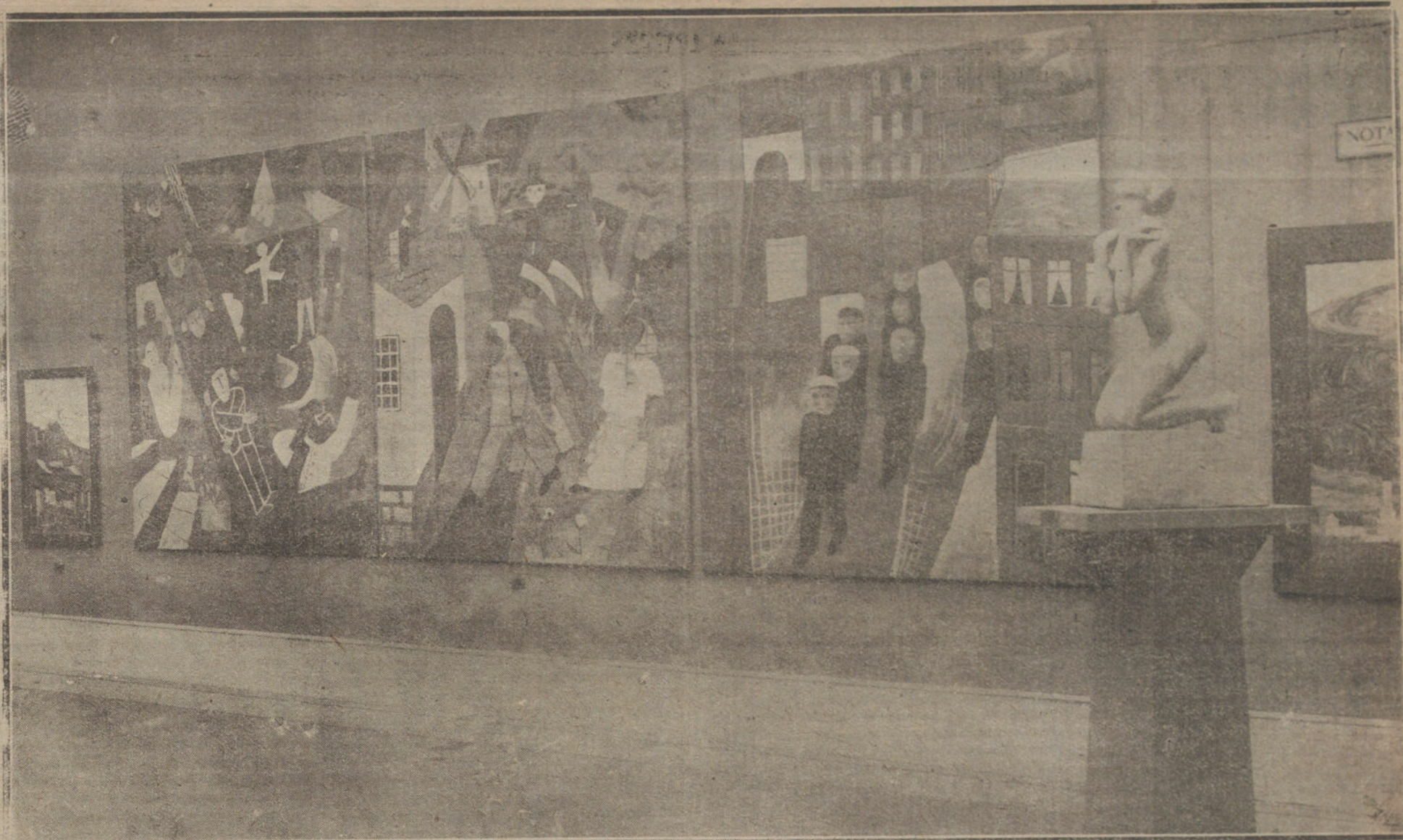
POSICION DE ARTE EN BERLIN.—CURIOSA COLECCION DE CUADROS QUE EXPONE W. HUT, Y QUE ESTAN SIENDO MUY CELEBRADOS, Y UNA DE LAS ESCULTURAS DE EMMO VON DER HOF E.

go que unir mi suerte a la de ese hombre. Es mi destino. La Revolución no me perdonaría el que la abandonase a la hora del peligro. Nuestra obra amenaza derrumbarse. El mundo entero se confabula contra ella. Hay que defenderla, con los dientes y con las garras, hasta verter nuestra última gota de sangre. Rusia nos llama. ¡La santa Rusia nos necesita!