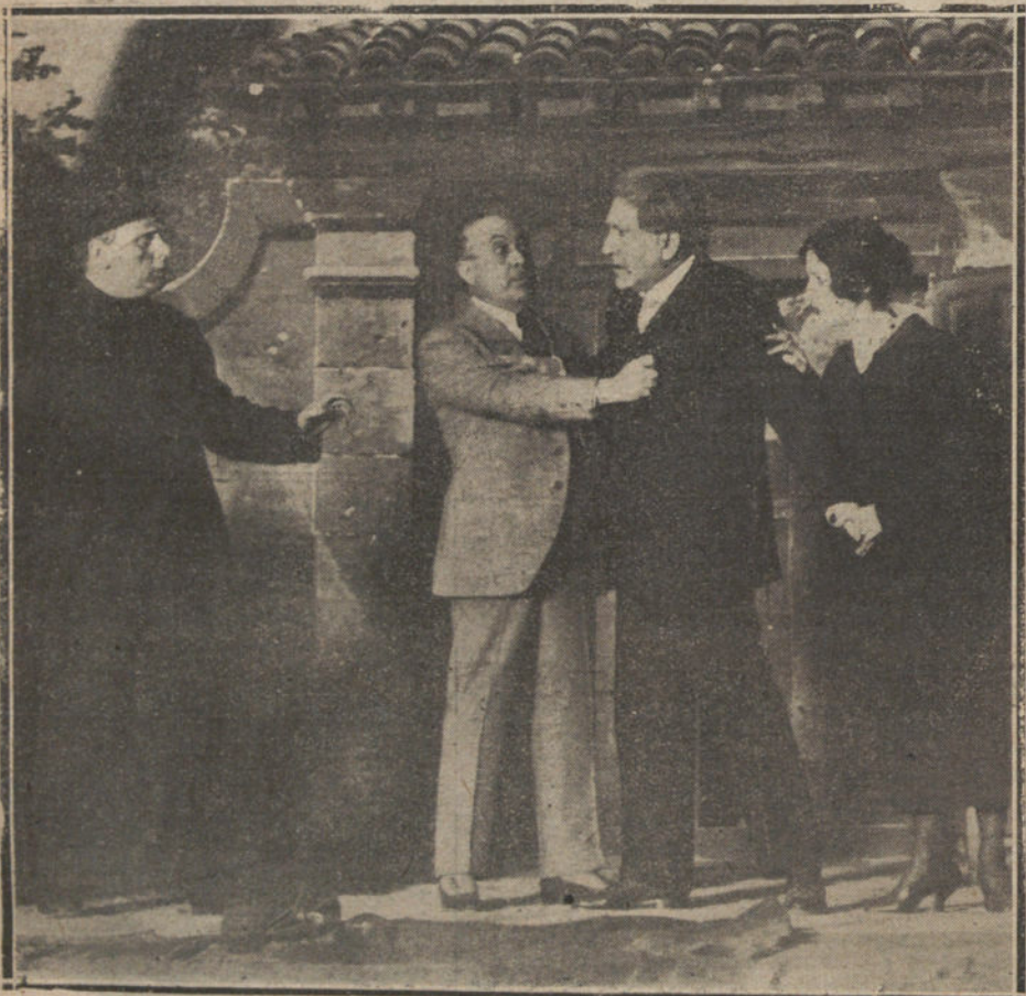
UNA ESCENA DEL DRAMA «LA PRINCESITA RUBIA». ESTRENADO ANOCHES EN EL COLISEO IMPERIAL.

Me voy a Londres así que tenga arreglados los papeles. ¿Quiere encargarse de hacérmelos despachar? Ten-