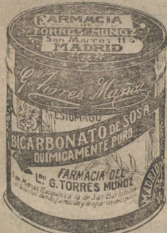
LATAS ECONOMICAS DE 1 1/2 KILOS