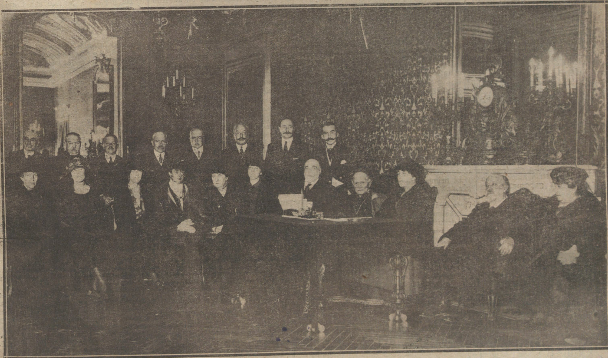
CONSTITUCION DE LA JUNTA ORGANIZADORA DEL «AGÜINALDO DEL SOLDADO EN MARRUECOS», ACTO VERIFICADO AYER TARDE EN EL MINISTERIO DE LA GUERRA.

y de nuevo es el señor La Cierva quien gobierna y dirige las huestes mauristas, con la oposición, claro está, de la