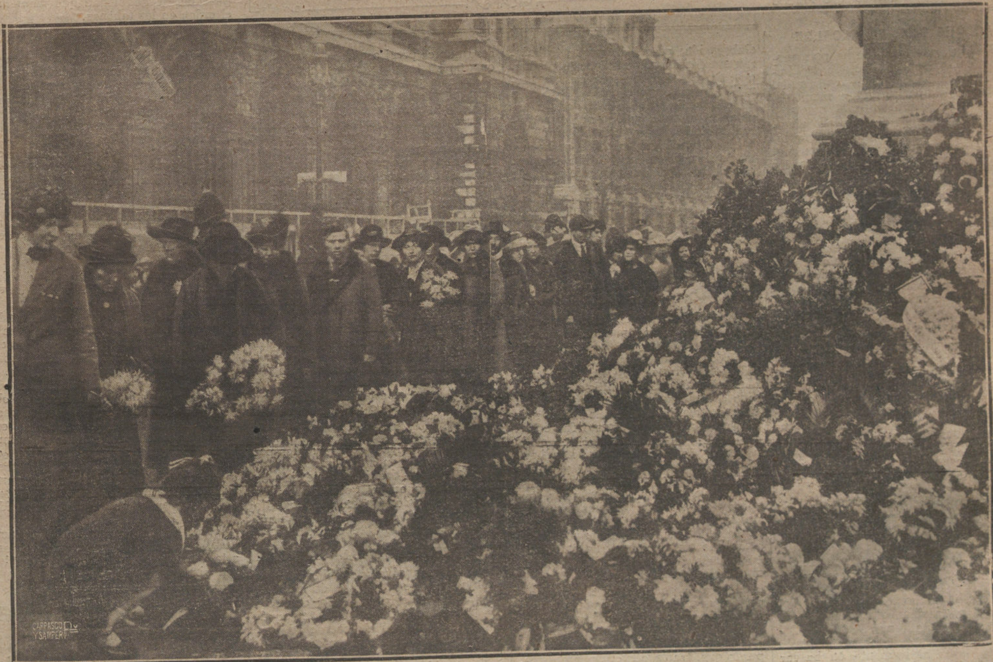
EL MONUMENTO ERIGIDO EN LONDRES A LA MEMORIA DEL SOLDADO DESCONOCIDO, CUBIERTO DE CORONAS, CON MOTIVO DE LA CONMEMORACION DEL ARMISTICIO.

Los tenientes de alcalde celebraron anoche una reunión en el Ayuntamiento para ocuparse del conflicto del pan. Depués de permanecer reunidos media