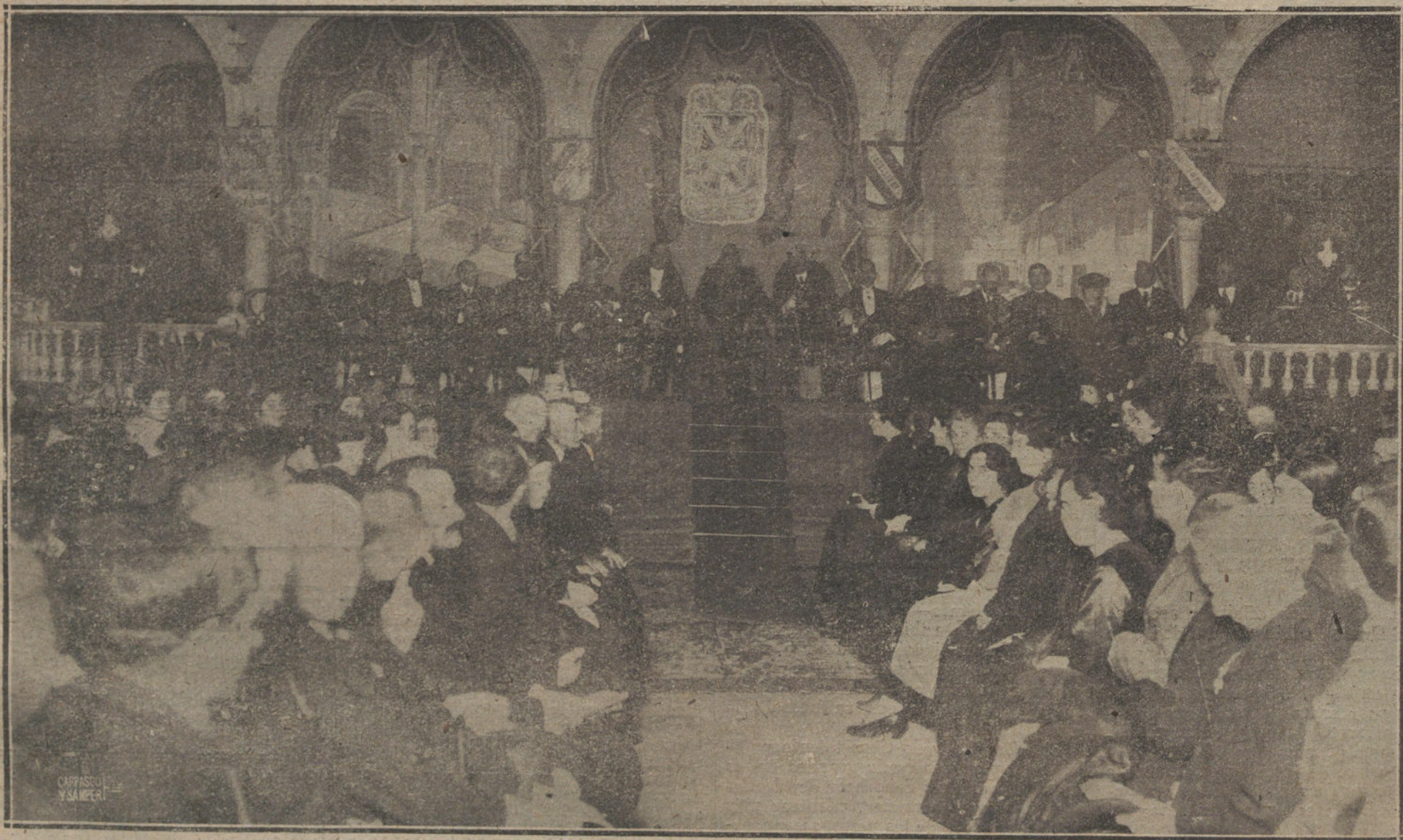
LAS AUTORIDADES CIVILES, RELIGIOSAS Y MILITARES QUE PRESIDIERON EL XX CERTAMEN LITERARIO CELEBRADO POR LA REAL ASOCIACIÓN DE SAN CASIANO DE SEVILLA.