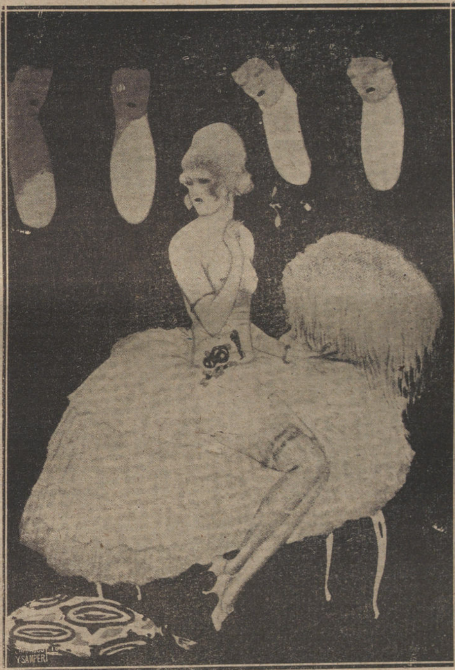
ALEGORIA DE LA SUGESTIVA REVISTA «CHOFER... A ROSALES», QUE SE ESTRENARÁ PRÓXIMO 15 DE DICIEMBRE. (PUBLICIDAD ELÍAS.)

No terminaremos estas líneas sin de- dicar el elogio que merece el veterano e inspiradísimo pintor y poeta Rusi- ñol, el autorazo de las barbas de pla- ta, por su afiadísima cooperación en todo lo que a presentación artística se refiere, pues «El consagrado padre de los «Jardines de Aranjuez» ha puesto todo su arte, todo su intelecto artís- tico al servicio del mejor lucimiento de los diversos cuadros de la revista.