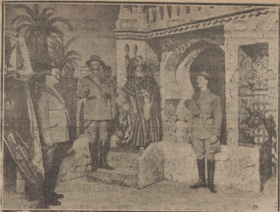
UNA ESCENA DEL SEGUNDO ACTO DE «LA CASA CERCADA», OBRA QUE SE ESTRENA MAÑANA EN EL TEATRO DE LA PRINCESA

proyecto de acuerdo del servicio de giro postal. Han declarado que se adhieren a este Convenio 27 países. Bien entendido que cada país de la Unión que tenga el franco por unidad monetaria tiene la facultad de fijar en su moneda interior, de acuerdo con la Administración de Correos de Suiza, la equivalencia de los portes arriba indicados.