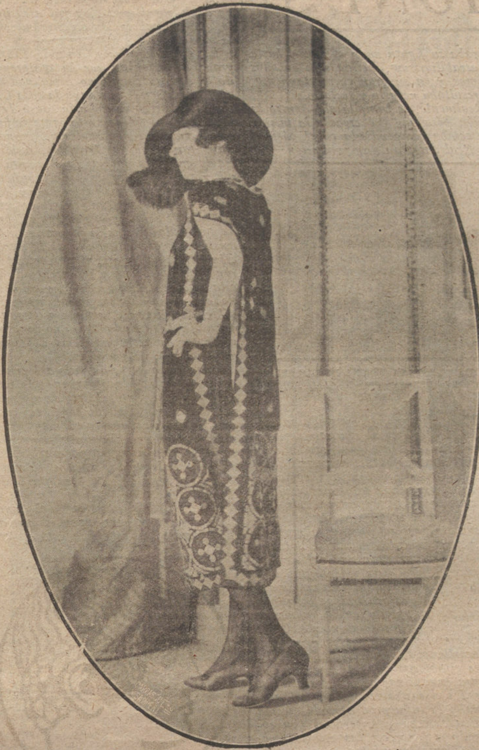
TRAJE DE PAÑO NEGRO, BORDADO CON APLICACIONES DE HUESO Y PIEDRAS, A SEMEJANZA DE LOS MODERNOS COLLARES DE ESTILO ORIENTAL, INVENCION DE LA CASA MAILYNEUX

También participa que el comandante general de Larache le comunica que a las ocho horas treinta minutos del día, fué agredido servicio protección aguada posición Kesil, siéndolo poco después dicha posición y su avanzadilla, resultando herido grave soldado batallón Chilena Santiago Zumioles, que falleció poco después resultado herido.