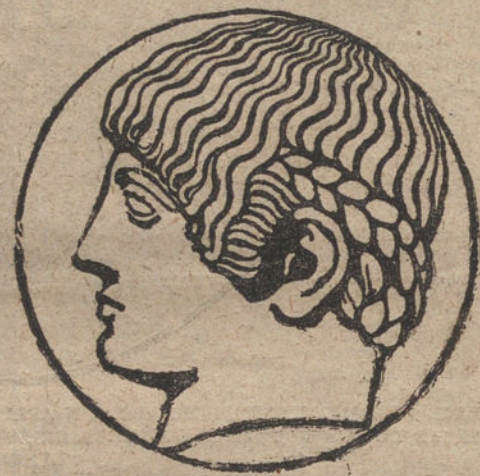
EL SELLO QUE CARACTERIZA A LA RESIDENCIA. TOMADO DE UNA CABEZA DE EFEBEO. DESCUBIERTO EN GRECIA

Entre los residentes, como el principio de eterna y pura juventud que caracteriza a la Residencia, está ese ate-