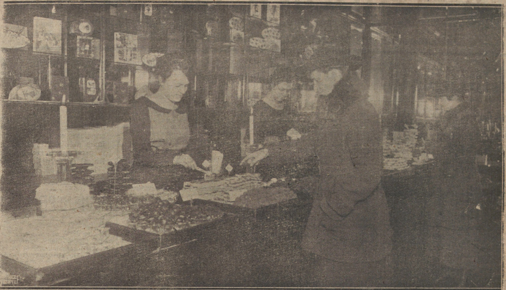
BERLIN SIN ALUMBRADO. — ASPECTO DE UNO DE LOS ESTABLECIMIENTOS MAS IMPORTANTES DE BERLIN ALUMBRADO CON VELAS, EN SUSTITUCION DE LA ELECTRICIDAD, MEDIDA COMINADA A CAUSA DE LA FALTA DE FUELDO.