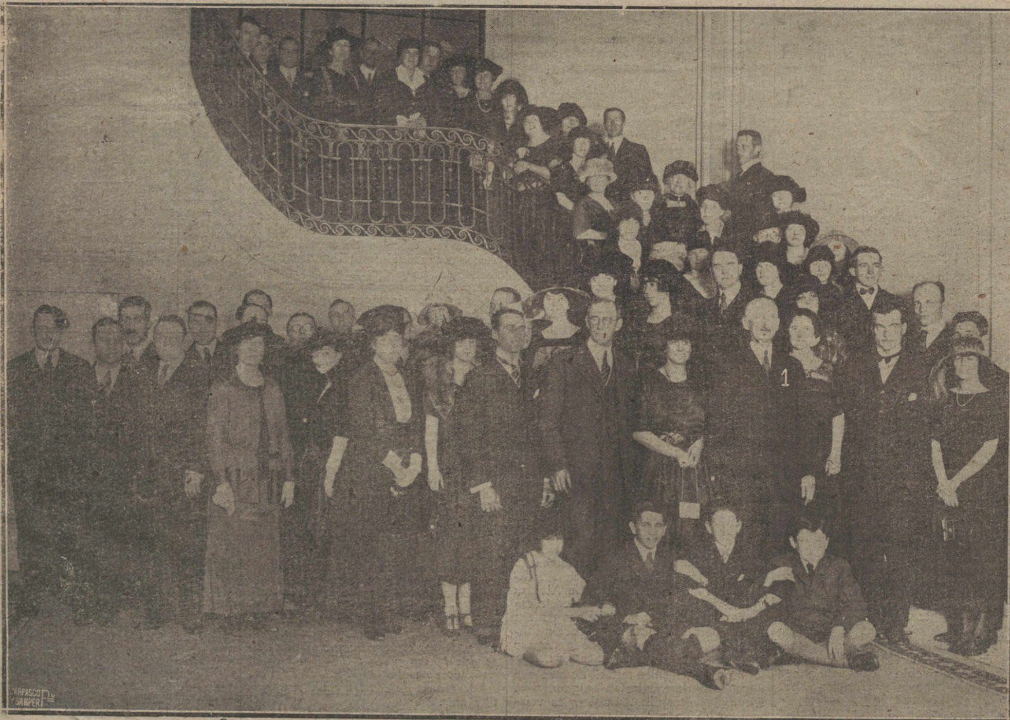
EL EMBAJADOR DE LOS ESTADOS UNIDOS, MR. WILLARD, CON SU ESPOSA Y LOS INVITADOS QUE ASISTIERON AL TE CELEBRADO EN LA EMBAJADA CON MOTIVO DEL THANKSGIVING (DÍA DE GRACIAS).

—Y ahora, después del éxito de «La Dogaresa»... Todas sus obras están pasando por los carteles del Tivoli o del Victoria. Ahora estrenará «El triunfo de Arlequín», cuya postura en escena