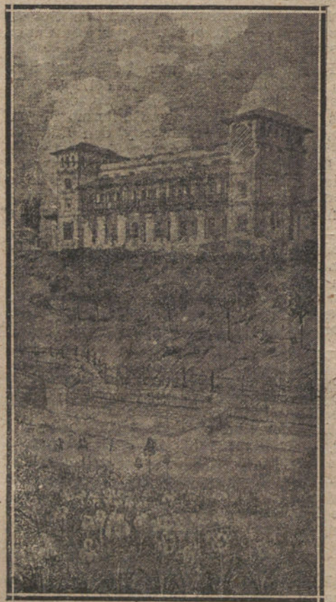
VISION DE LA RESIDENCIA. POR RAFAEL ROMERO CALVET

Engarzada sobre el ribazo — sobre el que pasaba un canal en tiempos — como una casa solariega y solanera, por lo castiza y lo abierta al aire que resultaba, era un edificio señero, ejemplar, con cuyo espíritu he ido simpatizando día tras día al ver que allí se conserva toda la frescura, el orgullo y la singulari-