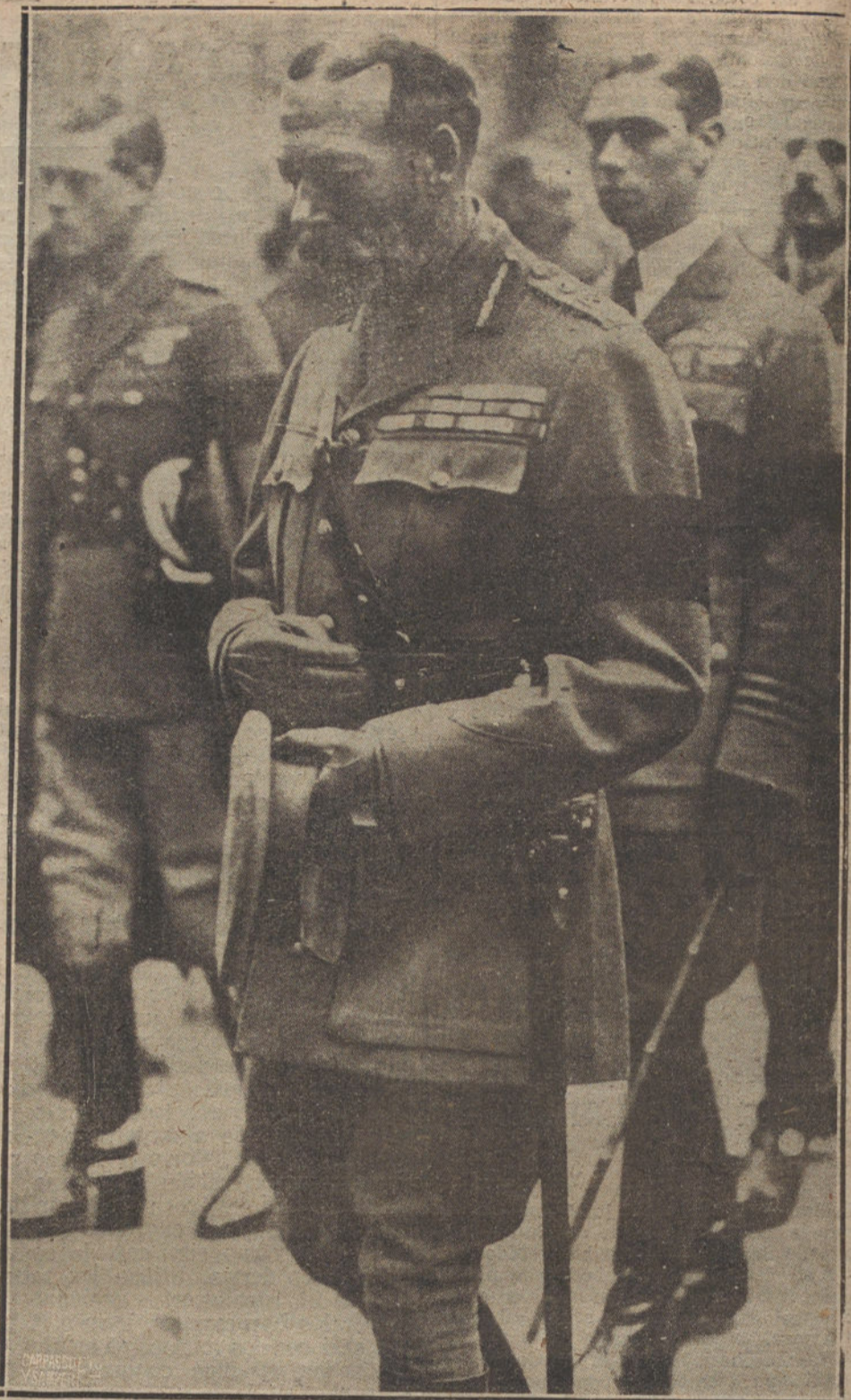
REY DE INGLATERRA PRESENTANDO EL TRASLADO DE LOS CADAVERES DE LOS SOLDADOS MUERTOS EN LA GUERRA. CEREMONIA VERIFICADA EN LONDRES RECIENTEMENTE.