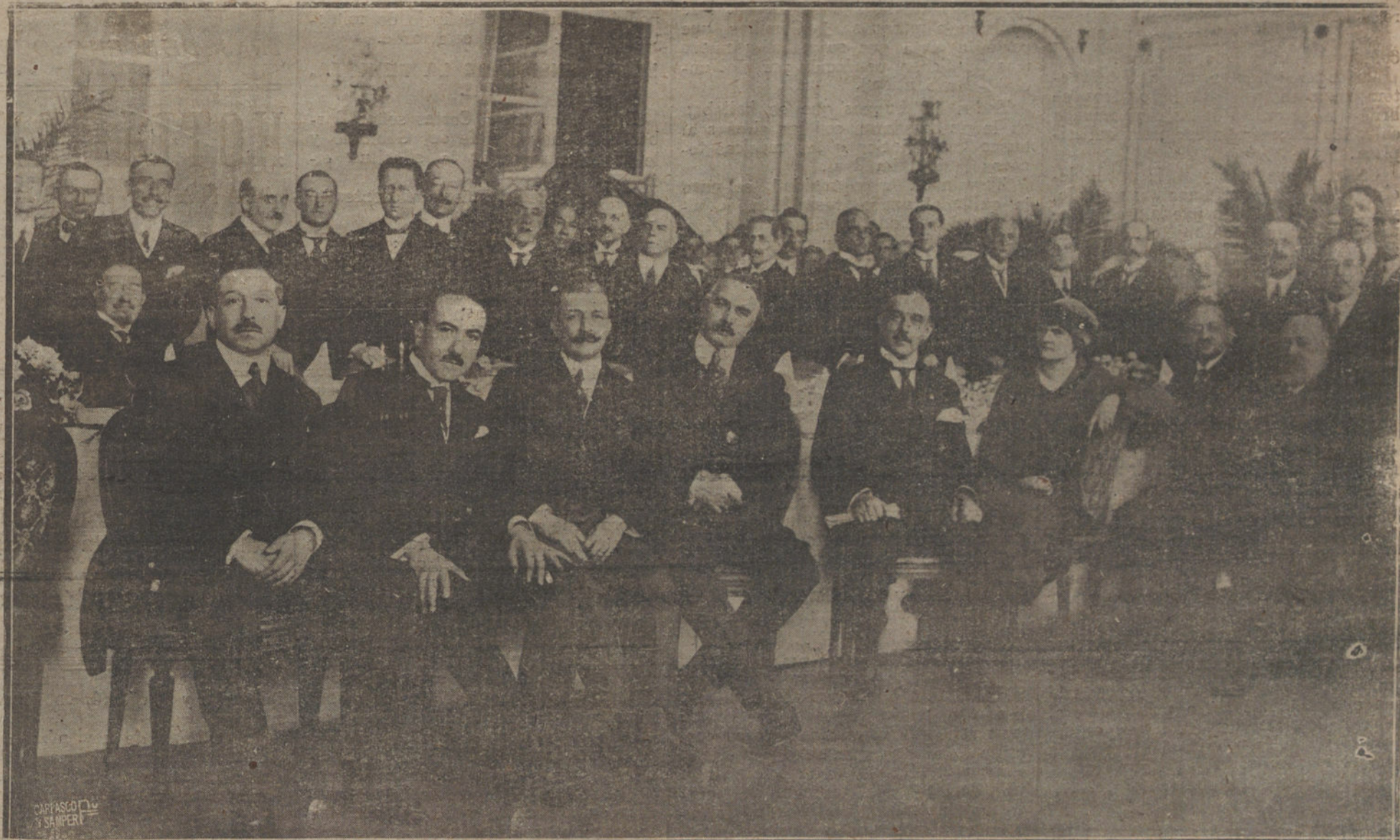
BANQUETE OFRECIDO EN EL RITZ POR