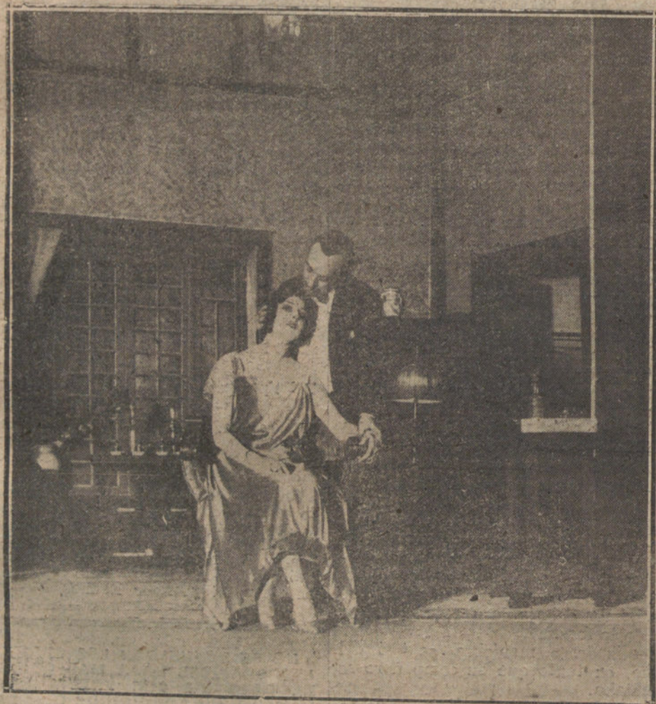
SCENA FINAL DEL PRIMER ACTO DE LA COMEDIA DE FRANCISCO ACERAL, «EL ANTEPADO». ESTRENADA ANOCHE EN EL TEATRO ESPAÑOL