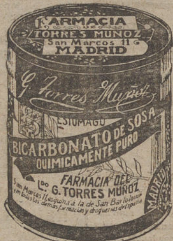
LATAS ECONOMICAS DE 1 1/2 KILOS