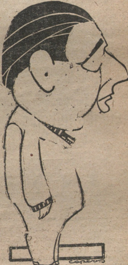
RAFAEL ARCOS, EL POPULAR «MAQUETISTA»

Con una «réclame» a todo gusto, y también en vestidos de Egmond (93 nada más según los carteles), se ha presentado