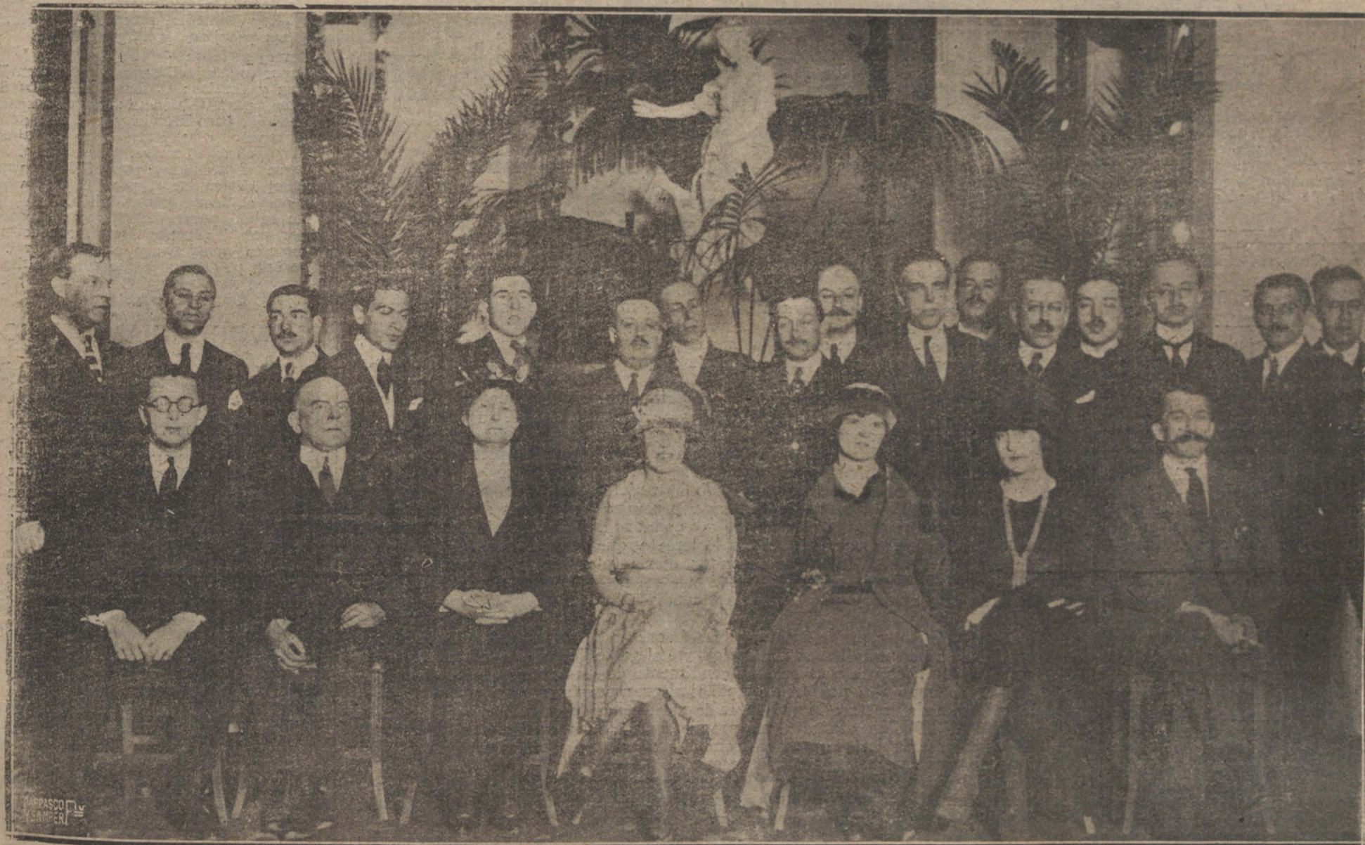
ASISTENTES AL BANQUETE EN EL QUE LOS SEÑORES NORTHAMERICANOS OBSECUARON A LOS REPRESENTANTES DE LA PRENSA.

En el Ayuntamiento se celebrará mañana una reunión de funcionarios para estudiar el problema del abastecimiento de la carne, a cuyo fin se tratará del proyecto de ampliar los mataderos y construir un gran frigorífico.