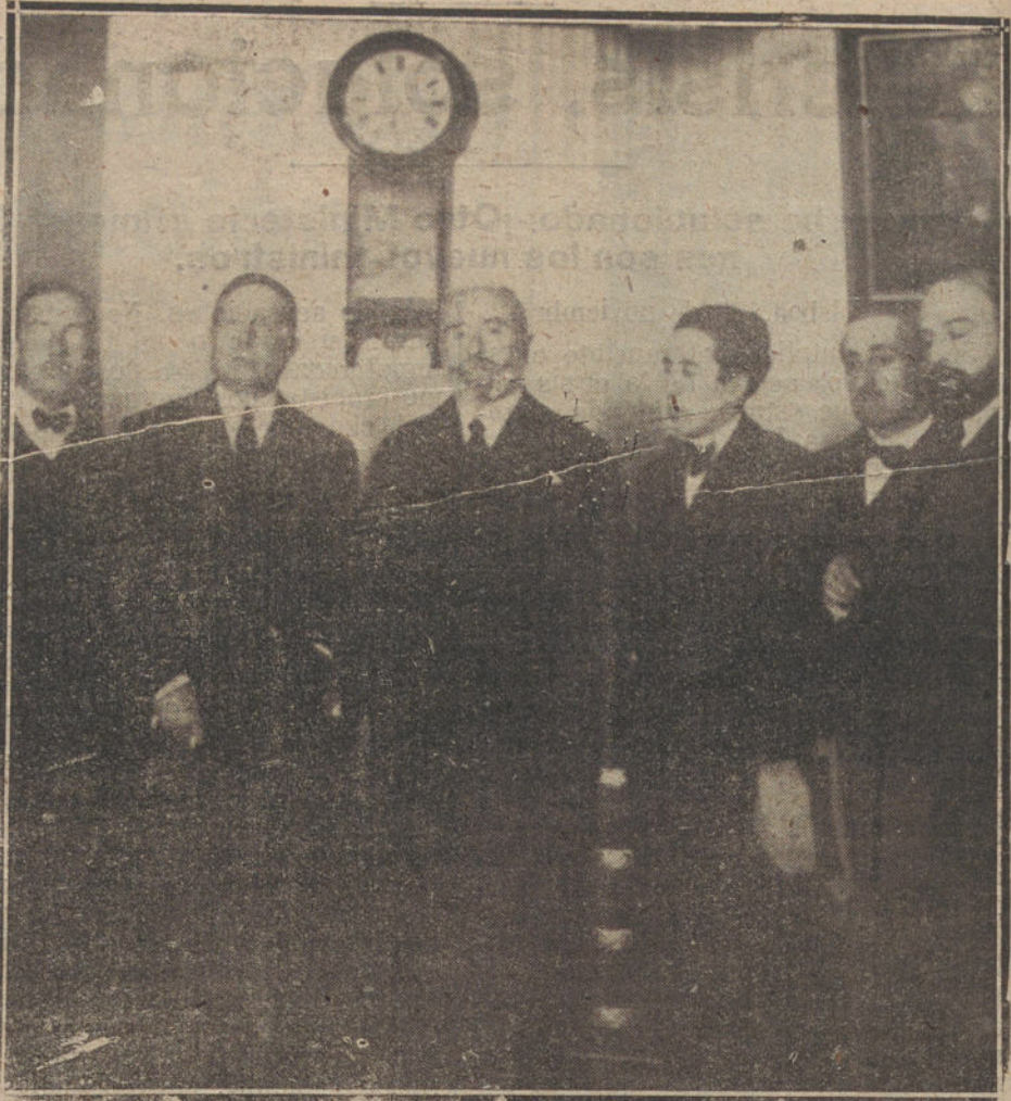
EL SEÑOR LA CIERVA L. TERMINAR LA CONFERENCIA DADA AYER EN EL ATENEO.

Frente a los borrones, que son como crisálidas de lo más impensado, los fantasmas de las firmas son menos fantástico y brota de esas experiencias una especie de arte decorativo abominable. Los fantasmas de las firmas son como aparatos de adorno de una simetría casi desesperante. Sin embargo, algo hay en ellos y se pueden encontrar entre los rasgos el que descubre de lo que se ha de morir o el que promete la fortuna. Lo malo que hay en ese gesto de sacar el duplicado de la firma es que es como el aplastamiento de la firma, a la que se la salen todas las tripas al ser aplastada.