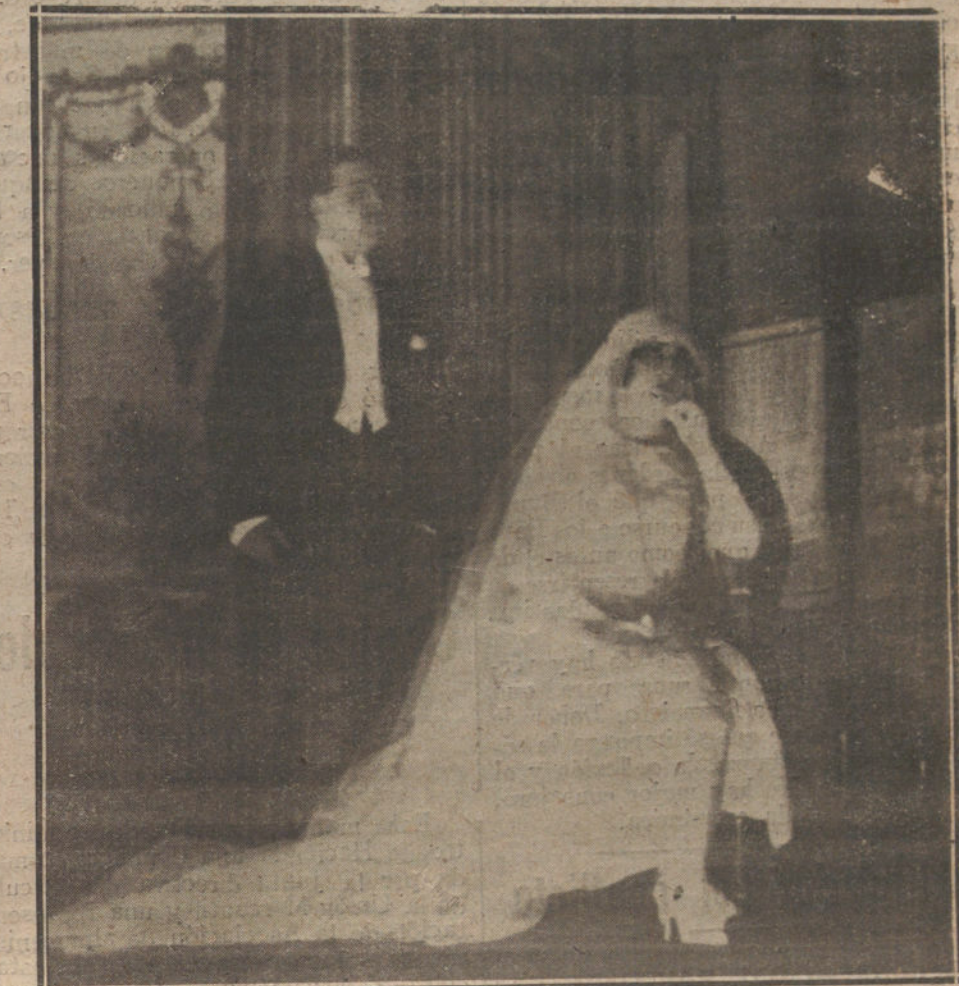
UNA ESCENA DE «LA FERIA DE LOS MARIDOS», OBRA ESTRENADA ANOCHÉ EN EL TEATRO DE LARA

Otro factor importantísimo es, a nuestro entender, el desarrollo del problema social. La orgía de los ricos, la inercia de los industriales, la codicia de los comerciantes y la inquietud de las clases trabajadoras, son causas de un constante desarreglo económico, que repercute fuertemente en la producción nacional. Sin que nadie se haya cuidado de nivelar las demandas excesivas con la fabricación escasa, el desequilibrio no podía tener otra cosa que la inestabilidad de los capitales. A diario venimos estudiando nosotros este aspecto de la lucha social. Justos los tres factores, a los cuales debe