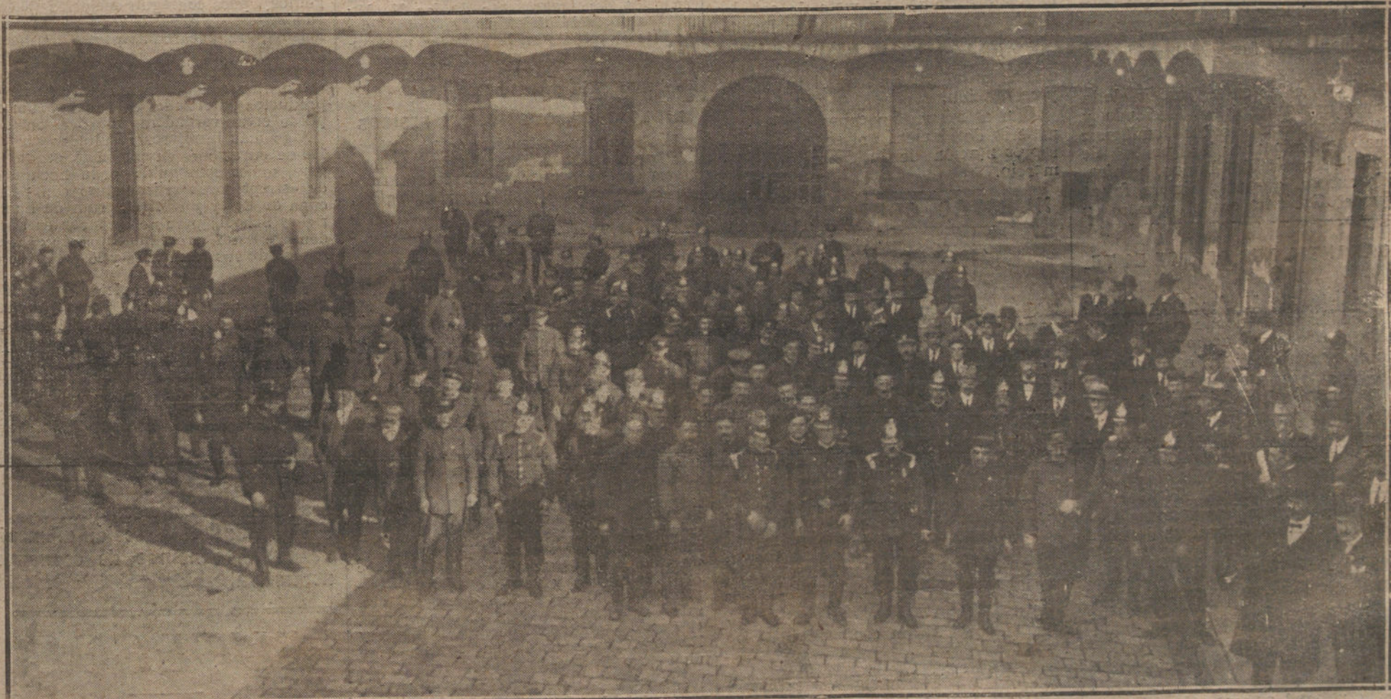
EL CONGRESO INTERNACIONAL DE BOMBEROS.—VISITA DE LOS CONGRESISTAS AL CUARTEL DE LOS BOMBEROS DE BARCELONA.

Hoy se ha podido demostrar que aquellas disposiciones no sólo no son atentatorias a la marcha económica del país sino que vienen a prevenir y limitar el