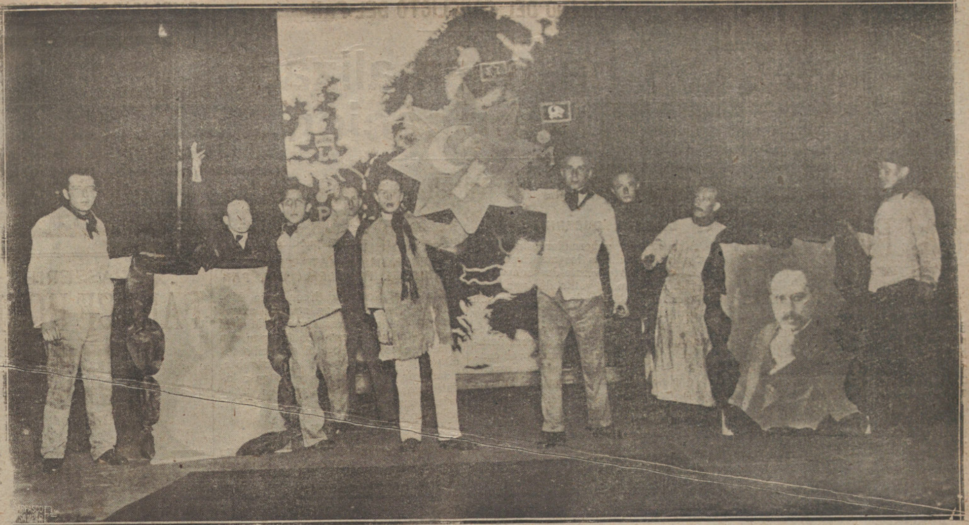
EL TEATRO PROLETARIO.—EN BERLIN SE HA CREADO UN TEATRO LLAMADO DEL PROLETARIADO, DONDE LOS OBREROS REPRESENTAN OBRAS SOBRE TEMAS REVOLUCIONARIOS. AQUÍ UNA DE LAS REPRESENTACIONES. ES LA APOTEOSIS DE UNA REVISTA, EN LA QUE APARECEN LOS RETRATOS DE ROSA LUXEMBURGO Y CARLOS LIEBKNECHT, SOBRE EL MAPA DE LA NUEVA EUROPA PROLETARIA.

to, se cayó a la cueva de la casa, produciéndose lesiones graves.