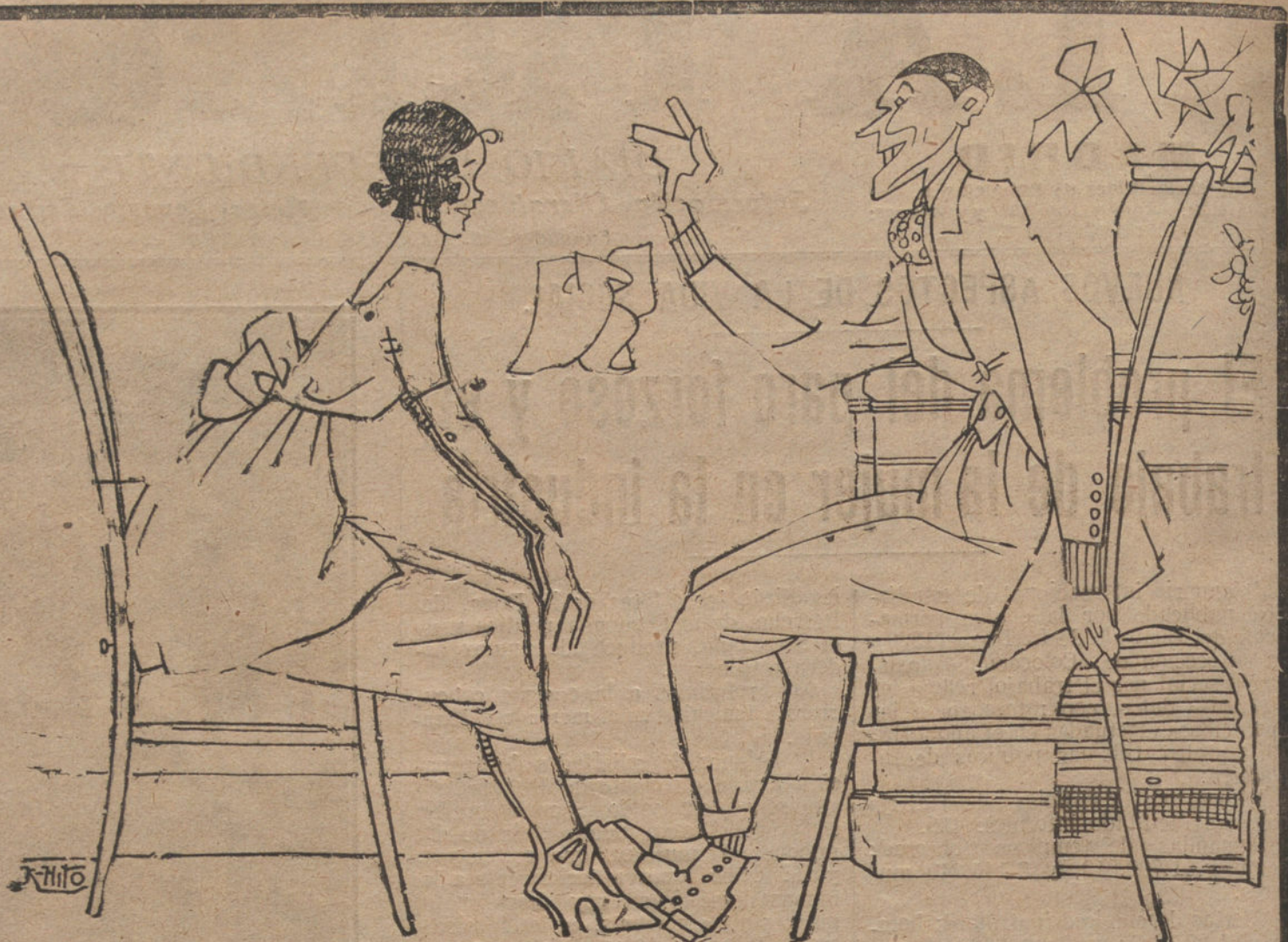
JUEGOS DE PRENDAS EN MAHON

El embajador de España en París telegrafía diciendo que el Gobierno sueco ha comunicado al secretario de la Sociedad de las Naciones la decisión de Suecia a colaborar con cien soldados y varios oficiales a la actuación de la Liga de las Naciones en Polonia y Lituania.