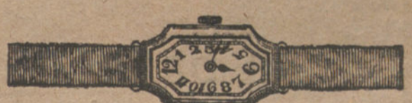
Núm. 6.—Áncora de precisión, oro de ley 18 quilates con pulsera de moiré.