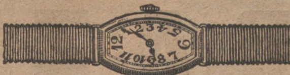
Núm. 3.—«Tonneau», áncora de precisión, oro de ley 18 quilates con pulsera de moiré.