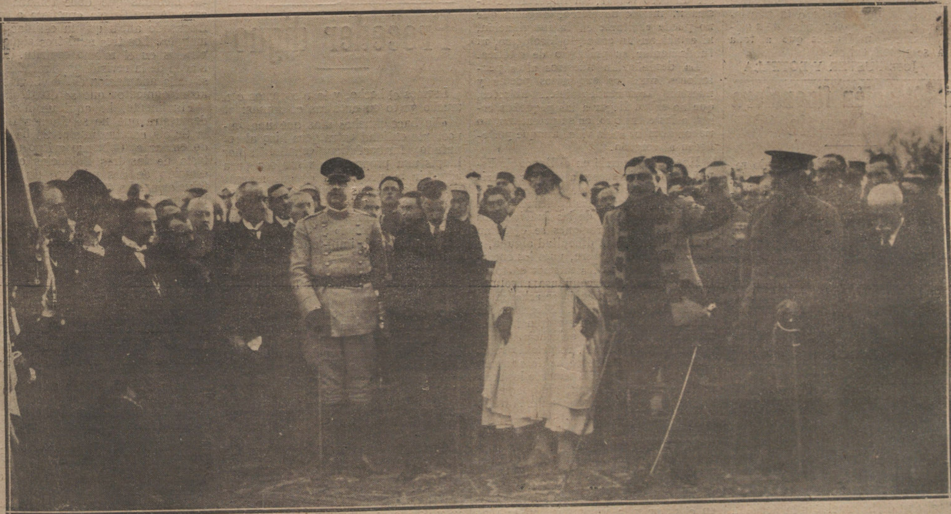
EL HOMENAJE AL GENERAL JORDANA EN TETUAN. EL GENERAL BERENGUER RODEADO DE TODAS LAS AUTORIDADES, PRONUNCIANDO UN DISCURSO DURANTE LA INAUGURACION DEL MONUMENTO. (FOT. RUBIO)

terresantísimo fenómeno social, que parece preocupar hondamente al mundo? Ciertamente no puede concretarse su origen; sería pueril atribuirlo solamente a las necesidades de la guerra; pues éstas, por sí mismas, no son capaces