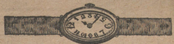
Núm. 4.—Ovalado, áncora de forma, oro de ley 18 quilates con pulsera de moiré.