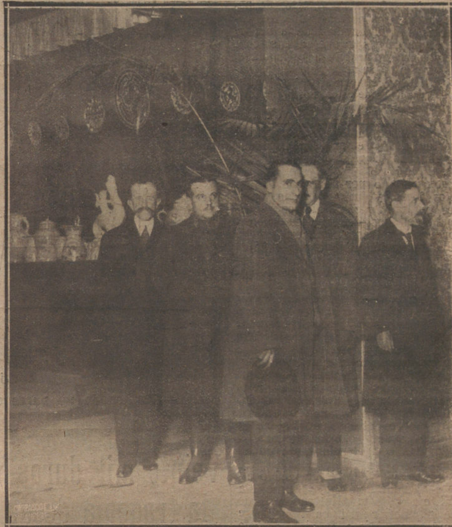
UN DETALLE DE LA EXPOSICION DE CERAMICA ARTISTICA, INAUGURADA AYER EN EL SALON DE EXPOSICIONES DEL CIRCULO DE BELLAS ARTES.

¿Es esto una mera consecuencia de la escasez de brazos utilizados o destruidos en la lucha mundial? ¿Es una evolución económica impuesta por la marcha arrolladora del progreso? ¿Es una inicial reivindicación de los discutidos derechos de la mujer, cuyo logro han conquistado las campañas de política feminista? ¿Es la victoria del trabajo de la mujer sobre el del hombre, por sus condiciones de mayor baratura, perfección y rendimiento? ¿Es, por lo mismo, el resultado de la experiencia y la predilección del capital y de los técnicos directores de empresa, en esta época naciente de intensificación de la producción y de renovación, mal disimulada, de la contienda universal, por el intercambio? ¿A qué causas, en fin, obedece este in-