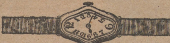
Núm. 5.—Festoneado, áncora de precisión, oro de ley 18 quilates con pulsera de moiré.