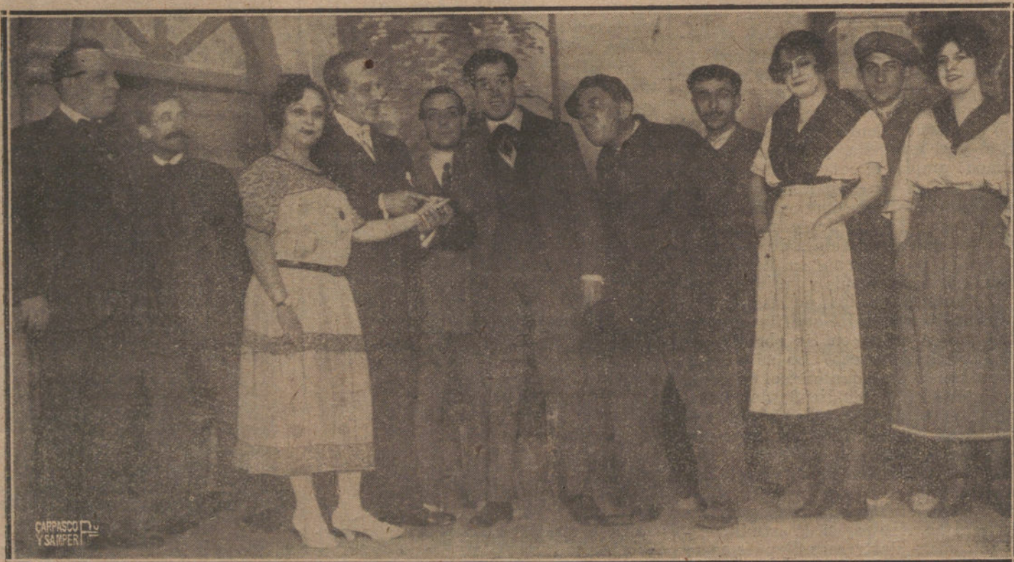
UNA ESCENA DE LA OBRA «CUPIDO, BOLCHEVIQUE», ESTRENADA AYER EN EL TEATRO DE LA INFANTA ISABEL.

Después de Loreto se distinguieron la Melchor y la Leal; la primera nos gustó quizá más que nunca, haciendo una ingenua tobillerita, y la segunda, que va a ser una cómica de primer orden, y ya lo es casi casi, dió vida a un «pichón de chuñillo», detallándolo a la perfección.