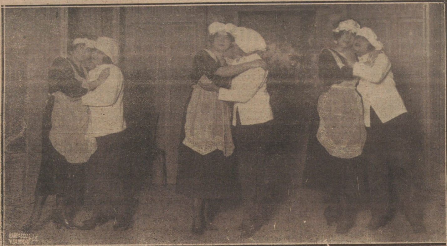
UNA ESCENA DE LA OBRA «YO QUIERO UN MARIDO INFIEL», OBRA ESTRENADA ANOCHES EN EL TEATRO COMICO.

«Yo quiero un marido infiel» es un juguete cómico con arreglo a los antiguos procedimientos del género. Araceli quiere cerciorarse de la fidelidad de su novio durante los ocho años que ella estuvo en New-York y Mauricio en Madrid. Para que él confiese sus calaveradas exige que su marido tenga un pasado borrascoso, emula del de don Juan. Pero Mauricio es un infeliz, absolutamente fiel, y tiene que aceptar el historial accidentado de un amigo juerguista y recoger la herencia de sus hazañas. Sobre esta base ha hilvanado el señor Prada tres actos, lle-