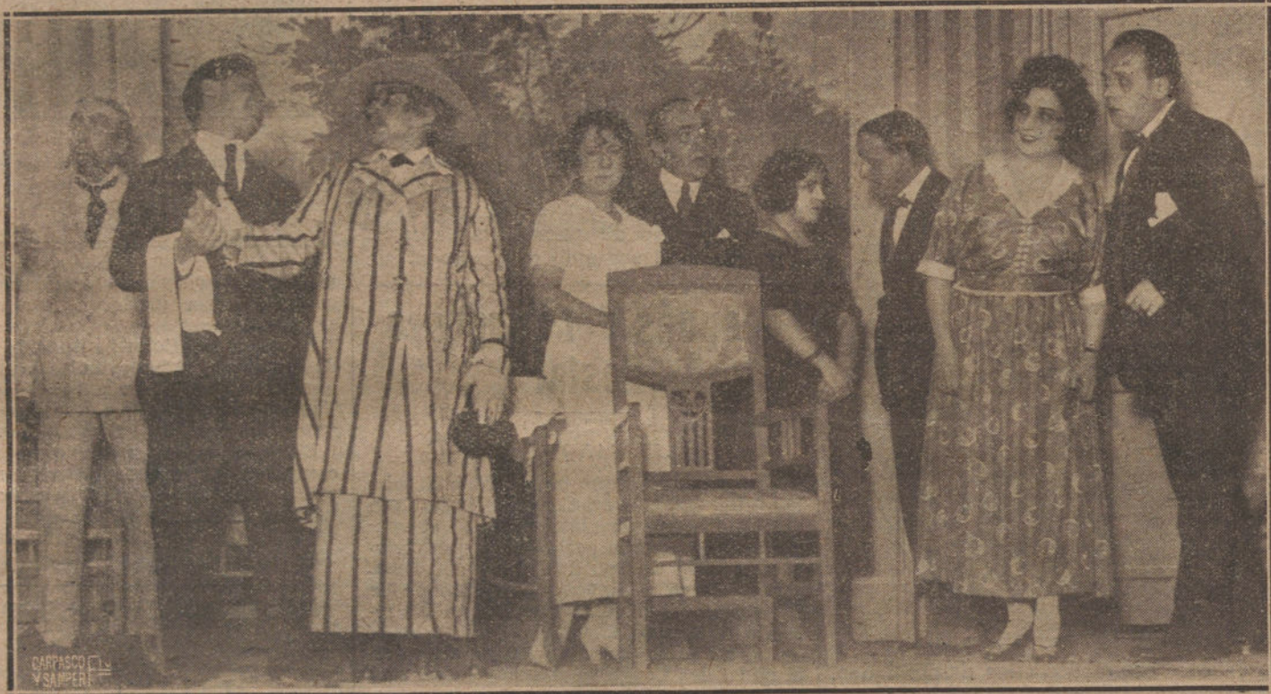
UNA ESCENA DE «YO QUIERO UN MARIDO INFIEL», COMEDIA ESTRENADA ANOCHES EN EL COLISEO IMPERIAL.

nos de diálogos muy graciosos, que a veces tienen visos de vodevil, otras de astracanada, y las más, de juguete cómico.