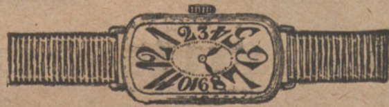
Núm. 1.—Áncora de forma, oro de ley 18 quilates con pulsera de moiré.

GARANTIA EFECTIVA DE BUENA MARCHA POR CINCO AÑOS