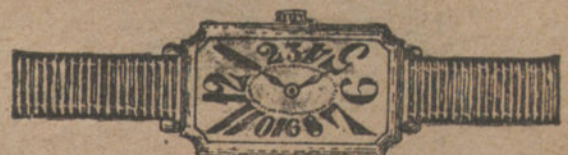
Núm. 2.—Rectangular, áncora 16 rubíes, oro de ley 18 quilates con pulsera de moiré.