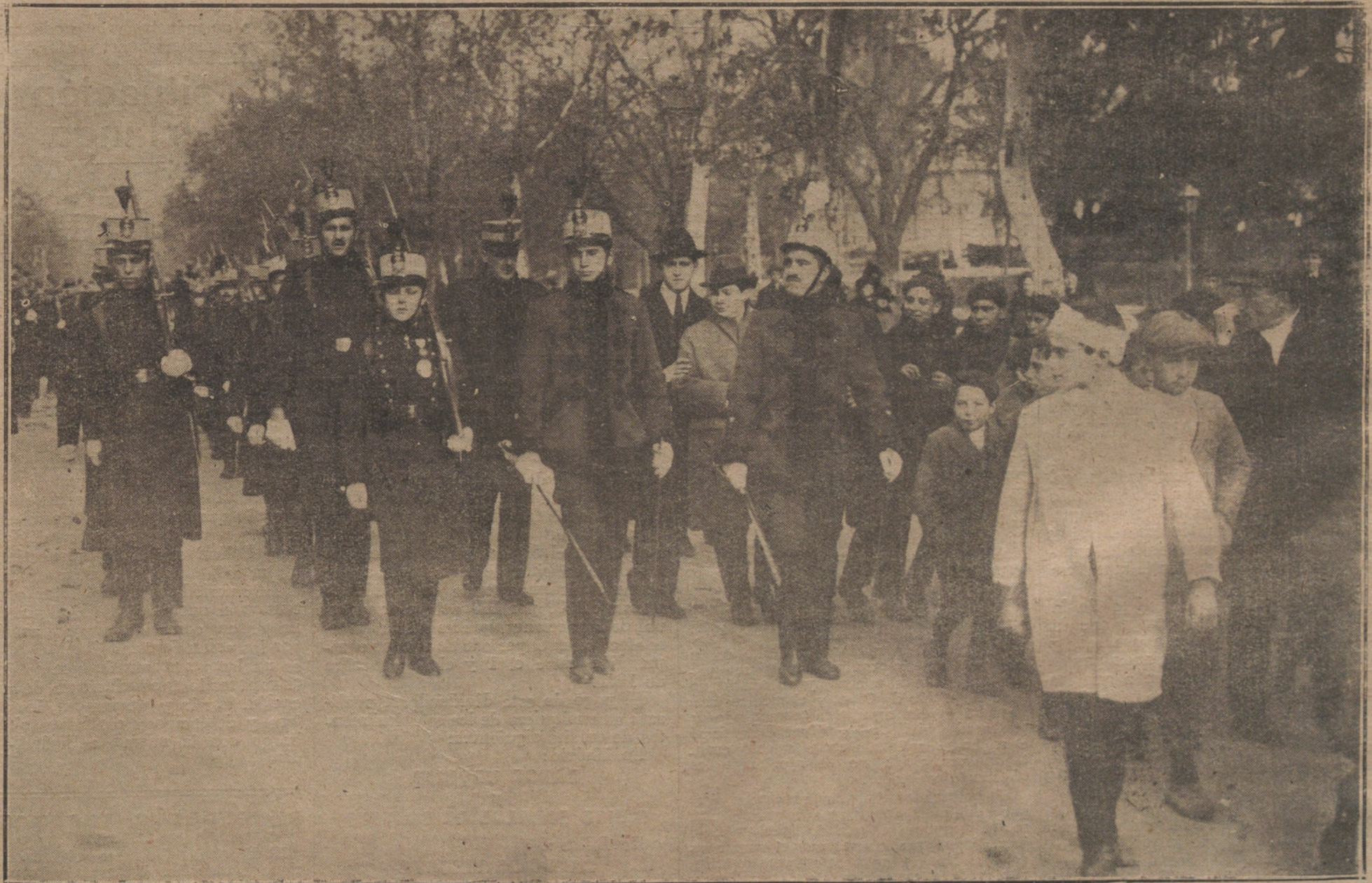
SU ALTEZA EL PRINCIPE DE ASTURIAS AL FRENTE DEL REGIMIENTO A QUE PERTENECE, DESFILANDO POR LAS CALLES DE MADRID CON MOTIVO DE LA FIESTA DE LA PATRONA DEL ARMA DE INFANTERIA.

EL ANUNCIO EN «LA TRIBUNA» ES EL MAS PRODUCTIVO, POR SU AMPLIA INFORMACION Y EXTENSA TIRADA.