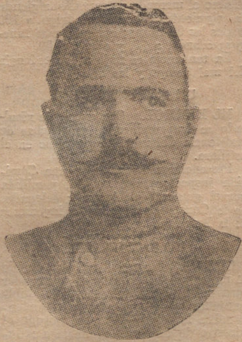
EL INSIGNE GENERAL OBREGON, QUE EL DIA 1 DEL CORRIENTE MES TOMO POSESION DE LA PRESIDENCIA DE LA REPUBLICA MEJICANA

Pertrechado tras la coraza de la más correcta diplomacia, se negó en absoluto a hacer declaraciones políticas, esculdándose en que su misión es solo de alto comercio; pero veteranos en el arte de «confesar» a personalidades políticas, pudimos colegir que siente un respeto profundo por el general Obregón, de quien llega a decir que «si las águilas pensasen y sintiesen como los hombres, volarían en torno del insigni-