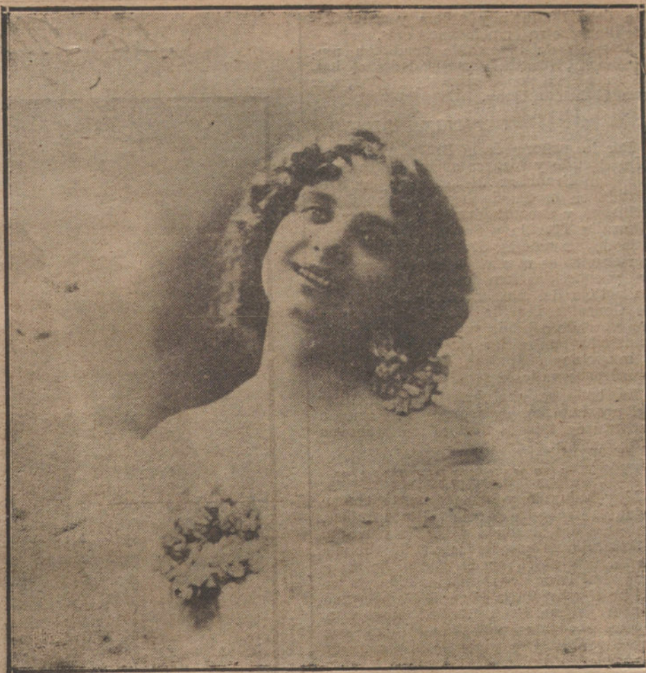
ROSINA STORCHIO, LA INSUPERABLE INTERPRETE DE «MADAME BUTERFLY» Y «MANON»

No creo necesario, ni siquiera oportuno, entrar ahora a discutir el sistema lógico del leitmotiv, sus consecuencias y derivaciones y otras cosas ya de tiempo tan manidas, y que todos cuantos nos interesamos algo en el arte tenemos a nuestro alrededor en innumerales (excesivos) libros escritos sobre ello.