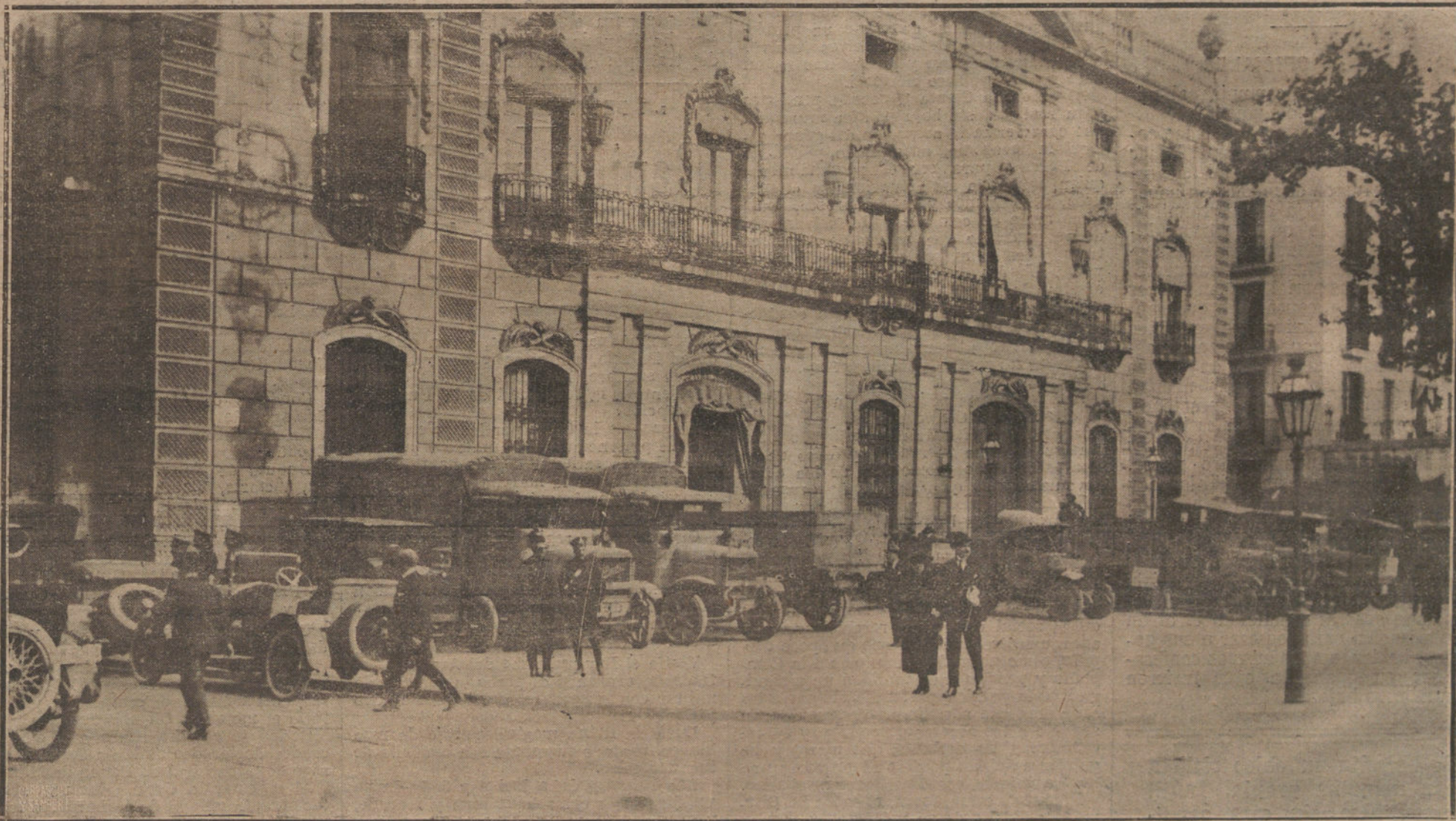
EL CONATO DE HUELGA GENERAL EN BARCELONA.—AUTOCAMIONES REQUISADOS POR LA AUTORIDAD, ESPERANDO ORDENES A LA PUERTA DEL GOBIERNO CIVIL.