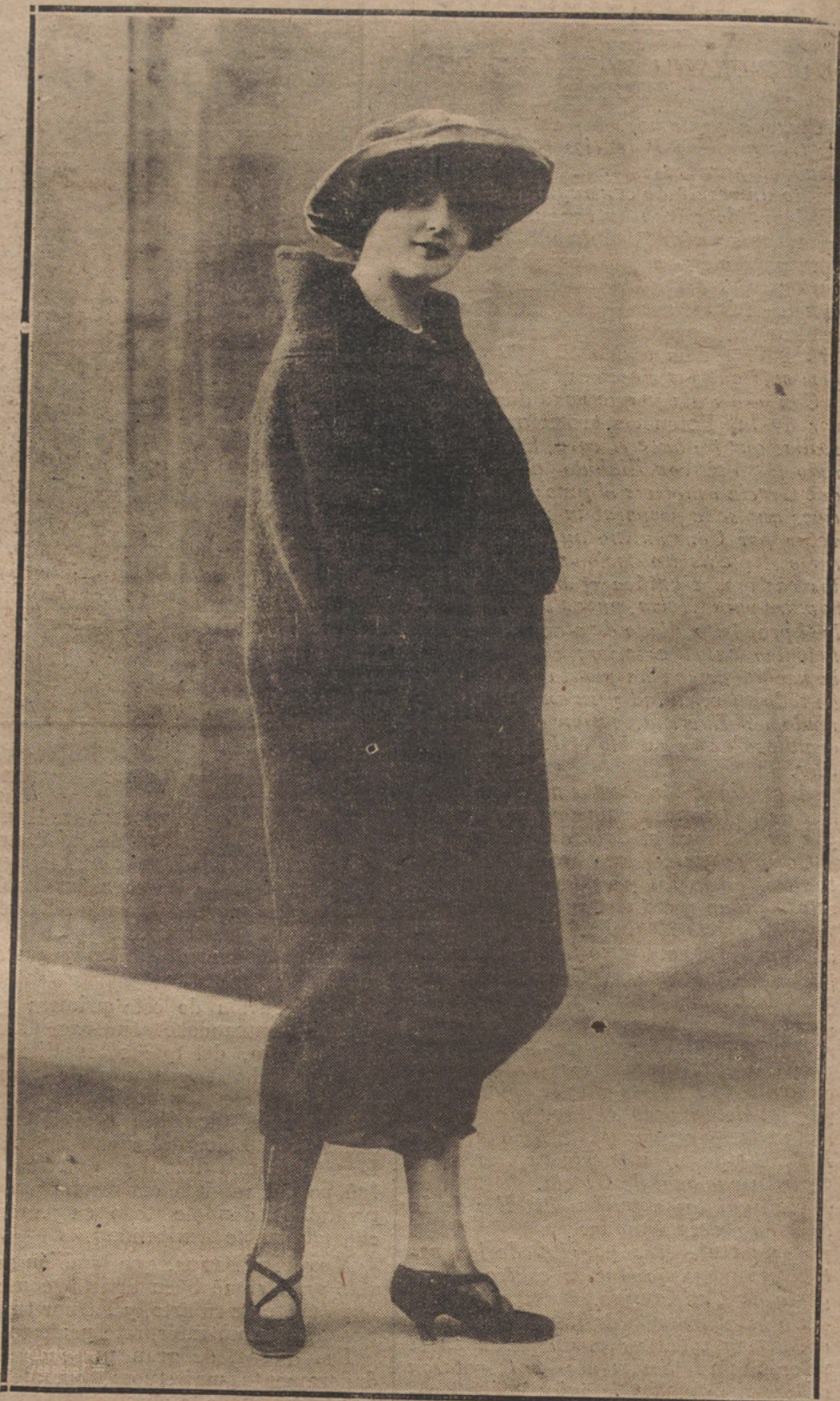
ELEGANTE CAPA ABRIGO, DE PAÑO RURO, FORMA SENCILLISIMA, MODELO DE F. CASA LYADE

ALICANTE. Han sido detenidos por la Policía muchos individuos por coaccionar y repartir hojas clandestinas, en las que se excita a la huelga.