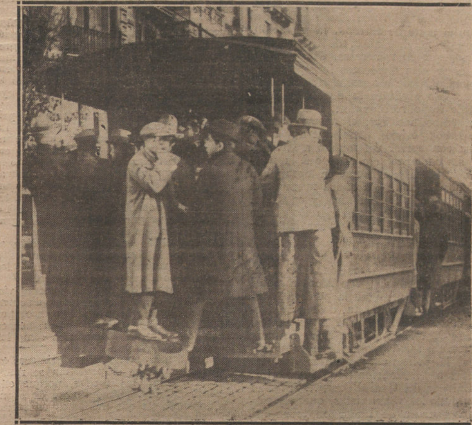
EL CONATO DE HUELGA GENERAL EN BARCELONA.—EL FERROCARRIL ELECTRICO DE LA CALLE DE BALMES ABARROTADO DE PUBLICO, POR SER EL UNICO MEDIO DE LOCOMOCION QUE HABIA ESTOS DIAS EN BARCELONA.

Nunca el dilema shakespeariano mostró, como en esta ocasión, la hora suprema de la vida o de la muerte: ser, en humana confraternidad, o no ser, en inhumana exacerbación del odio... En esta hora, la generosidad no es más que instinto de conservación; por eso Inglaterra nos aparece generosa... En torno de ella, y en igual afán, se agruparon la mayoría de las naciones repre-