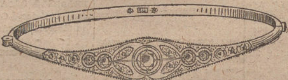
Núm. 5.—Cinco brillantes y diamantes.