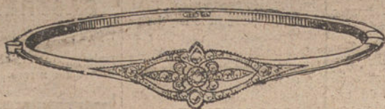
Núm. 1.—Un brillante y diamantes.

BRILLANTES DE PRIMERA CALIDAD :: DIAMANTES ROSAS DE HOLANDA MONTURAS DE PLATINO FINO Y ORO DE LEY 18 QUILATOS CONTRASTADO