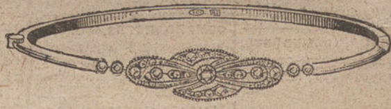
Núm. 2.—Tres brillantes y diamantes.