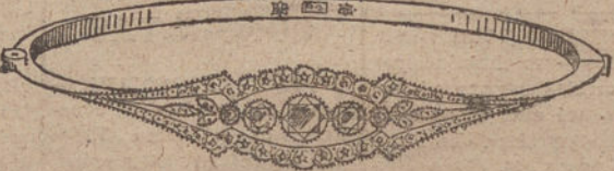
Núm. 6.—Cinco brillantes y diamantes.