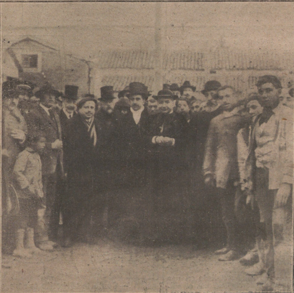
BENDICIÓN E INAUGURACIÓN DE LA BARRIADA DE CASAS BARATAS, CONSTRUÍDA POR INICIATIVA DE LA MARQUESA DE LA COQUILLA.