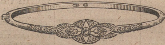
Núm. 3.—Tres brillantes y diamantes.