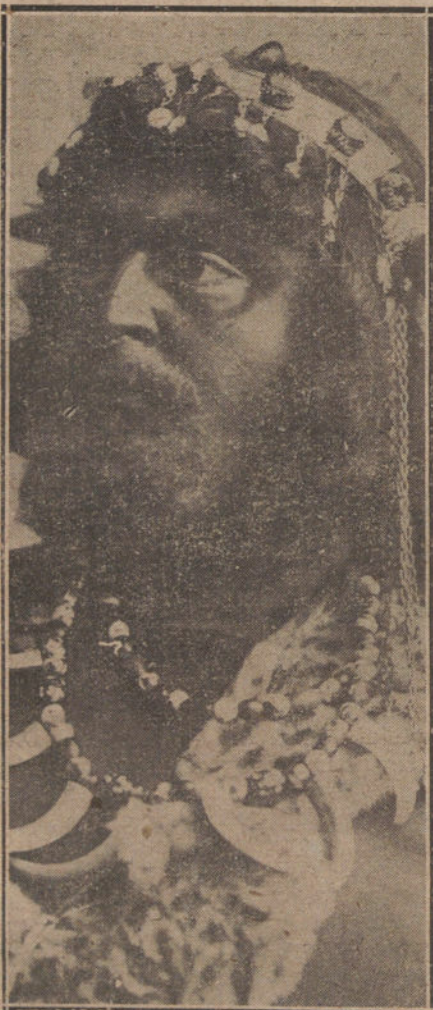
CESAR FORMICHI, NOTABLE BARITONO, QUE ACTUA EN EL REAL

—¡Sinvergüenza! ¡Habrás visto! —Eso de la vergüenza se lo dirá usted a su abuela por línea de varón, no es eso? —No, señor; se lo digo a usted.