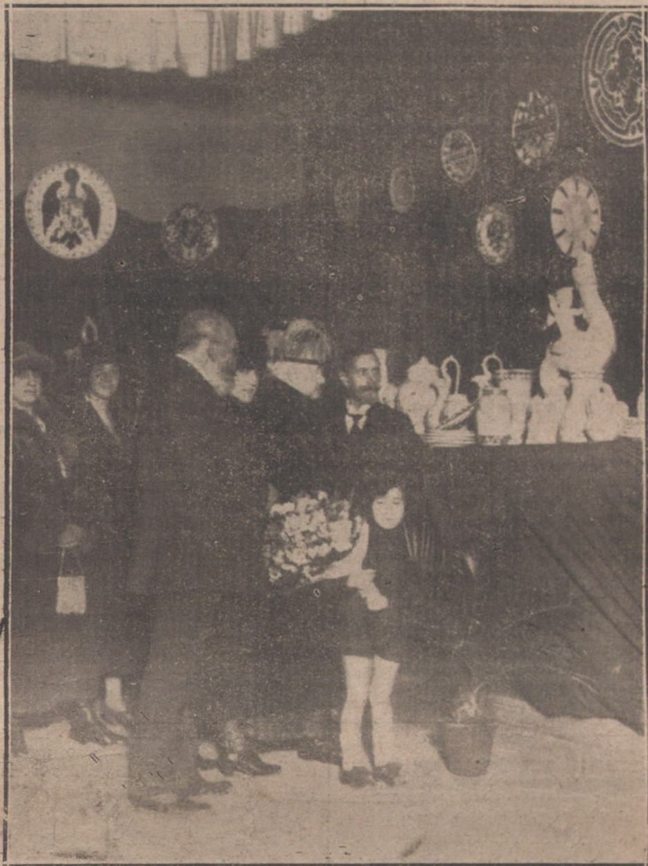
VISITA DE SU ALTEZA LA INFANTA DOÑA ISABEL A LA EXPOSICIÓN DE CERAMICA DE SE BASTIAN AGUADO, QUE SE CELEBRA EN EL SALON PERMANENTE DEL CIRCULO DE BELLAS ARTES.

Desde el Ayuntamiento se dirigió la representación obrera a la Casa del Pueblo, donde estaba reunida la Asamblea general de obreros panaderos.