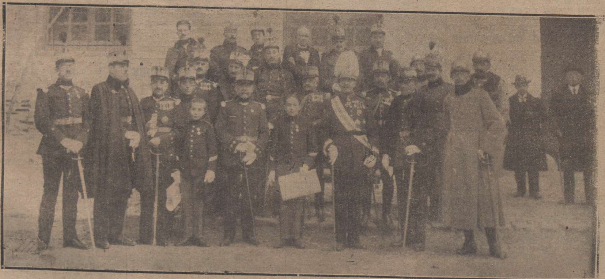
REPARTO DE LOS DOS PREMIOS ANUALES QUE SE CONCEDEN A LOS NIÑOS DEL COLEGIO DE HUERFANOS DE LA GUERRA, QUE MEJOR CONDUCTA HAN OBSERVADO DURANTE EL AÑO. AL ACTO, CELEBRADO CON TODA SOLEMNIDAD EN GUADALAJARA, ASISTIERON EL GOBERNADOR MILITAR DE LA PLAZA Y LOS JEFES Y OFICIALES DEL COLEGIO.