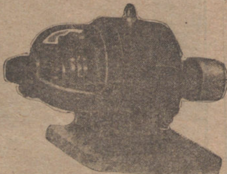
Motores para corriente trifásica.

Representante de la "Electricidad", S. A. Sabadell