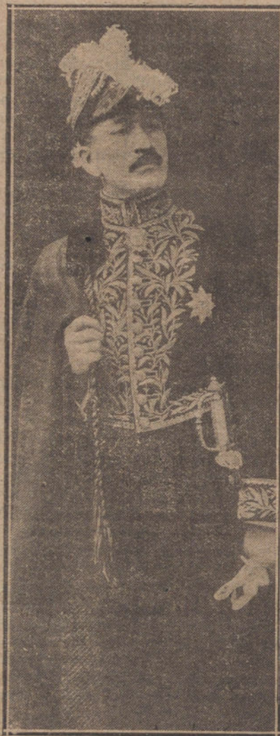
DON J. A. MARTINEZ MENDEZ NUEVO MINISTRO PLENIPOTENCIARIO DE VENEZUELA EN ESPAÑA

Verificóse la recepción en la antecámara, donde se hallaban acompañando al Rey, además del ministro de Estado, el mayordomo mayor de Palacio, marqués de la Torrejilla; comandante general de Alabarderos, Milán del Bosch; Grande de España de servicio, don Juan Fernando