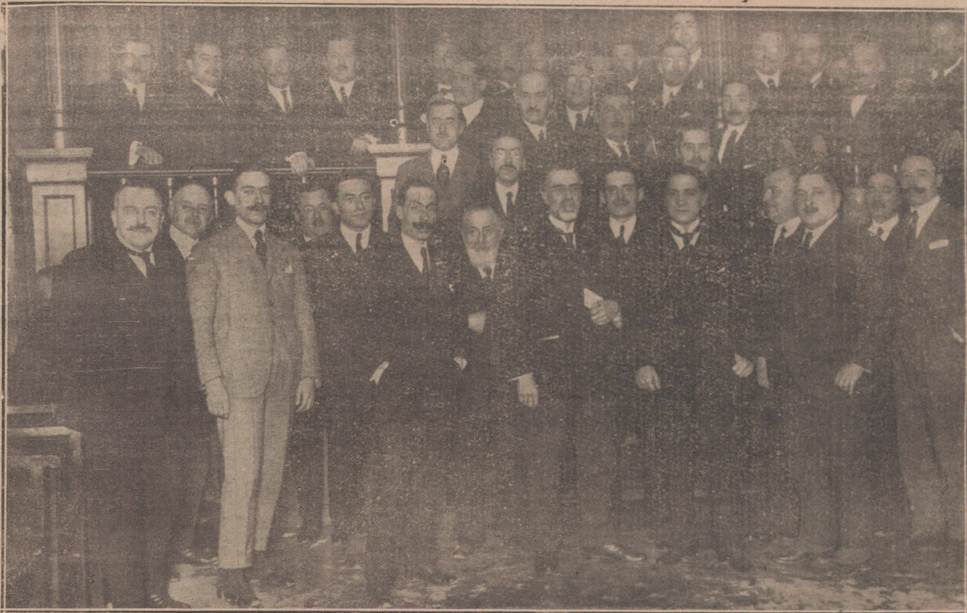
GRUPO DE REPRESENTANTES DE PERIÓDICOS QUE ASISTIERON A LA IMPORTANTE ASAMBLEA VERIFICADA AYER EN LA REDACCION DE «LA TRIBUNA» PARA ESTUDIAR LA SITUACION ACTUAL DE LA PRENSA.