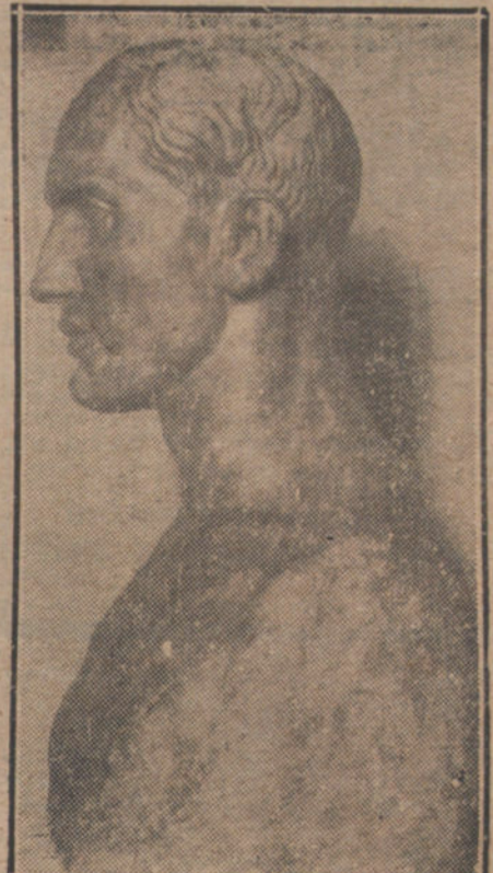
EL BUSTO DE JULIO ANTONIO

Tal vez por este medio lo que haya de ser juzgado solamente por funcionarios y con carácter administrativo en depuración de responsabilidades, motivará la intervención del Juzgado de guardia para castigar debidamente al que resulte responsable.