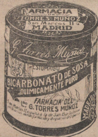
LATAS ECONOMICAS DE 1 1/2 KILOS