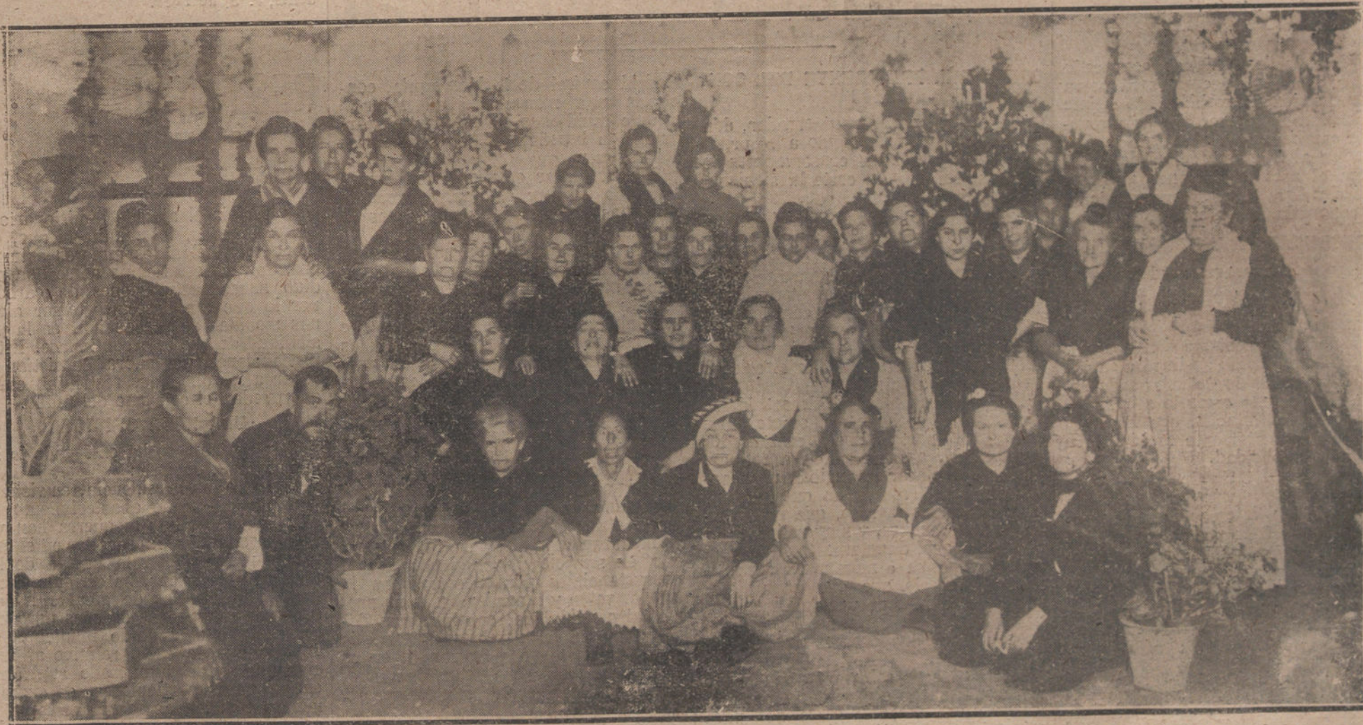
LAS CIGARRERAS SEVILLANAS.—GRUPO DE CIGARRERAS DE LA FABRICA DE TABACOS DE SEVILLA, ORGANIZADORAS DE LAS FIESTAS QUE SE ESTAN CELEBRANDO EN LA ACTUALIDAD EN HONOR DE SU PATRONA.

Cansado de ensayos, de combinaciones y de interinidades, el país quiere asistir a una labor legislativa seria. Po-