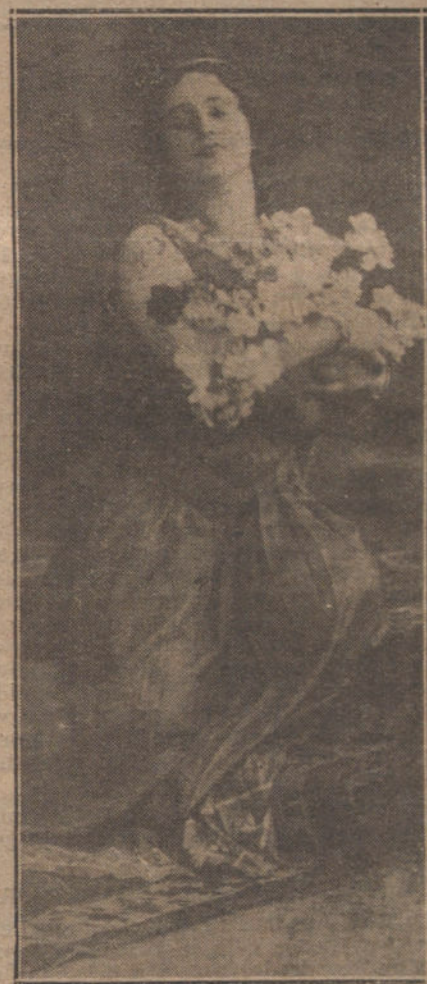
LA DISTINGUIDA SOPRANO GERTRUDIS KAPEL, QUE ACTUA EN EL TEATRO REAL