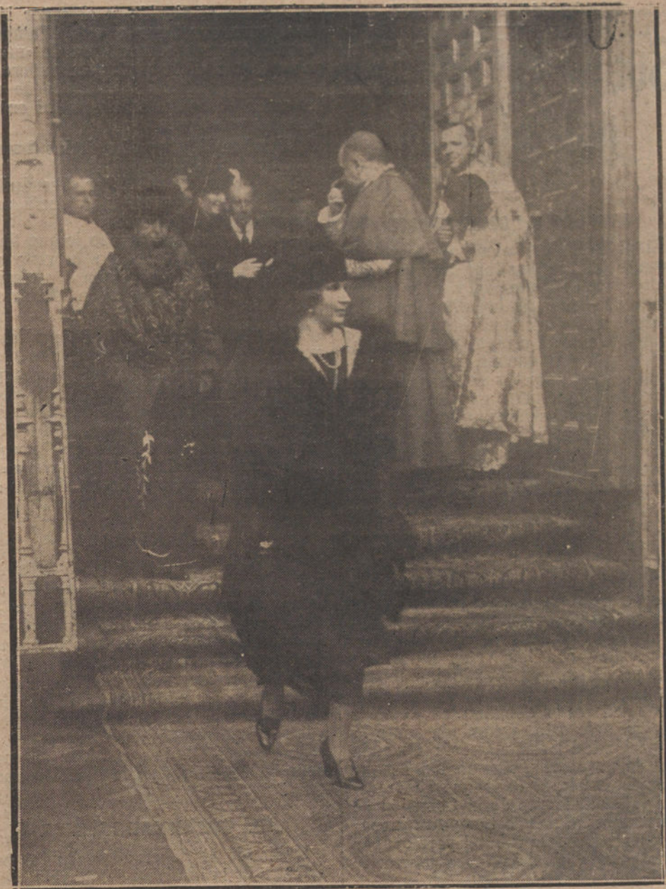
SUS MAJESTADES LAS REINAS DONA VICTORIA Y DONA CRISTINA AL SALIR ESTA MAÑANA DE LA IGLESIA DE LAS CALATRAVAS.