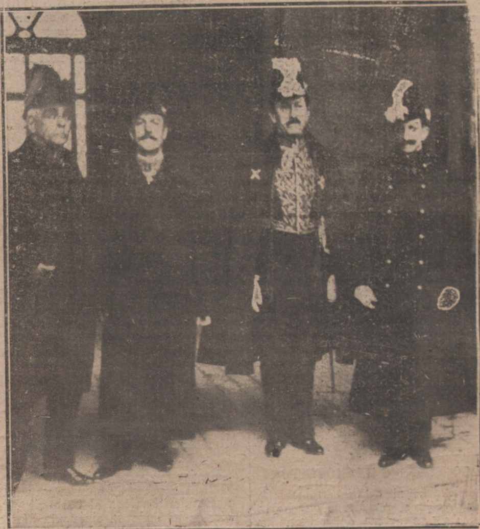
EL NUEVO REPRESENTANTE DIPLOMÁTICO DE VENEZUELA, D. J. A. MARTÍNEZ MENDEZ, AL SALIR DE PALACIO, DESPUÉS DE PRESENTAR LAS CARTAS CREDENCIALES A SU MAJESTAD EL REY.

Al futuro Parlamento se le prepara una obra importante. Se empieza a tener confianza en que esta obra no la malogre las divisiones y los espectácu-