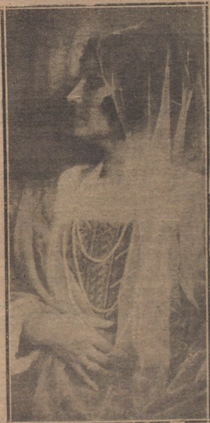
CARLOTA DAHMEN, CELEBRADA SOPRANO DEL TEATRO REAL

Por eso nos hemos creído en el caso de amparar su protesta, y estamos dispuestos a seguir prestando a este asunto la atención que merece.