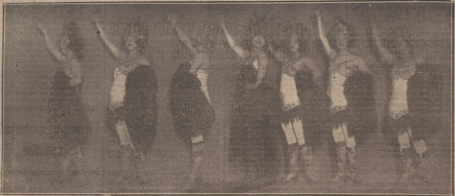
ESCENA TITULADA «LA ÚLTIMA MODA» DE LA OPERETA «EL PRÍNCIPE CARNAVAL», QUE SE ESTRENA MAÑANA EN EL TEATRO DE LA REINA VICTORIA.