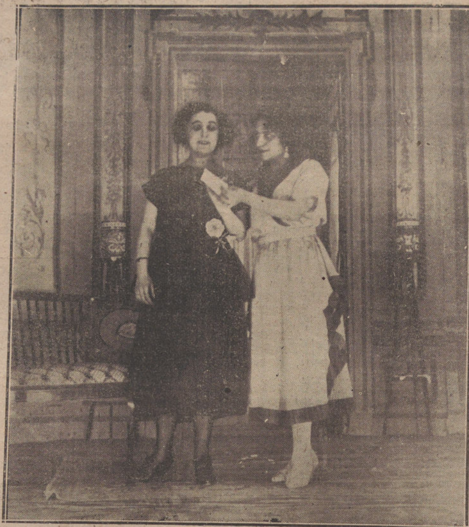
UNA ESCENA DE «LA REINA DE LA OPERETA», OBRA ESTREADA ESTA TARDE EN EL TEATRO DE LARA.

Continúa enferma en su residencia de Avila la condesa viuda de Canales de Chozas. Se encuentra a su lado su hijo, el marqués de Piedras Albas, y su nieto, la