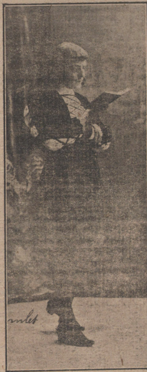
EL NOTABLE ACTOR RICARDO CALVO, QUE ESTA NOCHE CELEBRA SU BENEFICIO EN EL ESPAÑOL

Los dos hermanos estuvieron trabajando en las minas de Asturias, donde prom-