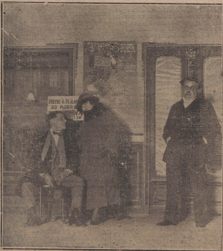
Y SEPULVEDA EN LA OBRA «ASI PREDICA LA SEÑORA GAMEZ Y LOS SEÑORES AGUILAR TRÓ DE LA INFANTA ISABEL» BA. DIEGO, ESTRENADA AYER EN EL TEA

Y como la Prensa, en su mayoría, además del aspecto industrial que tenga o quiera atribuirsele, tiene otro, innegable, de positiva idealidad e influencia en la vida de la nación, al país en general, y en primer término a los gobernantes, les interesa que no desaparezcan los periódicos que son órganos de la opinión para ser sustituidos por la Prensa que puedan editar unos cuantos políticos desaprensivos o financieros ambiciosos que busquen