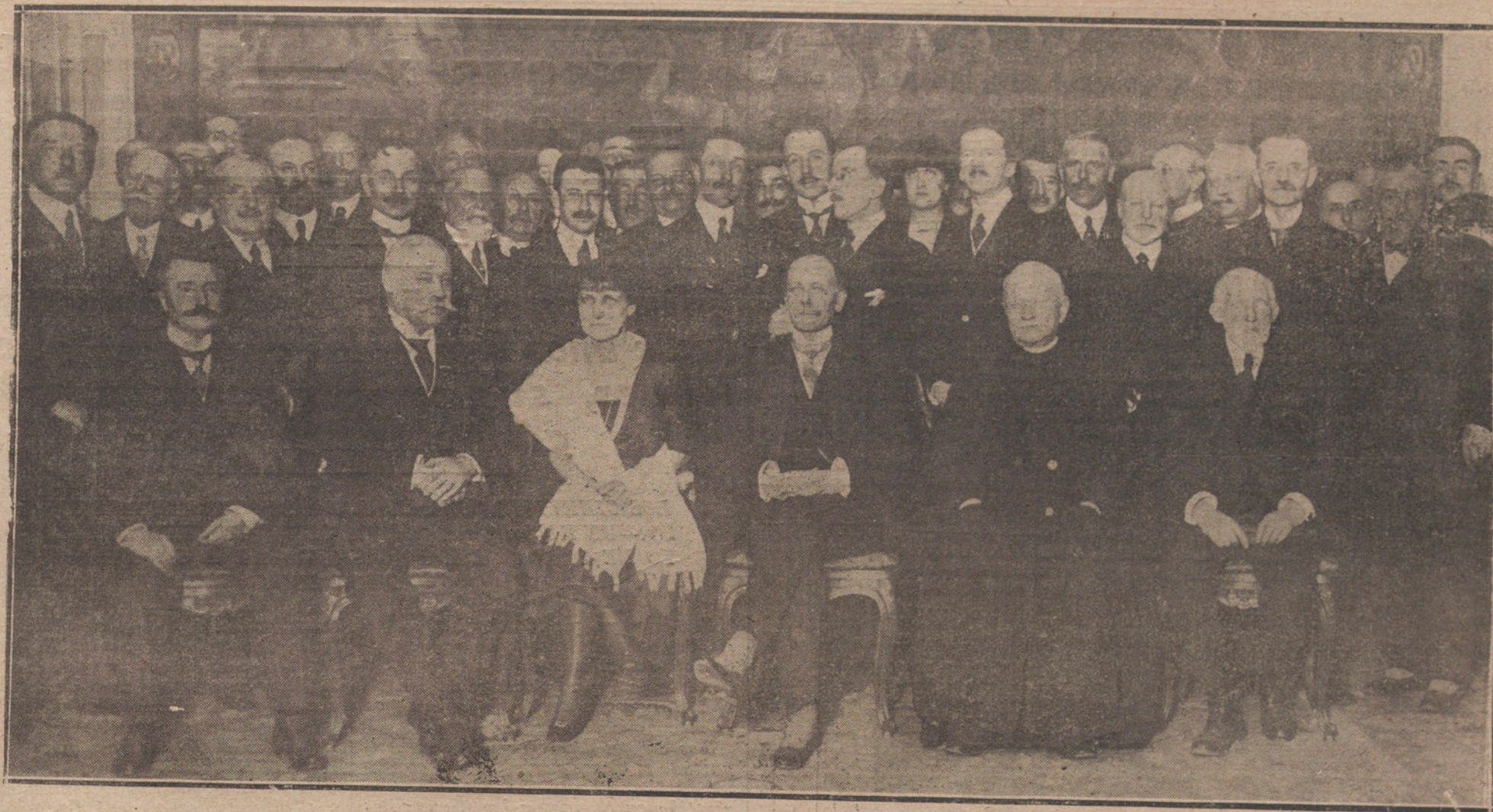
RECEPCIÓN DEL EMBAJADOR DE FRANCIA, CONDE DE SAINT-AULAIRE, CON MOTIVO DE LA DESPEDIDA DEL EMBAJADOR, CONDE DE SAINT-AULAIRE.