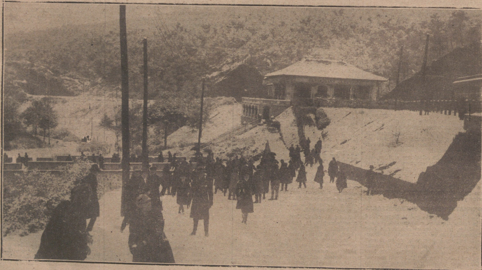
UNA GRAN NEVADA EN BARCELONA.—ASPECTO DE LAS PLANAS DE VALLVIDRERA, POCO DESPUES DE LA NEVADA.

Sin embargo, aunque la fecha exacta del viaje no ha sido fijada todavía, lo será muy en breve.—Radio.