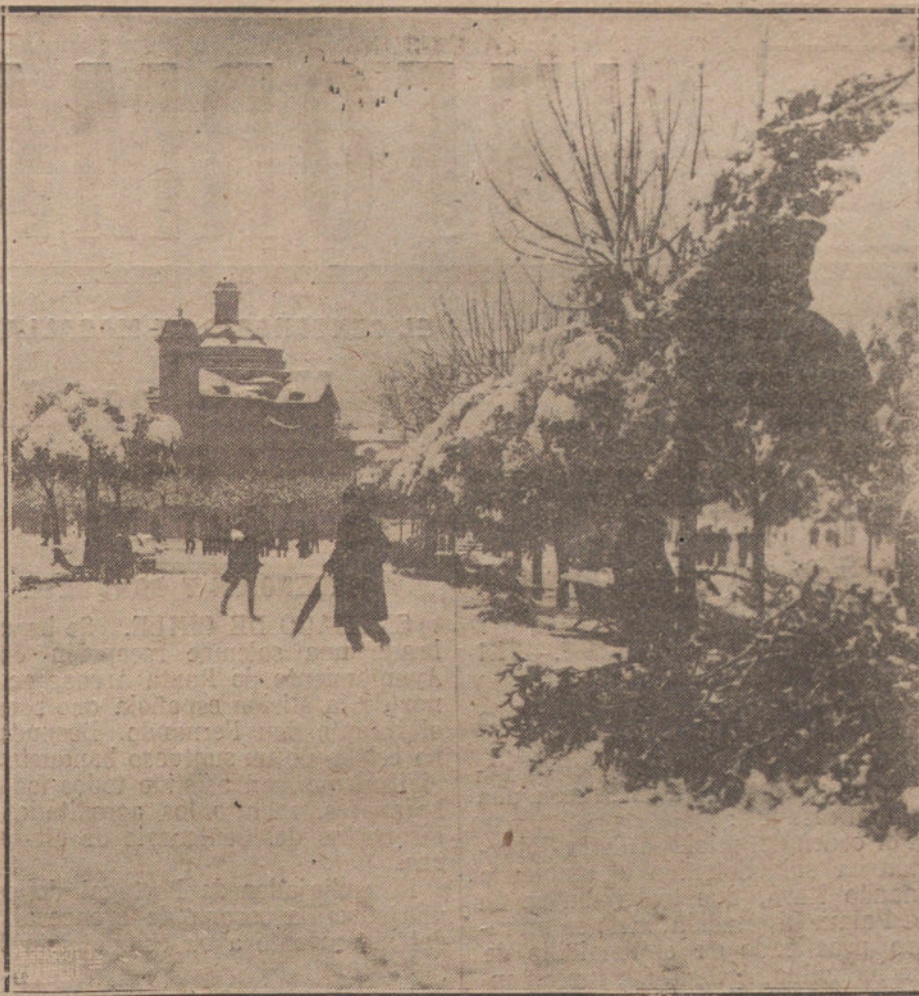
EL TEMPORAL DE NIEVES EN BARCELONA.—UN ASPECTO DEL PARQUE.

tes acusadas de delitos de hurto o de robo, se me llevan los mismísimos demonios; porque en la generalidad de los casos, esas gentes adolecen del gravísimo defecto de la inconsecuencia; roban por robar; hurtan por hurtar. Así, por ejemplo, las urracas domésticas llevan infiltrado en la sangre el propósito de hacer daño; sus afiladas uñas recogen cuanto a su paso encuentran, y no conformes con esto, adulteran los alimentos y, en una palabra, tiran al codillo a los años; ese gremio, sin reglamentación alguna, el más feliz de la creación, cuenta con todas las ablatías; «los enemigos pagados» no merecen compasión.