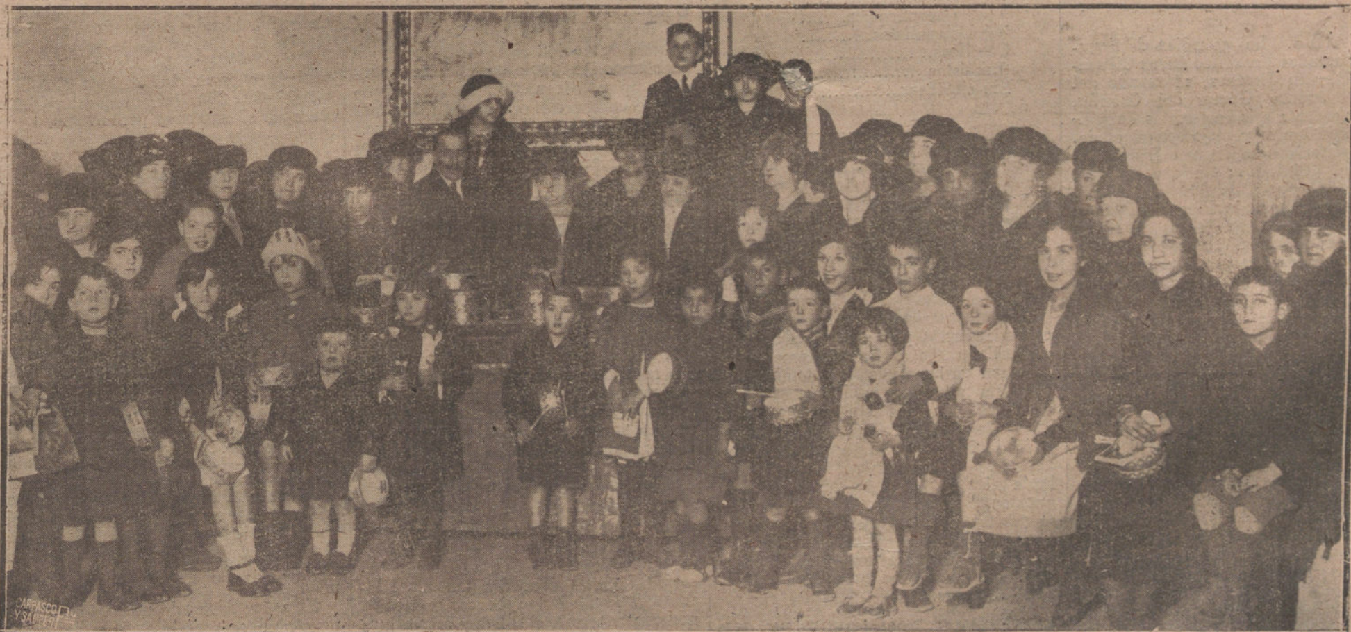
PARTO DE PREMIOS A LOS NIÑOS QUE PROTEGE EL COMITE FEMENINO DE HIGIENE POPULAR. ACTO VERIFICADO AYER.

gurarse que el señor Dato, además de la ayuda de los grupos derechistas, contará con apoyos tan estimables como el de los demócratas y los liberales agrarios, que han traído este año una lucida representación. Claro es que estos apoyos serán condicionado-