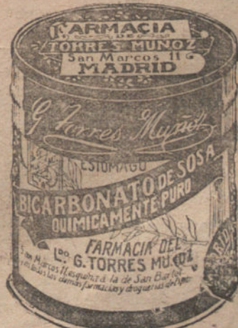
LATAS ECONOMICAS DE 12 KILOS

Delegación de la Compañía: Gran Vía, 16, Madrid