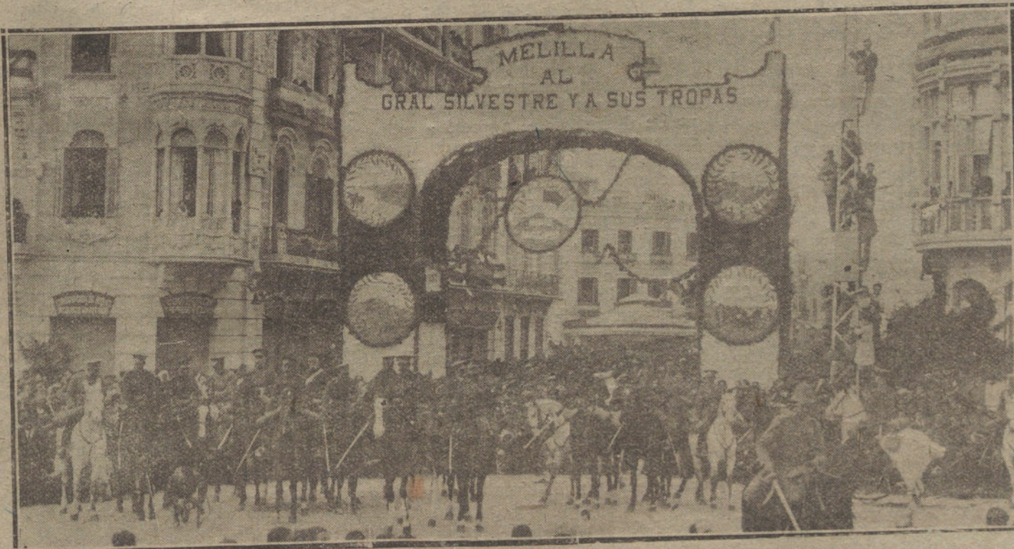
LOS GENERALES SILVESTRE Y BARON DE CASA D'VALILLO, CON SU ESTADO MAYOR, DURANTE LA MISA DE CAMPAÑA CELEBRADA EN LA PLAZA DE ESPAÑA CON MOTIVO DEL HOMENAJE TRIBUTADO POR EL PUEBLO DE MELILLA A LOS HEROES DEL MONTE MAURO.

—Idem al auditor de división don Luis Higuera y Bellido, marqués de Arlanza, en el cargo de auditor de la Capitania general de la tercera región.