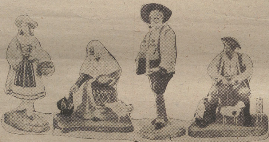
LA PASTORA DE LA PRESA, LA TIA GILA, BATO Y EL ZAGAL DE LAS OVEJAS

Siempre me parece que esas gachas deben estar muy buenas con un aliño que se les ha olvidado ya fabricar a las cocineras. Imitar la felicidad de aquellos pastores en el campo, encontrar noche como aquella entre las noches frías,