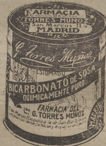
LATAS ECONÓMICAS DE 1/2 KILOS