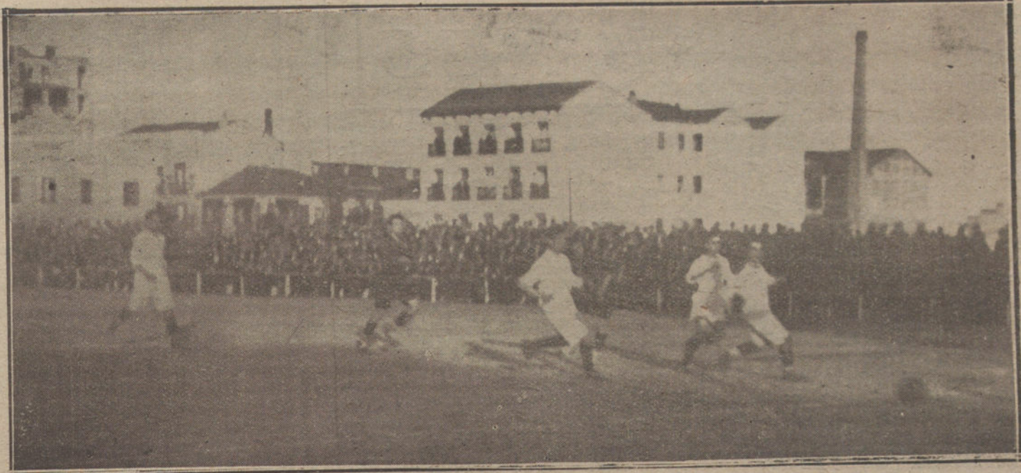
UN MOMENTO INTERESANTE DEL PARTIDO DE «FOOT-BALL» JUGADO AYER ENTRE LOS EQUIPOS RACING, DE SANTANDER, Y RACING, DE MADRID.

Pocas veces se tiene la suerte de contemplar ante el altar nupcial una novia tan