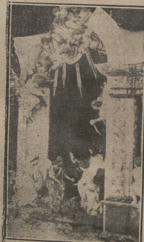
GRUPO DEL PORTAL DEL NACIMIENTO. DE SALZILLO

NO SE DEVUELVEN LOS ORIGINALES GRAFICOS NADA MAS QUE EN EL CASO EN QUE PREVIAMENTE HAYAN SIDO ADQUIRIDOS CON ESA CONDICION.