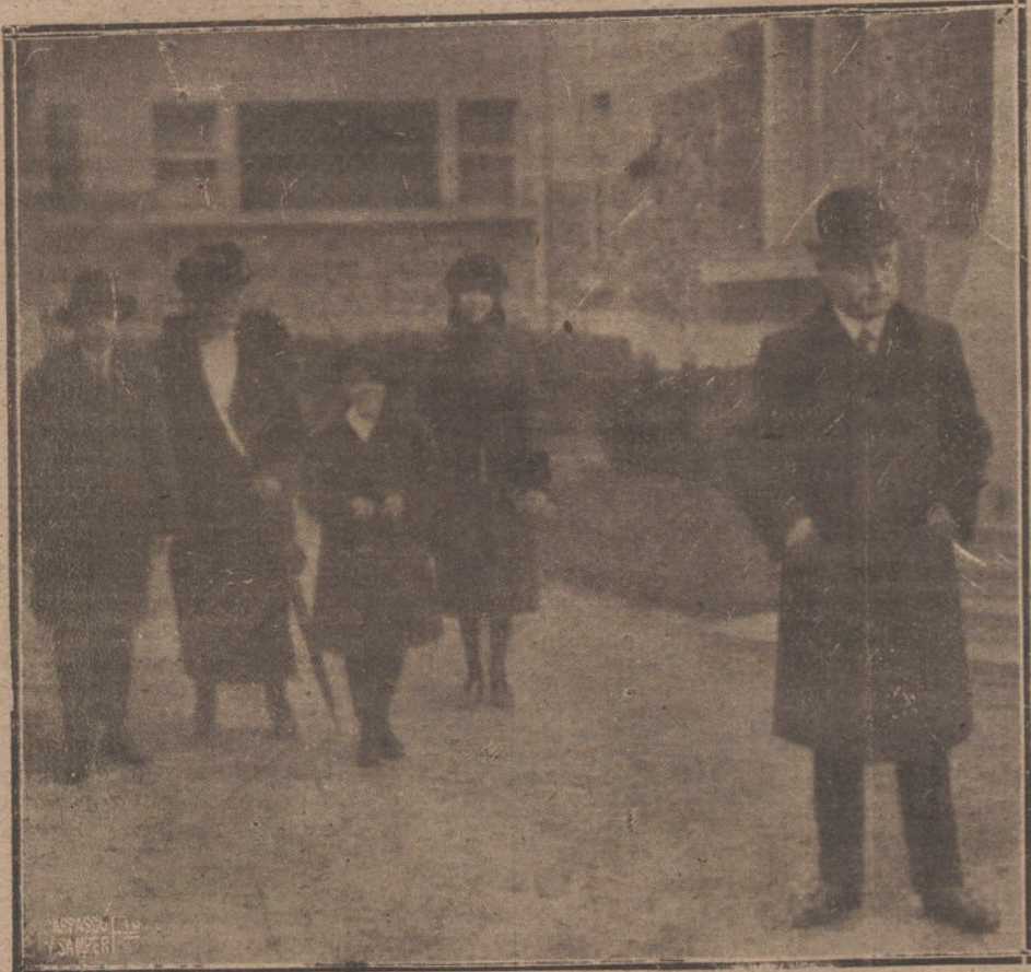
LA ENFERMEDAD DE DESOHANEL—EL EX PRESIDENTE DE LA REPUBLICA FRANCESA, PASEANDO CON SU FAMILIA POR LOS JARDINES DE LA VILLA QUE HABITARA HASTA RESTABLECERSE TOTALMENTE.

alarma de los cuantacorrentistas y facilitando la garantía de las fortunas personales, como ya se hizo en otras provincias—recuérdese el reciente caso de Bilbao, cuando la difícil situación de la «Unión Minera»—, se habría podido conjurar el peligro y evitar el espectáculo que ayer ha dado el fuerte Banco de Barcelona.