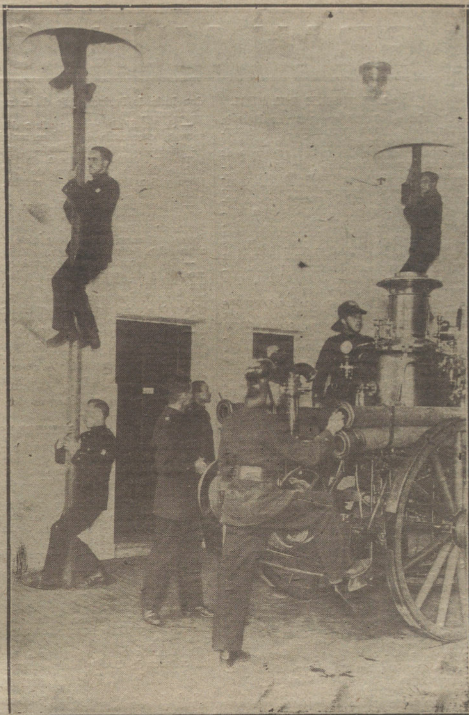
LA MODERNA INSTALACIÓN DEL SERVICIO DE INCENDIOS EN NEUKOLIN (ALEMANIA). VISTA DEL DEPARTAMENTO DE AVISOS URGENTES, EN EL MOMENTO DE RECIBIRSE UNA ORDEN.