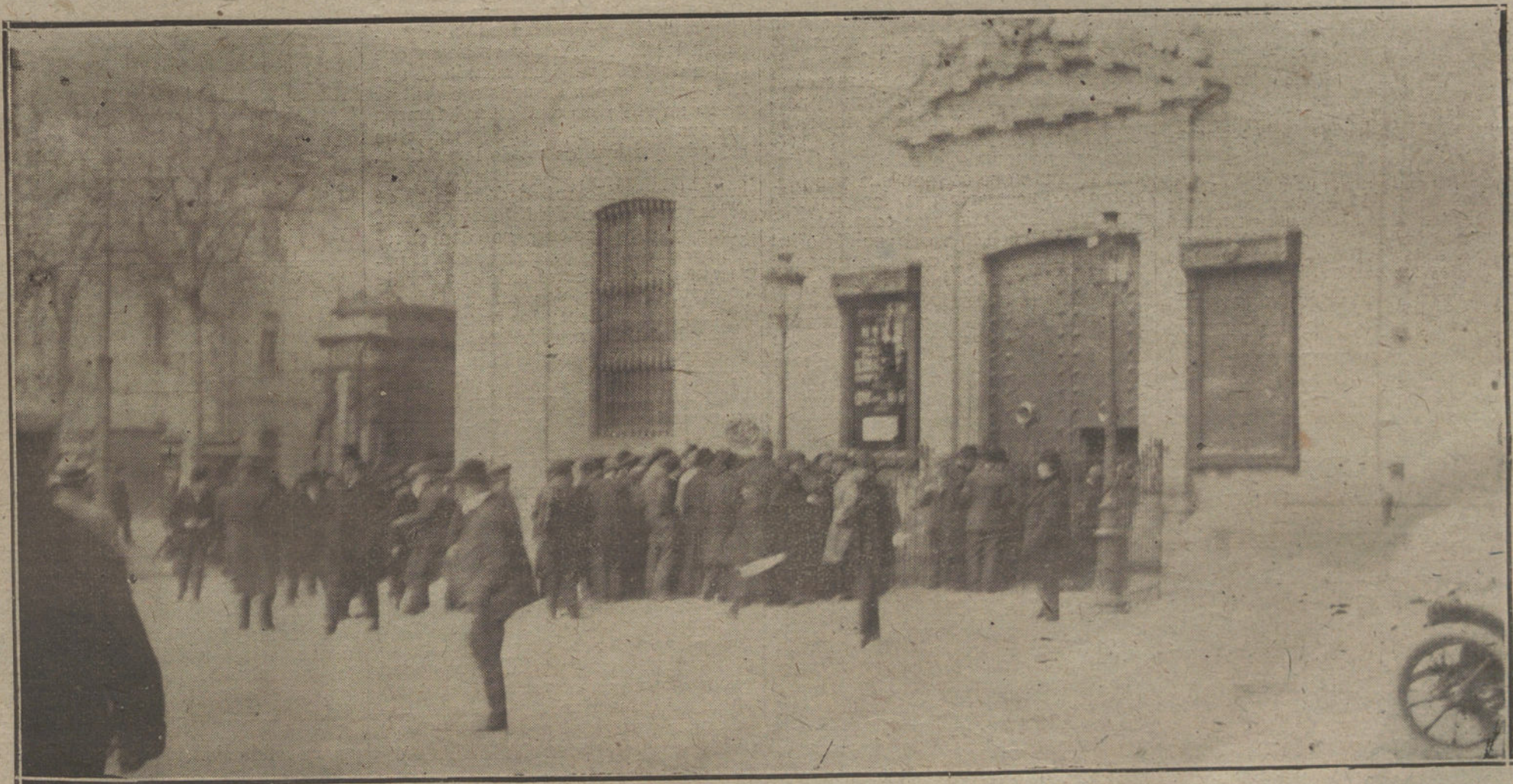
LA CRISIS FINANCIERA DE BARCELONA.—ASPECTO QUE OFRECÍAN AYER TARDE LOS ALREDEDORES DEL BANCO DE BARCELONA, AL FIJARSE EL CARTEL ANUNCIANDO LA SUSPENSIÓN DE PAGOS, (FOT. BADOSA.)

RIO DE JANEIRO. El Gobierno estudia la valorización del caucho.—A. A.