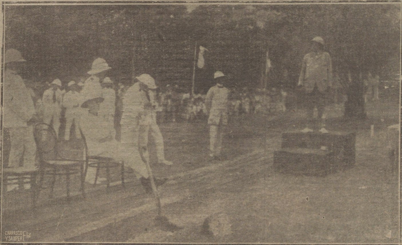
1 VIAJE DE CLEMENCEAU A SINGAPOUR.—EL EX PRESIDENTE DEL CONSEJO DE MINISTROS DE FRANCIA PRONUNCIANDO UN DISCURSO EN STRAITS SETTLEMENTS, DESPUES DE INAUGURAR LAS OBRAS DE UNA AVENIDA QUE LLEVARA SU NOMBRE.

Y como su redactor médico pide al vecindario le facilite datos para proseguir su campaña iniciada, de alto interés nacional, por aquello del «salus populi», nosotros, que formamos parte del ese vecindario del que solicita datos el redactor médico del amado colega, como sujeto paciente de mismo, se los vamos a dar, en cantidad abrumadora, que aflige el ánimo y que produce la desesperación de amarguras infinitas de los que, por torpeza, incuria e incapacidad de nuestros directores de esta nación, tan brutalmente desquiciada, hayamos te-