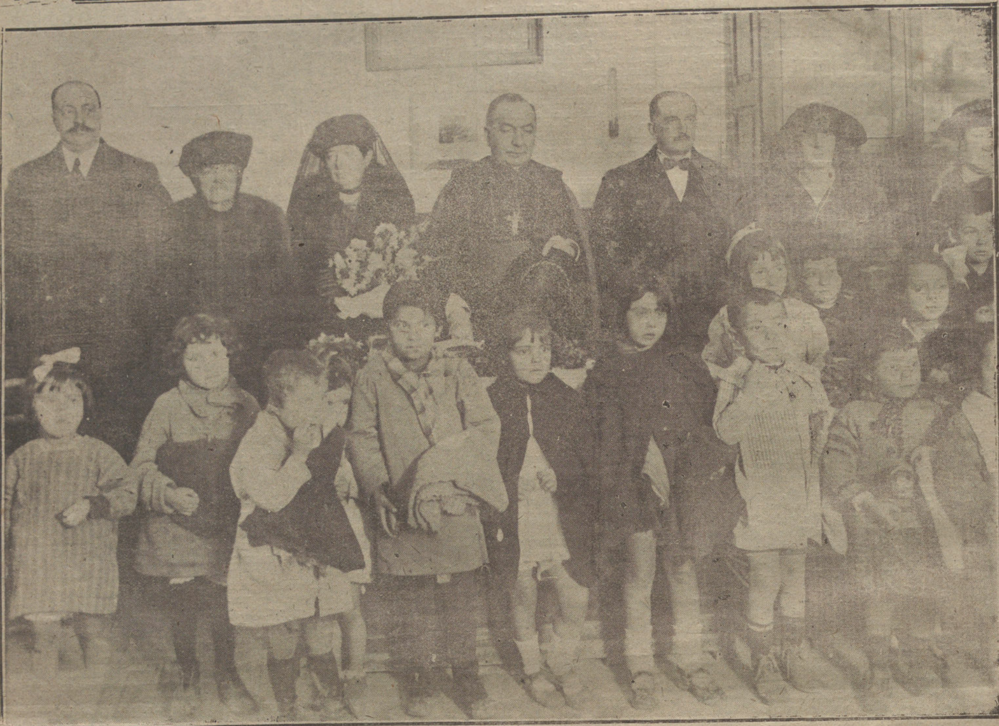
EL BISPO DE MADRID-ALCALÁ, PRESIDENDO EL REPARTO DE ROPAS, VERIFICADO EN EL COLEGIO REINA VICTORIA.

nido, tengamos que sufrir, estemos pasando las horribles y destructoras consecuencias de esos torpes abandonos.