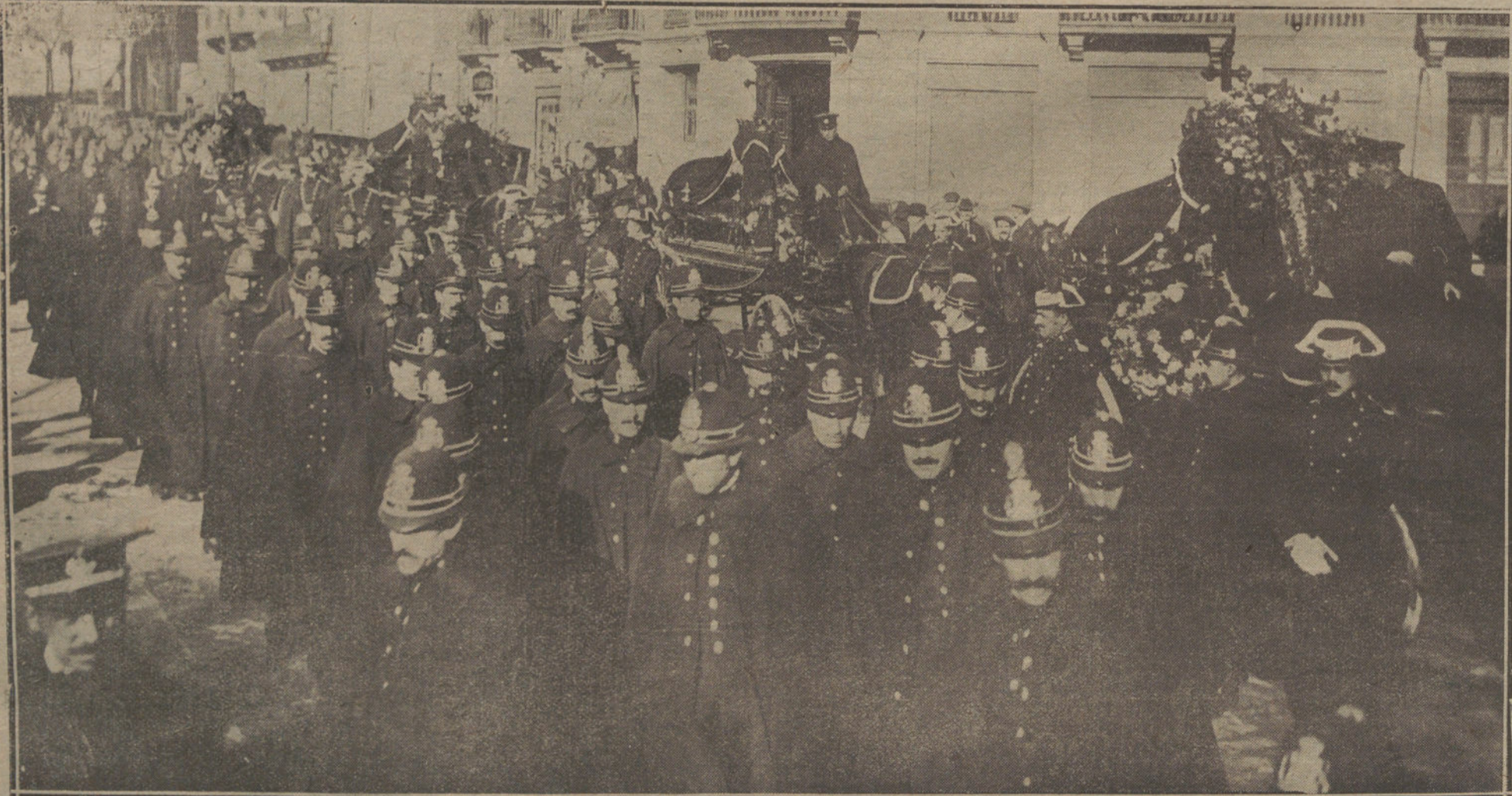
IMPONENTE MANIFESTACION DE DUELO CEBERADA CON MOTIVO DEL ENTIERRO DE LOS CUATRO GUARDIAS DE SEGURIDAD MUERTOS EN LA LUCHA SOSTENIDA DIAS PARA DOS CON GENTE MALIZANTE EN LA BA RIADA DE ATAPAZANAS.

Francia, por el contrario, no acepta el punto de vista inglés, y protesta contra la conducta de su aliado. Radio.