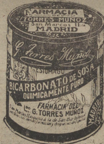
LATAS ECONOMICAS DE 1 1/2 KILOS