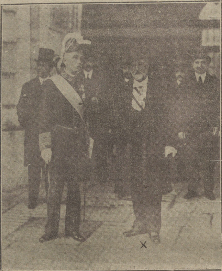
EL NUEVO MINISTRO DE INSTRUCCION PUBLICA, SEÑOR MONTEJO ACOMPAÑADO DEL SEÑOR DATO, AL SALIR DE PALACIO. DESPUES DE JURAR EL CARGO.

La Administración de LA TRIBUNA está instalada en nuestro edificio, calle de Jardines, 4 y 6, esquina a la de Montero, adonde debe dirigirse toda la correspondencia.