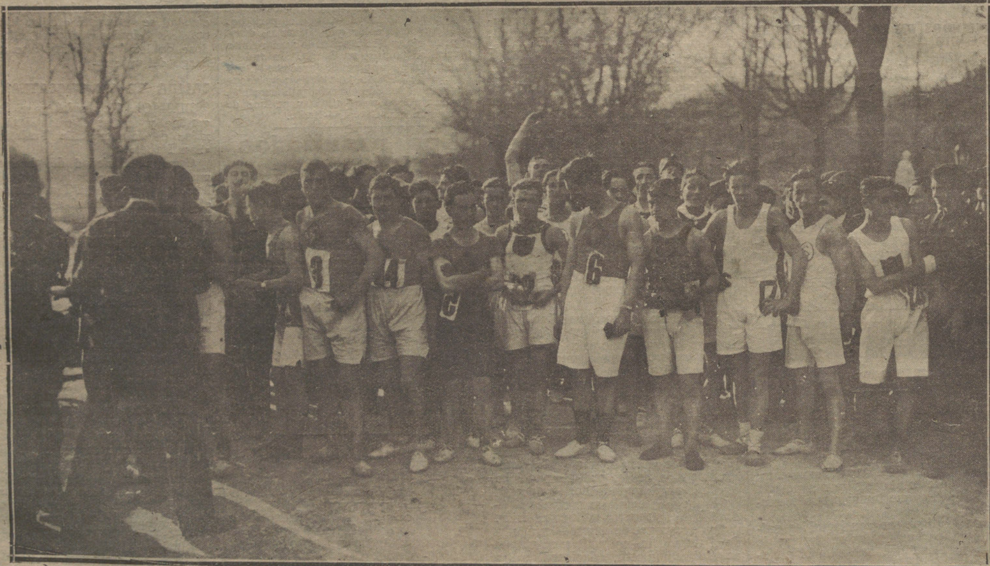
LOS DEPORTES EN SAN SEBASTIAN.—CUARTA CARRERA INTERNACIONAL ORGANIZADA POR EL CLUB DEPORTIVO «FORTUNA». GRUPO DE CORREDORES QUE TOMARON PARTE EN EL CONCURSO.

Vapor correo español «Rey Jaime I», para Palma; vapor americano «Elkino», para Nueva York; vapor danés «Tekkle», para Tarragona y Valencia; vapor español «Andra Mend», para Tarragona; pailebote español «Salvador Magro», para Ibiza; vapor noruego «Narengo», para Hamburgo.