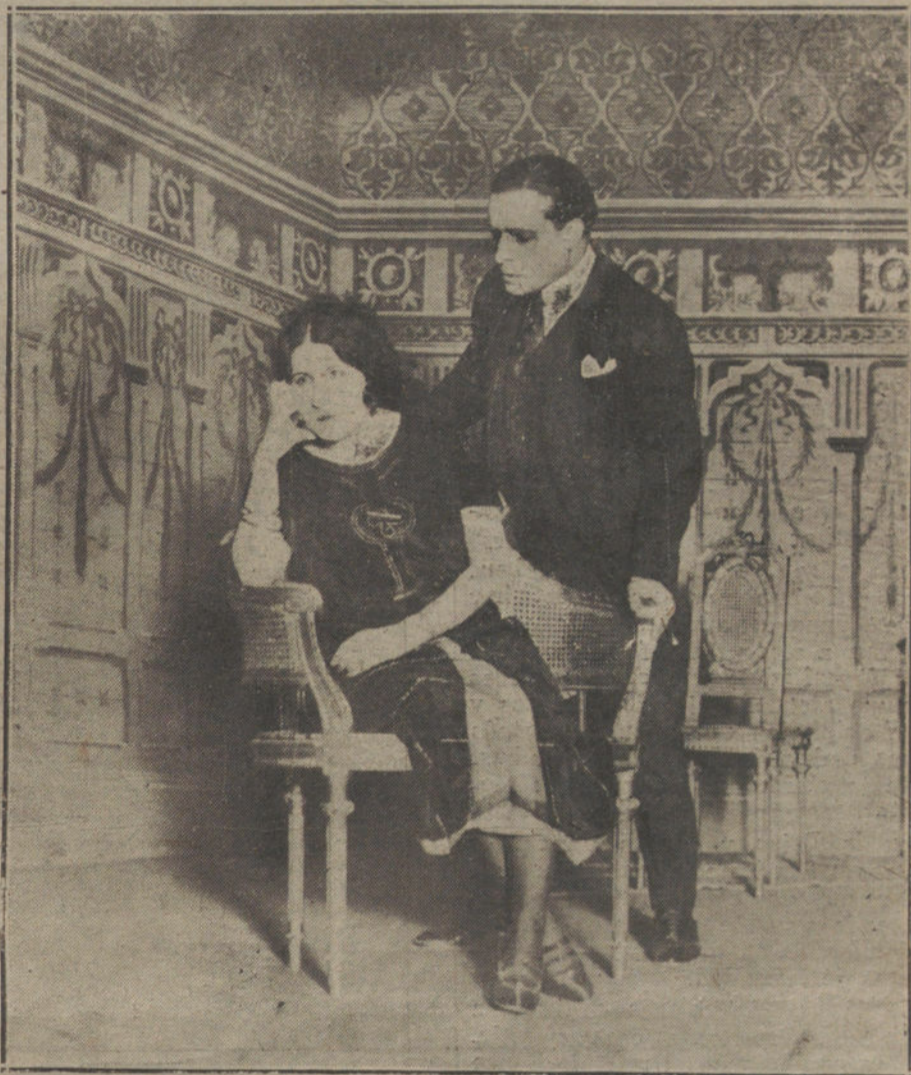
UNA ESCENA DEL DRAMA «COMO EL HUMO», QUE SE ESTRENA ESTA NOCHE EN EL TEATRO DEL CENTRO.

Las responsabilidades deberán pedirse en una Junta general, que se convo-