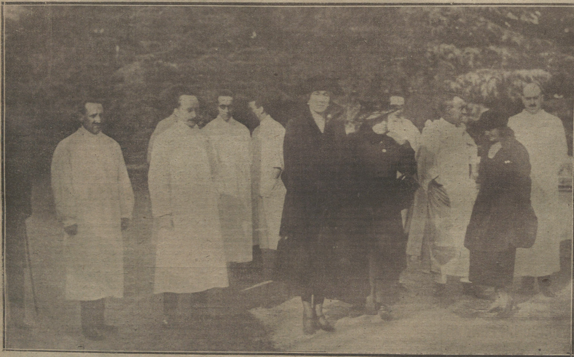
EU MAJESTAD LA REINA DOÑA VICTORIA ACOMPAÑADA DE SU MADRE, LA PRINCESA BEATRIZ DE BATTEMBERG, AL SALIR DE LA VISITA HECHA AYER AL HOSPITAL DE SAN JOSE.