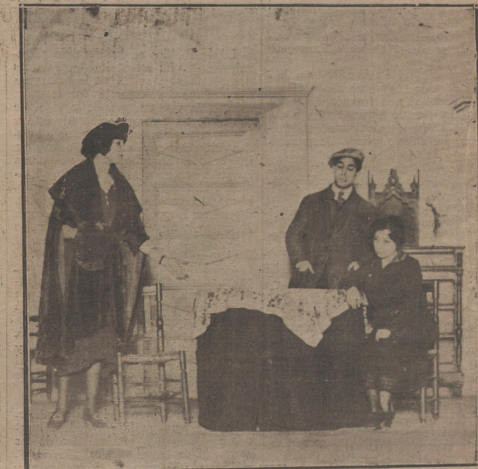
UNA ESCENA DE «LAS DOS SENDAS», OBRA ESTRENADA ANOCHE EN EL TEATRO DE LA VILA.

Para salvar al país de esa maldición y para realizar una labor económica y social de honda trascendencia, el Gobierno encontrará una mayoría abrumadora a base de los diputados ministeriales. Los defensores de la política de grupos sostienen la teoría de que las mayorías se forman circunstancialmente, y para cada problema a resolver como resultado de coincidencias entre el Gobierno y los grupos parlamentarios. Con estos mismos argumentos a la vista, puede decir el Gobierno que