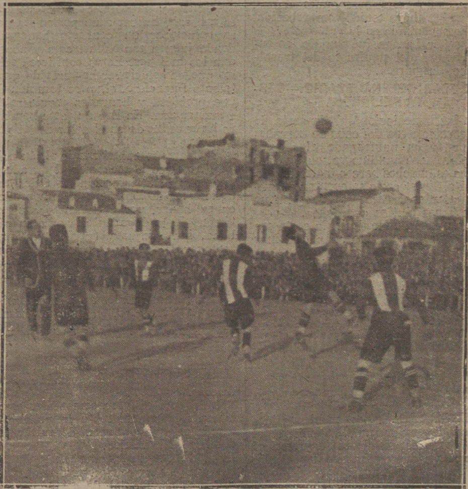
Un momento interesante del partido de «foot-ball» jugado ayer tarde entre los equipos «Deportivo Español», de Barcelona, y «Racing», de Madrid.