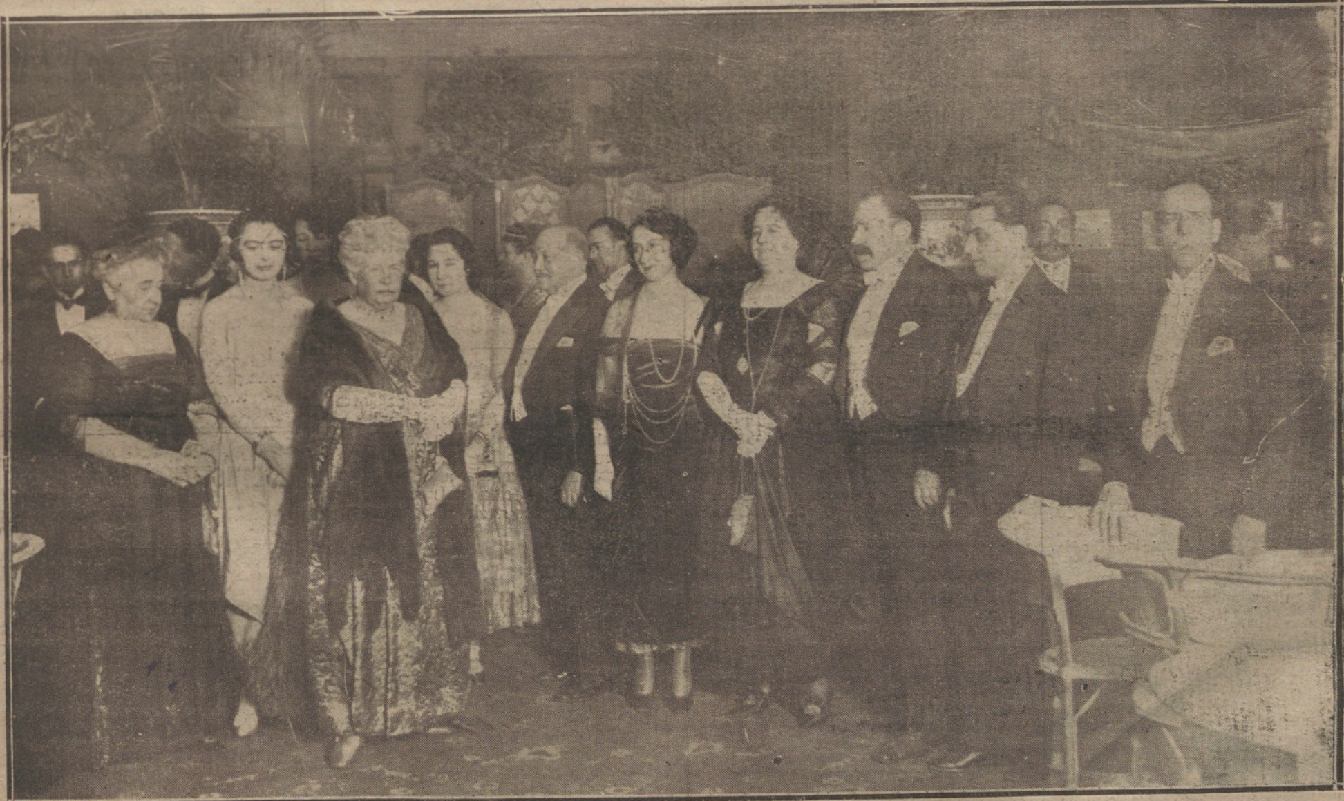
Su Alteza la Infanta Isabel en la fiesta aristocrática celebrada anoche en el Ritz para recaudar fondos con destino al monumento a Fortuny.