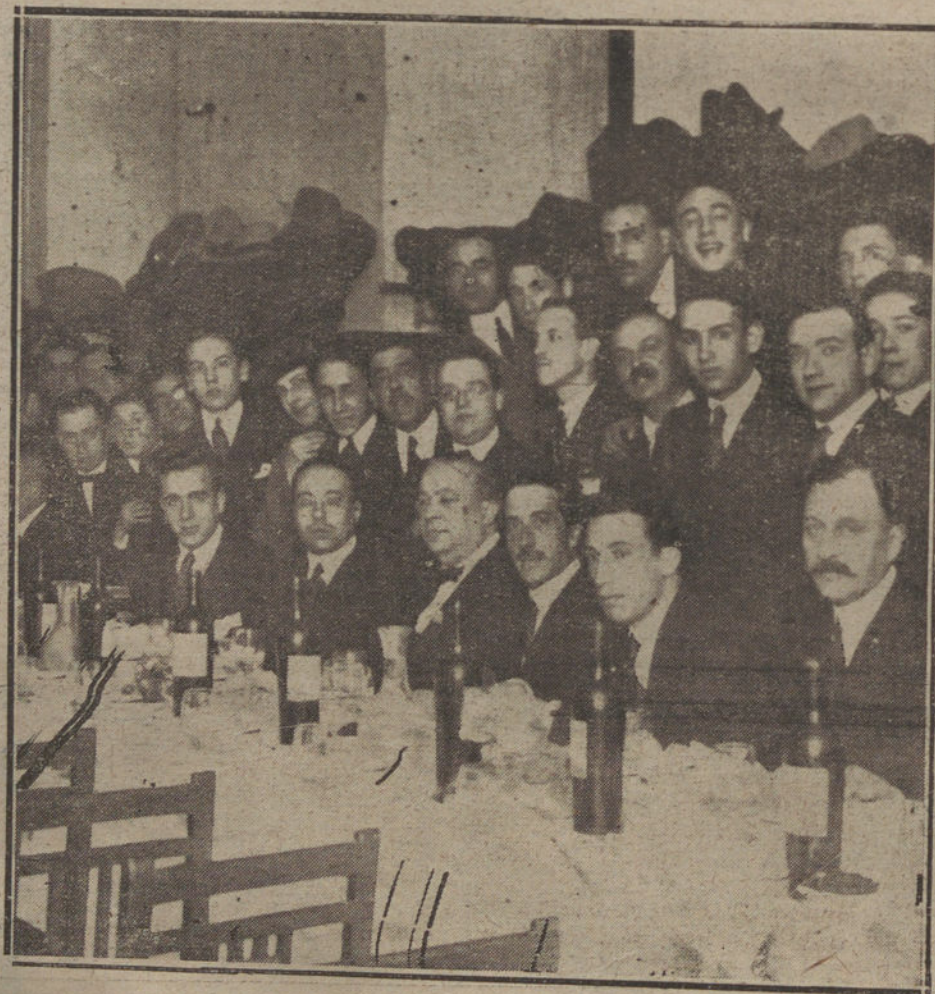
Banquete celebrado por el personal de «El Financiero», para festejar el XXI aniversario de su fundación.

Muy brillante y concurrido estuvo también el «reveillon» del Palazo Hotel, organizado con gran acierto y pericia por el simpático Gemelli. Todas las mesas estaban ocupadas por distinguidas señoras y personas conocidas, y la cena fué verdaderamente espléndida. A punto de las doce, se apagaron las luces, mientras la admirable orquesta Boldi saludaba con la Marcha