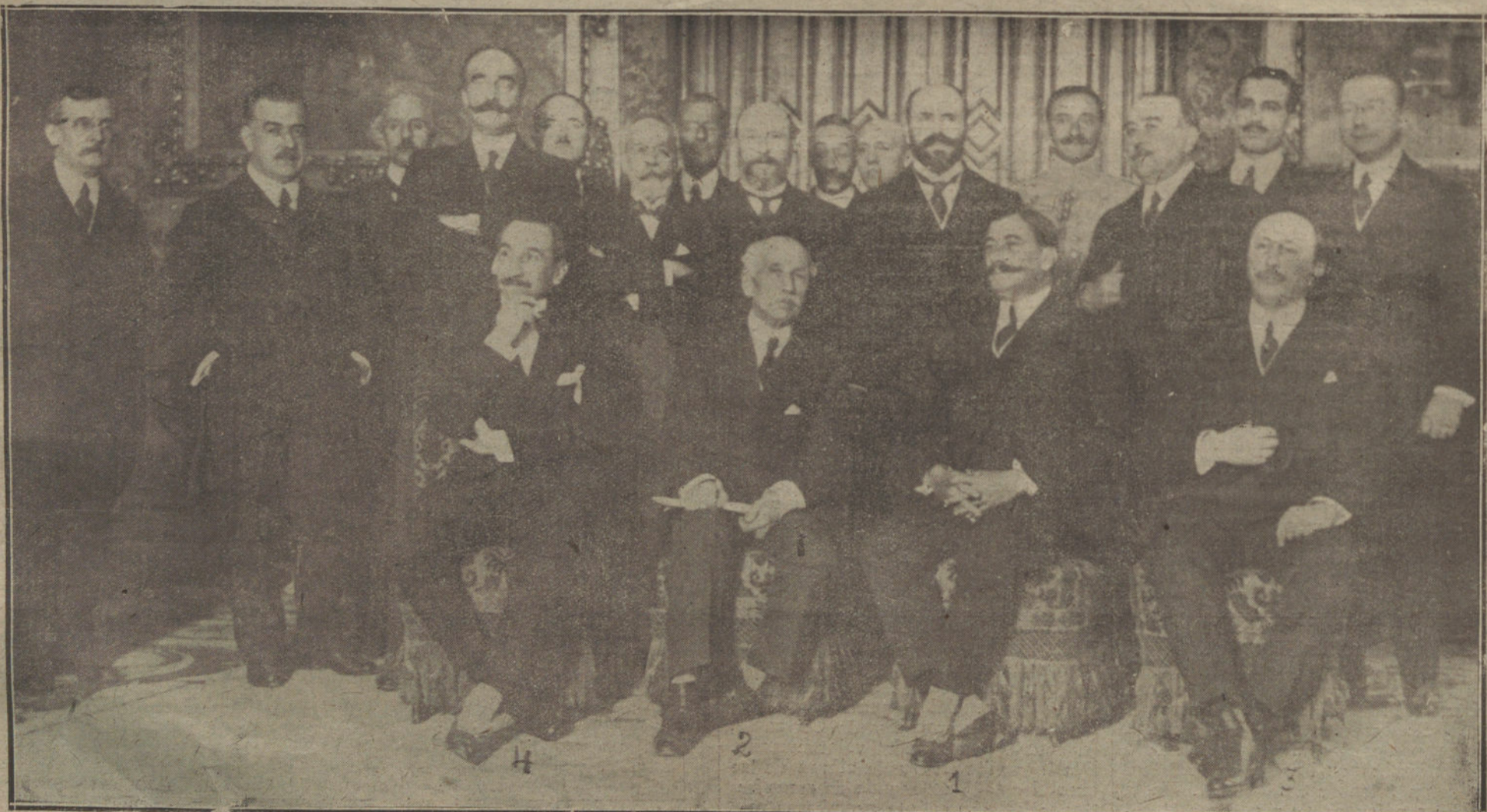
El general Berenguer (1) con el presidente del Consejo (2), el ministro de Estado (3) y el de la Guerra (4), después del banquete con que fué obsequiado el alto comisario en Marruecos.