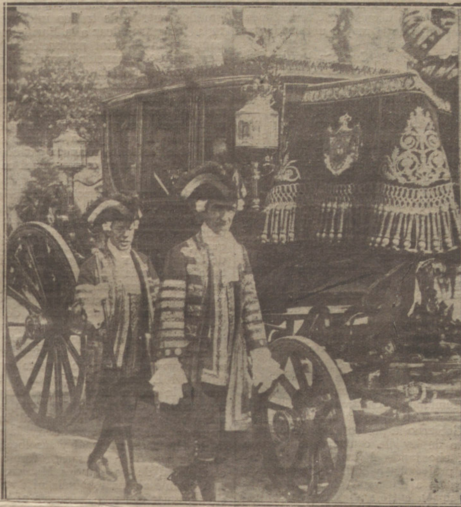
Su Majestad el Rey en la carroza que le ha conducido al Senado.

Poco después de las dos y media empezó a organizarse la regia comitiva,