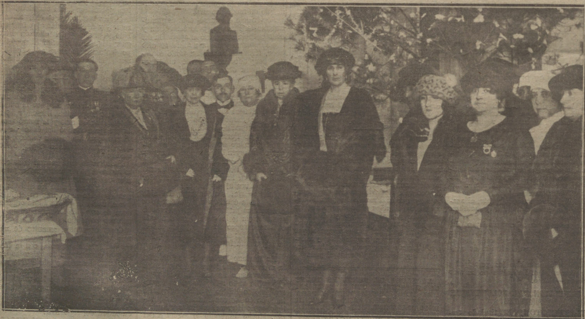
Sus Majestades las Reinas y Sus Altezas Reales las Infantes doña Isabel y doña Luisa en el Hospital de San José, durante la celebración de la Fiesta del Arbol de Navidad, verificada ayer tarde.