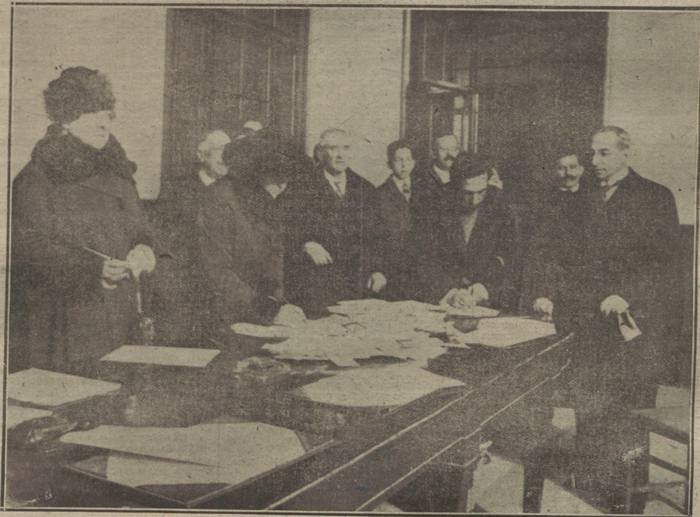
HOMENAJE AL GOBERNADOR CIVIL DE BARCELONA. El público firmando en las listas y depositando tarjetas de felicitación el día 1.º de año.