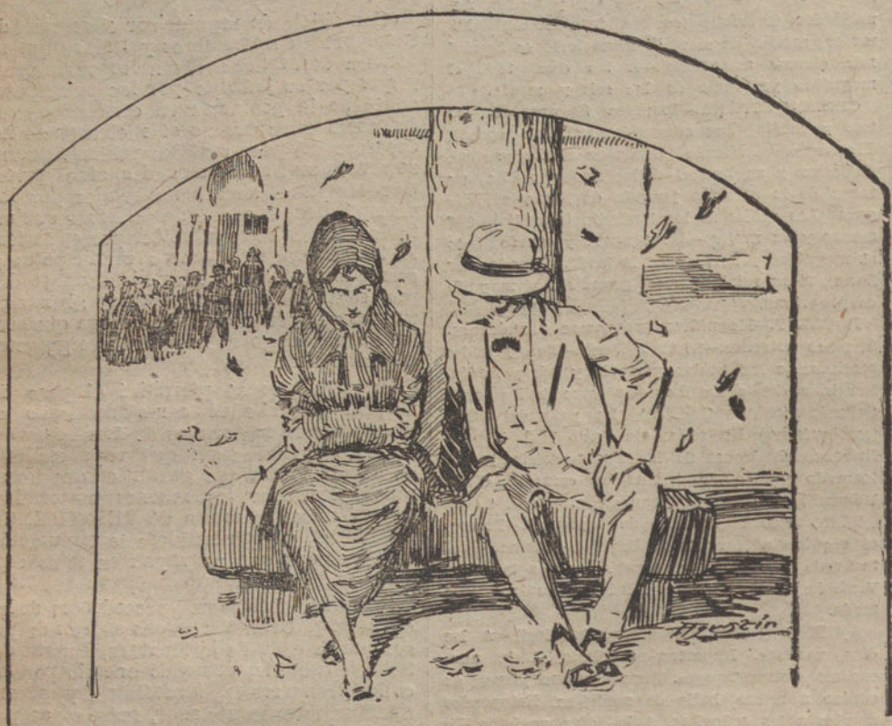
«Hojas del árbol caídas juguete del viento son.»