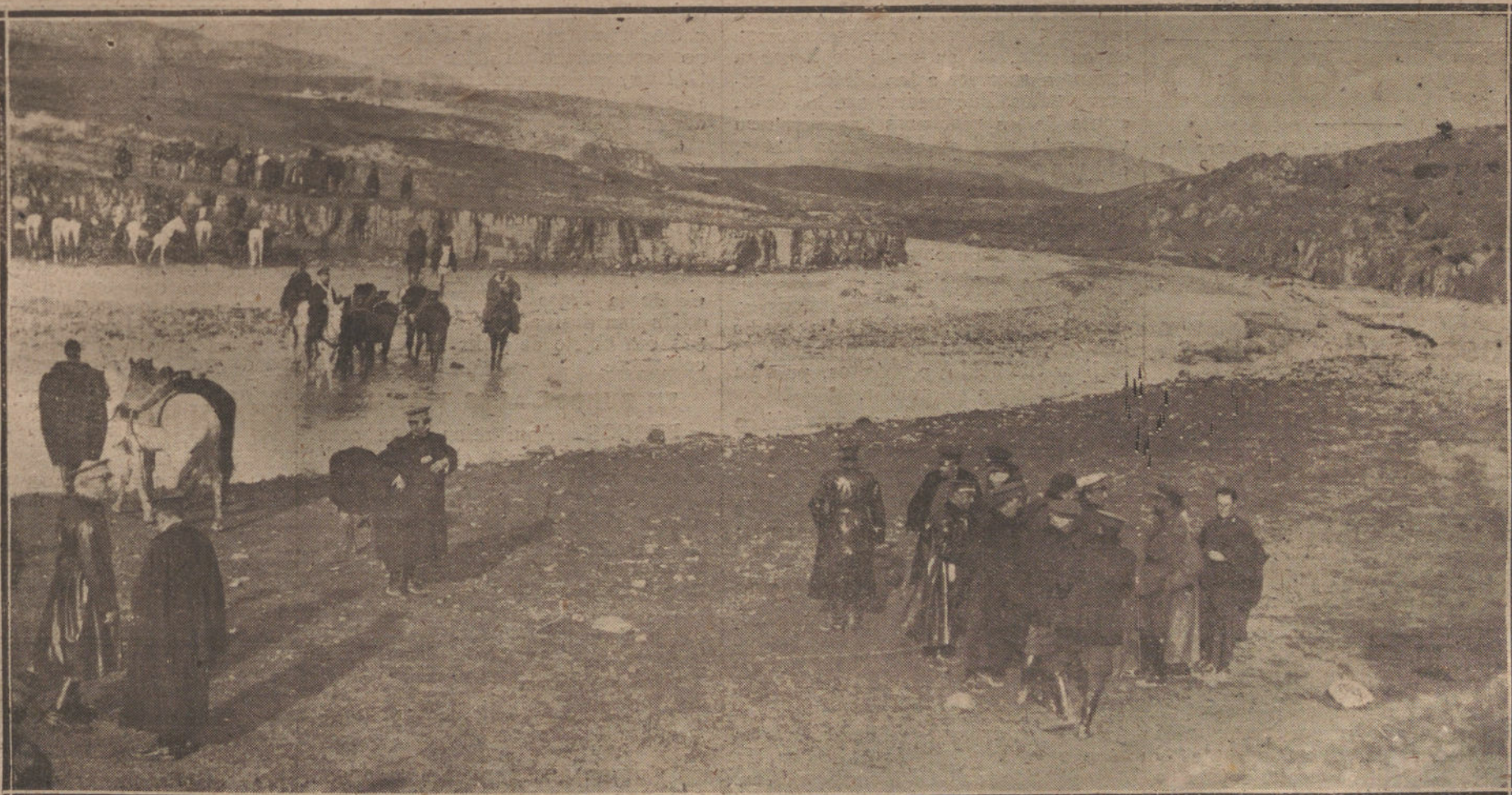
FIESTA HISPANOAFRICANA EN MELILLA. Jefes y oficiales pasando el río Baase para asistir a la fiesta celebrada en la posición de Yararf el Baase, con motivo de la ocupación total de la cabila de Beni-Said.

El Gobierno, ante la actitud violenta del señor La Cierva, se ha limitado en Murcia a no prestar apoyo a las fuerzas ciervistas, acostumbradas siempre a disponer para sus fechorías de la fuerza del Poder; pero el representante del Gobierno ha sido impotente para contener los desmanes de los caciques. Veinticinco años una provincia entregada a un feroz caciquismo, no era tan fácil desarraigar todos sus tentáculos; por eso no es de extrañar que en este