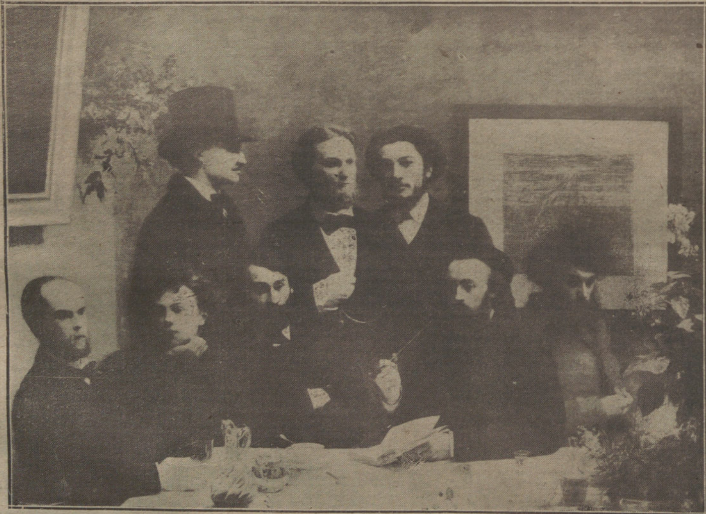
RINCON DE CAFE DE RESTAURANT.—Cuadro de Fautin Latour, en que se destaca entre el grupo de lo más florido de la época: Verlaine y Rimband

EL ANUNCIO EN «LA TRIBUNA» ES EL MAS PRODUCTIVO POR SU AMPLIA INFORMACION Y SU EXTENSA TIRADA.