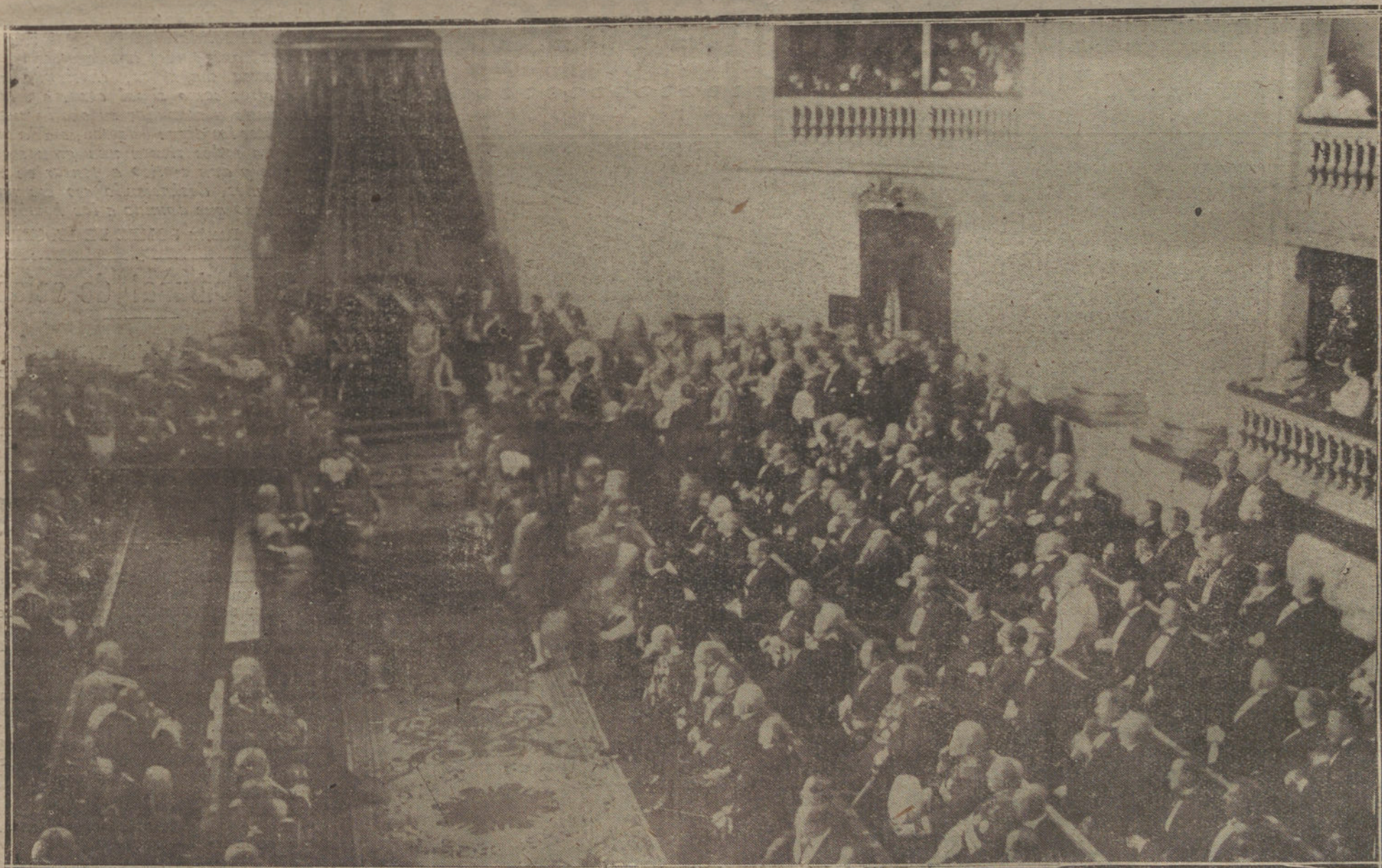
Aspecto del salón de sesiones del Senado durante la solemne apertura de las Cortes. Momento de dar S. M. lectura al Mensaje de la Corona.

El general encargado del despacho de la Alta Comisaria participa al ministro de la Guerra que el comandante general de Lagache le comunica que, haciendo uso de autorización concedida por alto comisario, ha ocupado ayer por la Policía una posición entre Mésal y la Mezora, habiendo sostenido fuerte tiroteo con enemigo procedente de Janadak y Sidi Embarek, habiendo tenido un herido grave, y sin novedad en la Policía.