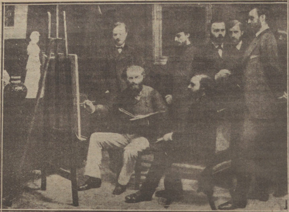
UN TALLER DE PINTOR EN BATIGNOLES.—De izquierda a derecha, Schol-dreco, Fautin Latour (sentado), Renoiz Manet (sentado), Emilio Zola, Ed-mod Maitre, Bazille, y en último término, Claudio Monet

Los retratos de grupos que han hecho algunos grandes pintores debían ser más obligados y más constantes en la vida, recogiendo lo más florido de cada generación, aunque no se sepa si algunos quedarán anónimos. Ha habido un momento en que han estado tan con-