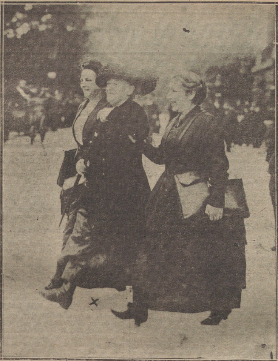
La famosa bolchevique Zetkin Klara Zetkin (X), que ha asistido al Congreso socialista de Tours, habiendo conseguido burlar la persecución de la Policía francesa, que había establecido un servicio especial en la frontera para impedir la entrada de la célebre propagandista.