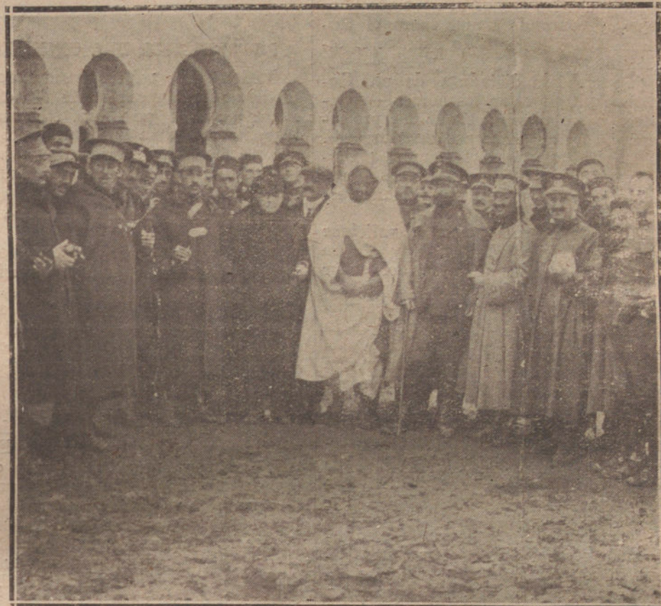
FIESTA HISPANOAFRICANA. Jefes y oficiales con el jefe de la cabila de Beni-Said, durante las fiestas celebradas en Yararf el Baase.

Todavía esperamos que el Supremo anule esas proclamaciones. En poder