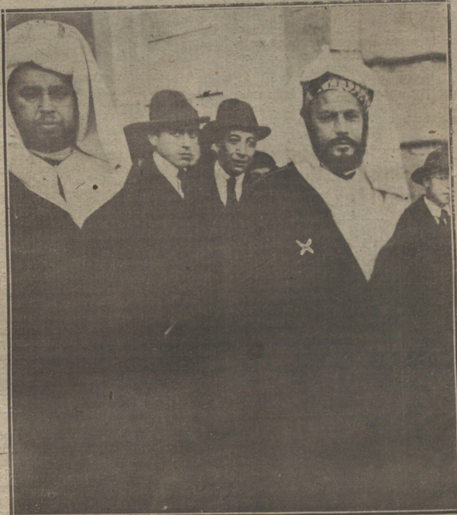
El «caído» de Arcila, que ha venido a Madrid para asuntos políticos, saliendo de Palacio.

Pero no es ese el aspecto que más nos interesa recoger de las informaciones extranjeras. Lo que hallamos de más curioso en los comentarios desfavorables de «L'Humanité» es el afán, la impaciencia, la precipitación con que acude siempre a hacerse eco de las calumnias contra nuestra patria. «L'Hu-