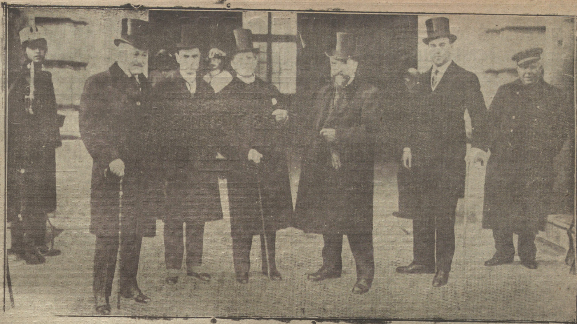
El Comité ejecutivo de las Exposiciones para el monumento a Fortuny, saliendo de Palacio, donde ha estado esta mañana a expresar su agradecimiento al Monarca.