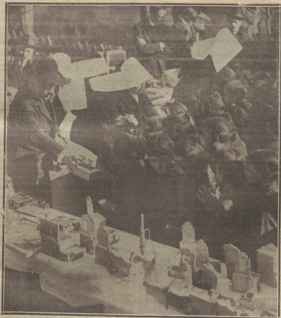
Un detall del reparto de juguetes verificado en el Asilo de Vallhermoso.