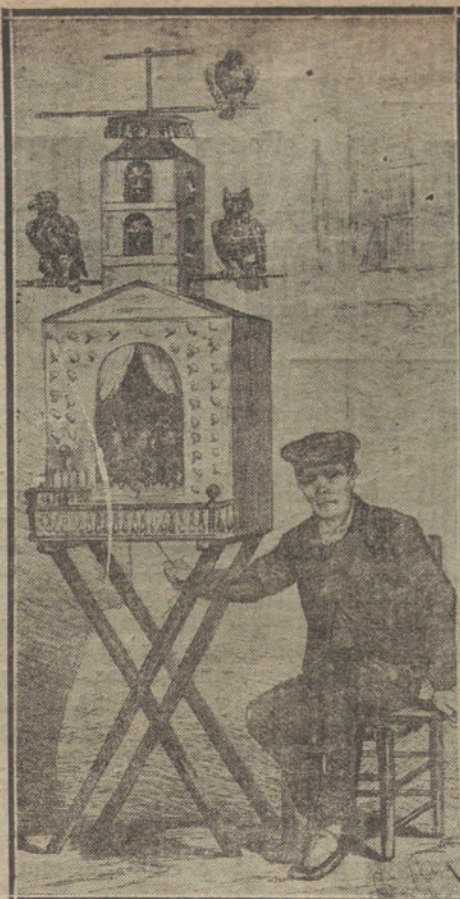
«Por dos cuartos se dan los hijos de la lotería y el sino de cada persona. ¿Quién pide otro?»

Los pajaritos parecen menos torpes, menos abrumados por su tontería, más ágiles y más transmisores del pensamiento de la suerte. Incapaces de pre-