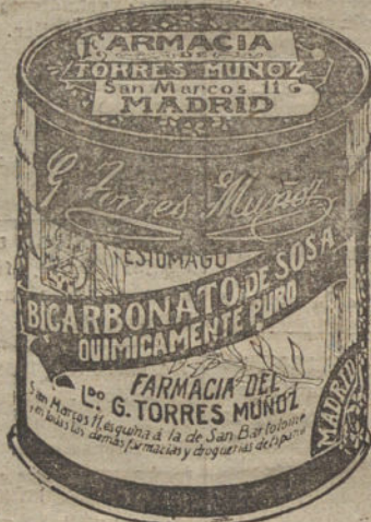
LATAS ECONOMICAS DE 1 1/2 KILOS