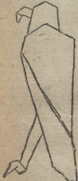
(Figura 0). Facsimil del avechicho, última creación de Unamuno.

Yo ya he hablado en otra ocasión de la cocotología o arte de fabricar con el papel pajaritas o cosa que lo valga. Cambó, que es un cocotólogo en el que se cuenta más la afición cuanto más está preocupado y que deja caídas a su alrededor cuando va al Parlamento numerosos pajaritas que él hace, comenzando por una regular y acabando por una muy pequeña, en una escala descendente.