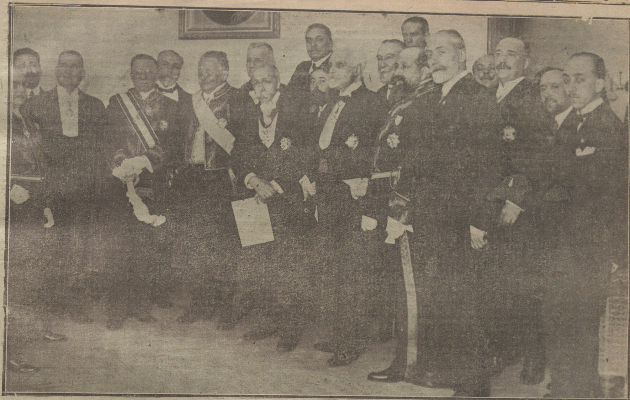
Grupo de personalidades que asistieron ayer a la apertura del curso de la Real Academia de Medicina.

se ocupa el «Boletín de la Federación Patronal», el cual reconoce también como causas principales de la crisis la falta de método con que se ha realizado el aumento de los jornales de los obreros y la merma de la producción, que en muchos ramos de la industria alcanza ya a un 50 por 100 de la obra que antes se realizaba.