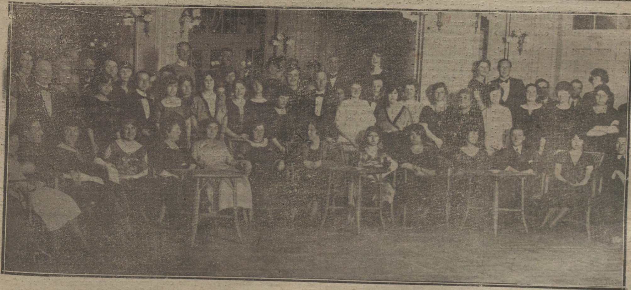
Fiesta organizada por la colonia inglesa en el Palacio-Hotel, a beneficio de la Cruz Roja inglesa.

ción política, siempre en defensa de la Monarquía, el señor Bugallal, como ministro de la Gobernación, haya apo-