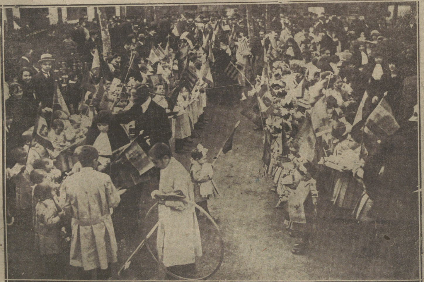
Reparto de juguetes a los niños del Asilo municipal del Parque, organizado por el Ayuntamiento de Barcelona.