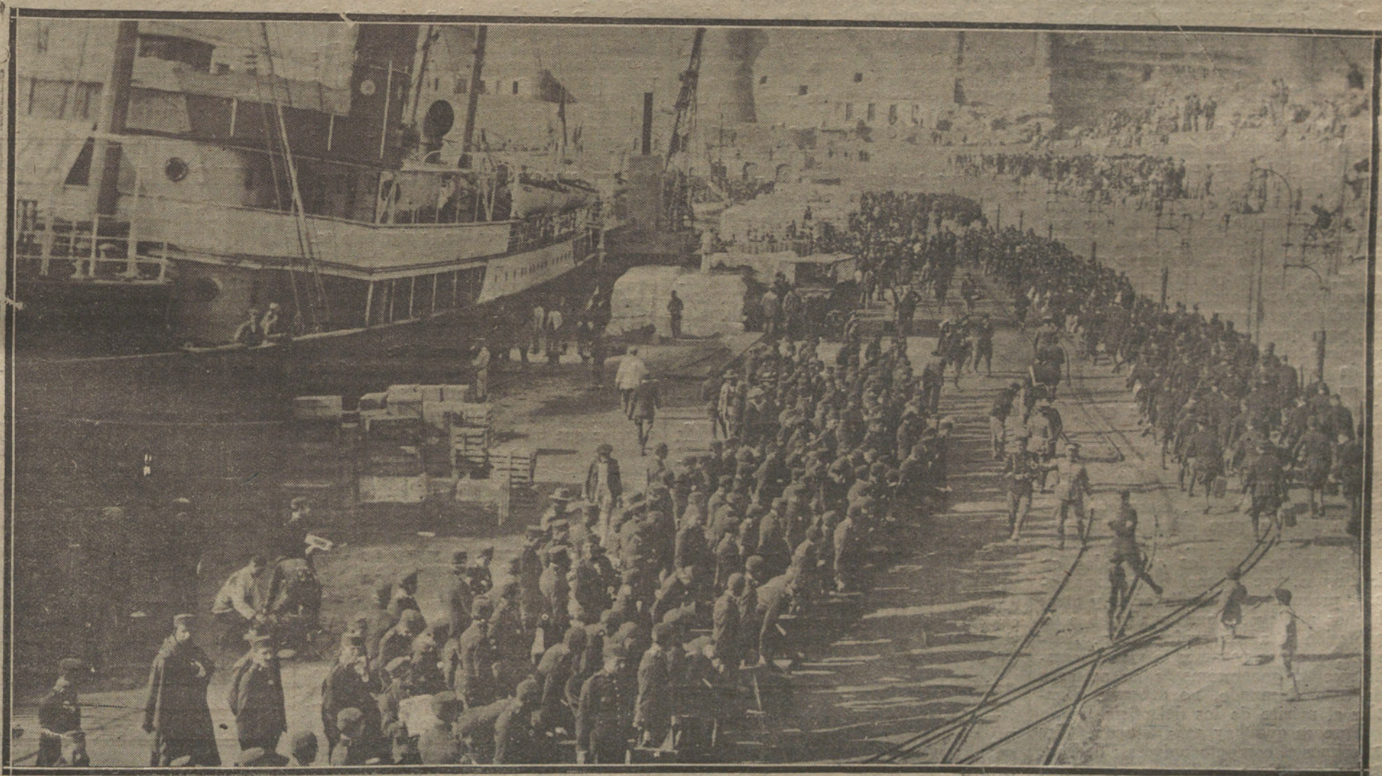
As pecto del puerto. Melilla, durante el embarque de licenciados.