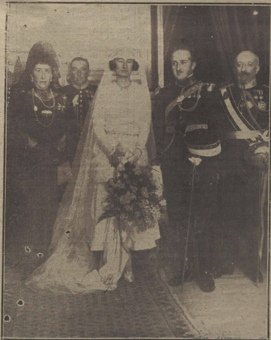
Boda de la hija de los marqueses de Castelar con el conde de Aybar, a los que apadrinaron Sus Majestades los Reyes.

WASHINGTON. La resolución que acaban de tomar los Estados Unidos de retirar su representante del Consejo de embajadores está basada en la idea que en los Estados Unidos se tiene de qué este Consejo, tal como está actualmente constituido, no interpreta los fines del pueblo americano. La petición reciente hecha por el Gobierno francés de poner a Alemania en la obligación de cumplir las cláusulas del desarme decididas en Spa ha apresurado esta medida.—Radio.