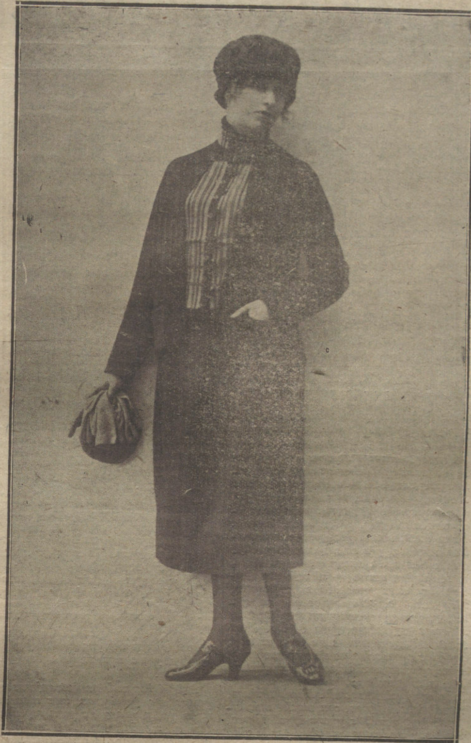
Traje hechura sastre, con chaleco de punto de media, última creación de la casa Greuze