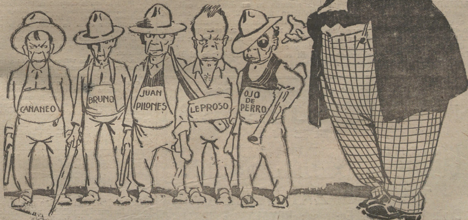
LAS FRASES DE LA CIERVA.—«Hé aquí mis héroes.»