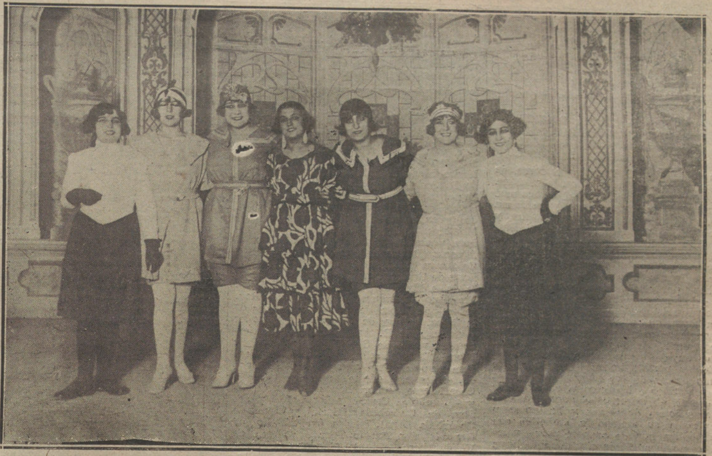
Una escena de «La Peña de los cien», obra estrenada anoche en el teatro Cómico.

Los doctores le extrajeron la bala; pero esto no consiguió aliviar al herido.