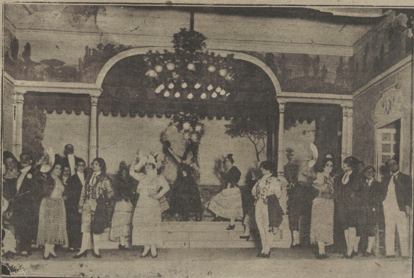
Una escena de «Las delicias de Capua», obra estrenada anoche en el teatro de Cervantes.

Durante los domingos del pasado año acudieron a la Biblioteca municipal 394 lectores.