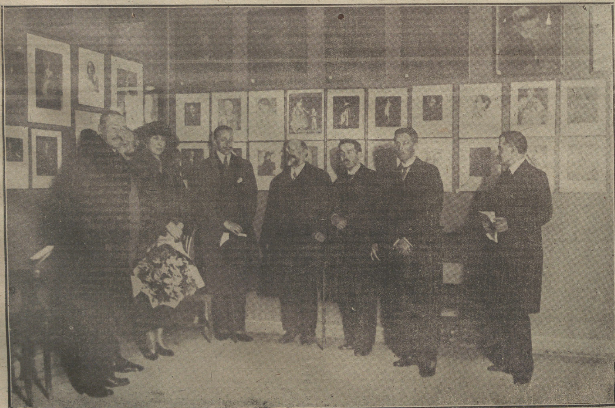
Sus Majestades los Reyes durante la visita que hicieron ayer tarde a la Exposición Nacional de Fotografías, que se celebra actualmente en el salón del Circulo de Bellas Artes.

WASHINGTON. Con arreglo a la decisión ya hecha pública del Gobierno americano, el embajador de los Estados Unidos en París, Mr. Hugh Walla- ce, recibirá muy pronto la orden de no asistir en adelante a las sesiones de la Conferencia de embajadores. Fúndase tal determinación en que no estando considerados los Estados Unidos como signatarios del Tratado y estando arregladas todas las cuestiones referentes al armisticio, no puede discutirse hoy más que sobre el mismo Tratado de Versalles, y América no puede, por lo tanto, tomar parte en ella.