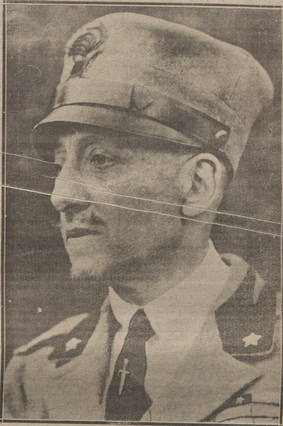
EL POETA D'ANNUNZIO, DICTADOR DE FIUME.—Fotografía obtenida para «The Illustrated London News» en la citada plaza pocos días antes de su rendición