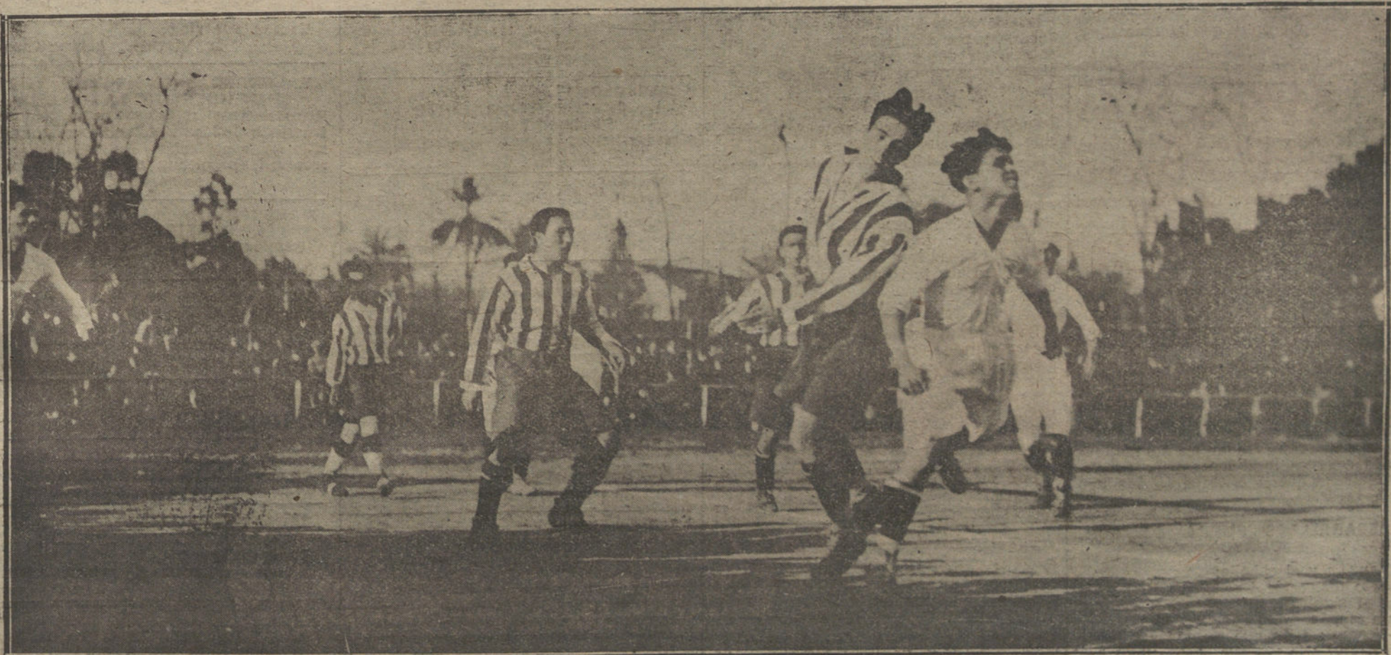
Uno de los momentos culminantes del interesantísimo partido de «foot-ball», jugado en Sevilla entre los equipos Athletic de Madrid y Sevilla F. C., que han quedado empatados en los dos días que ha durado el partido.

¡Esto es empezar con pie de «fantomeno»!