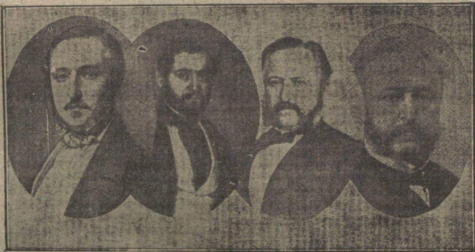
Curiosa escala de edades y fisonomías de don Ramón de Campoamor

Feliz, con calefacción, con su manta de coche eternamente sobre las piernas, Campoamor un día dejó de darse su paño de seda y se murió.