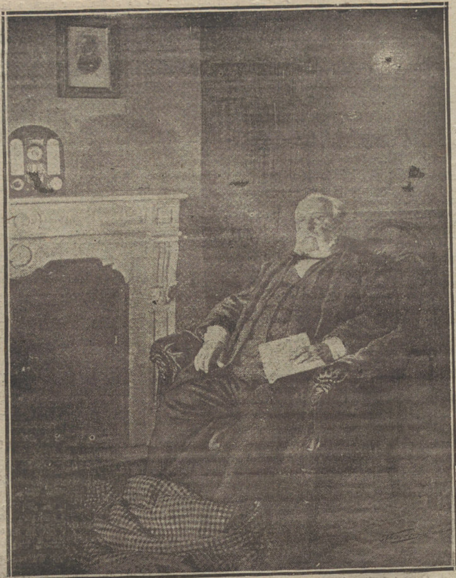
Campoamor en sus últimos días

La librería de Fé. Murio y le trajeron un hermoso ataúd, rico y severo. En aquel ataúd descansó pocas horas, pues el Gobierno se decidió a costear el entierro y mandó llevar uno de sus mejores féretros; pero el féretro oficial era demasiado grande y se temió que fuese dando tumbos por el camino del cementerio. Entonces a alguien se le ocurrió envolver el féretro, colocando en él los libros del muerto, que así se llevó al otro mundo para poner algunas dedicatorias a los amigos y regalárselo.