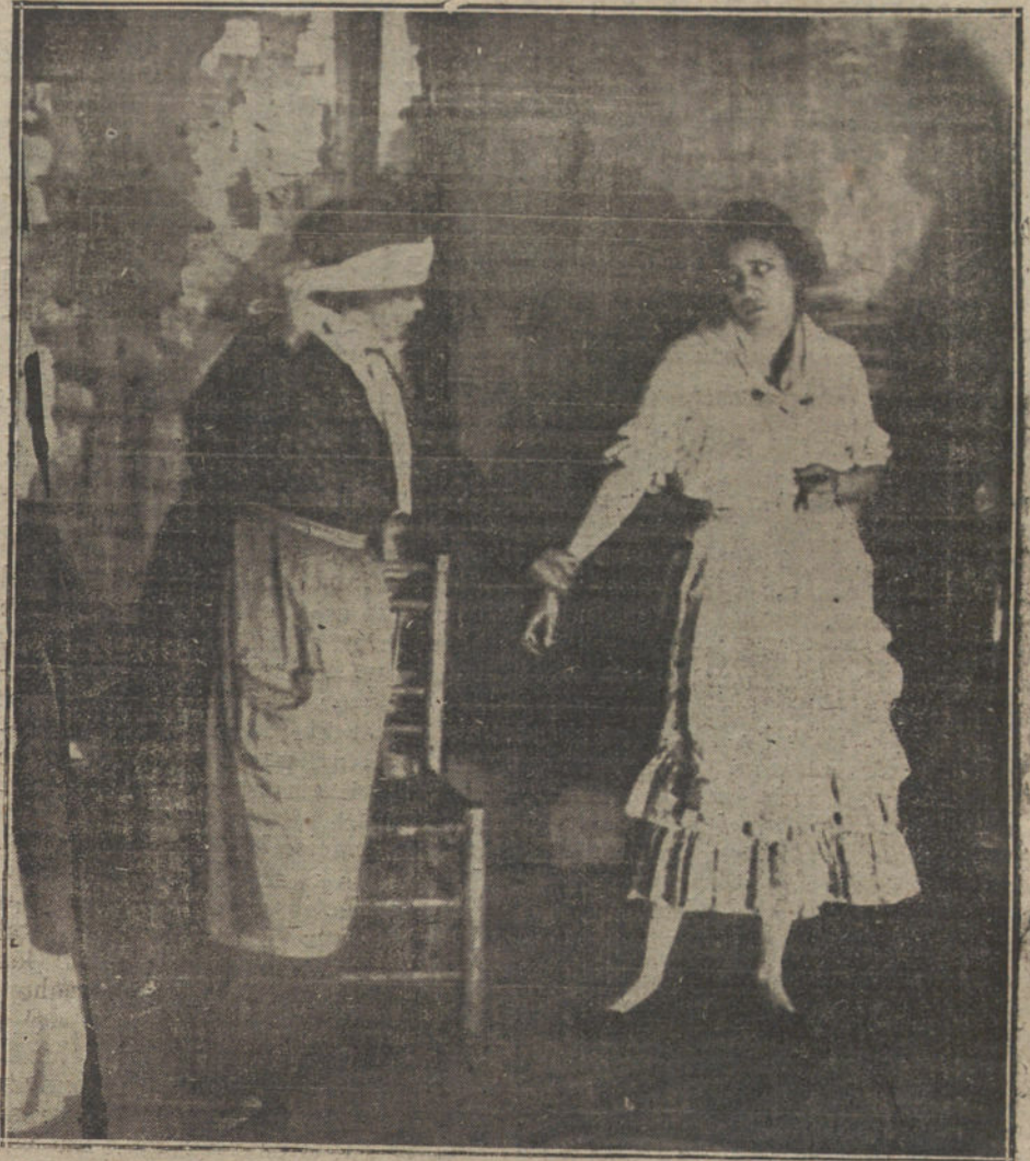
Las señoras Quiroga y Mancini en una escena de «Barranca abajo».

Se dice que la compañía argentina está tratando de pasar al teatro Español para dar allí las funciones que res-