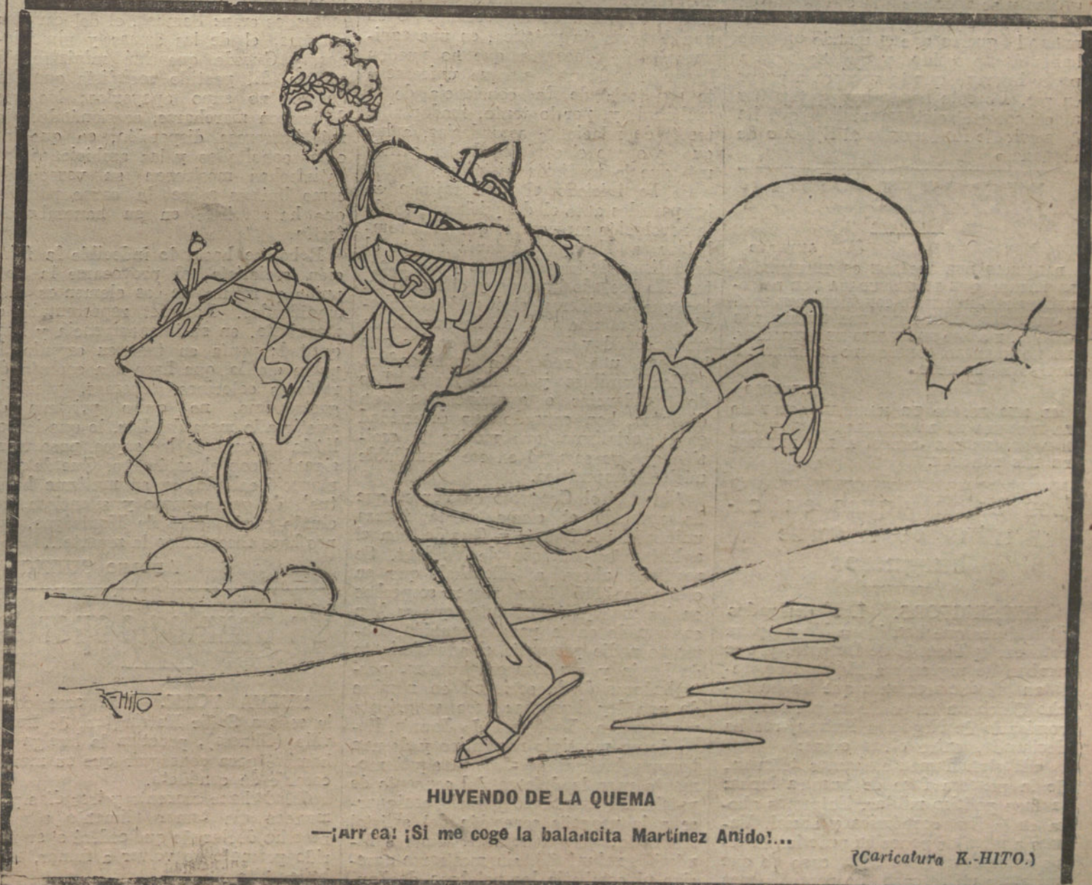
HUYENDO DE LA QUEMA

Sin Ejército, decía antes, no se concibe política internacional, porque, partiendo siempre de la interpretación económica de los hechos, es evidente que no es posible conseguir Tratado alguno de amistad, basado sobre ciertas y seguras ventajas, sin poder asegurar al amigo solicitado que se aportará a la causa común que se pretende defender una fuerza militar evidente. Para compensar ésta no basta poner a disposición del futuro amigo ventajas naturales de la posición geográfica; este