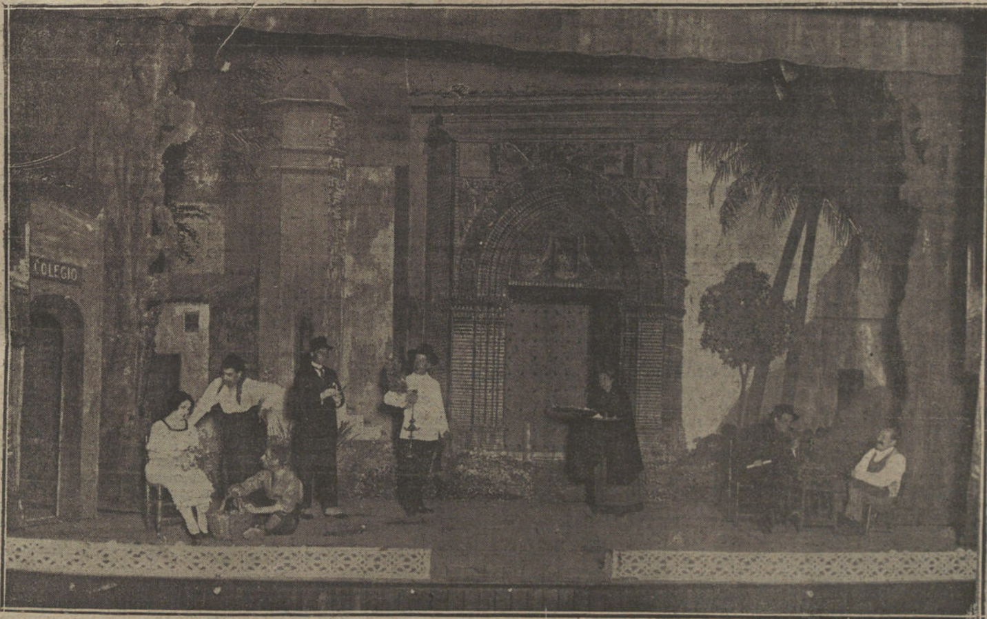
La escena del sainete «El huerto de las campanillas», original del señor Jimenez Urver y los maestros López del Toro y Mathieu, estrenado con buen éxito en el teatro del Duque, de Sevilla.

Sociedad Española de Hidrología Médica. Mañana jueves, a las seis y media de la tarde, en el Colegio de Médicos, continuará la discusión del tema «Eutrofización de las aguas minerales».