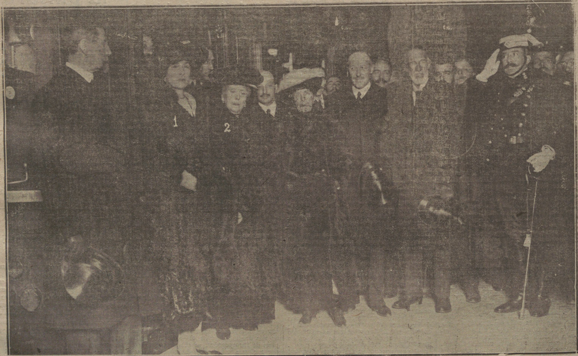
Su Majestad la Reina Doña Victoria con su augusta madre, la Princesa Beatriz de Battenberg, durante la visita que han hecho a las estaciones del Metropolitano.