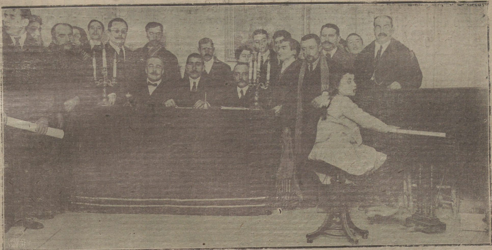
Reparto de premios verificado en el Centro Instructivo de Ciegos, acto que tuvo lugar ayer tarde.

y encaminar sus gestiones a que los funcionarios depongan aquella.