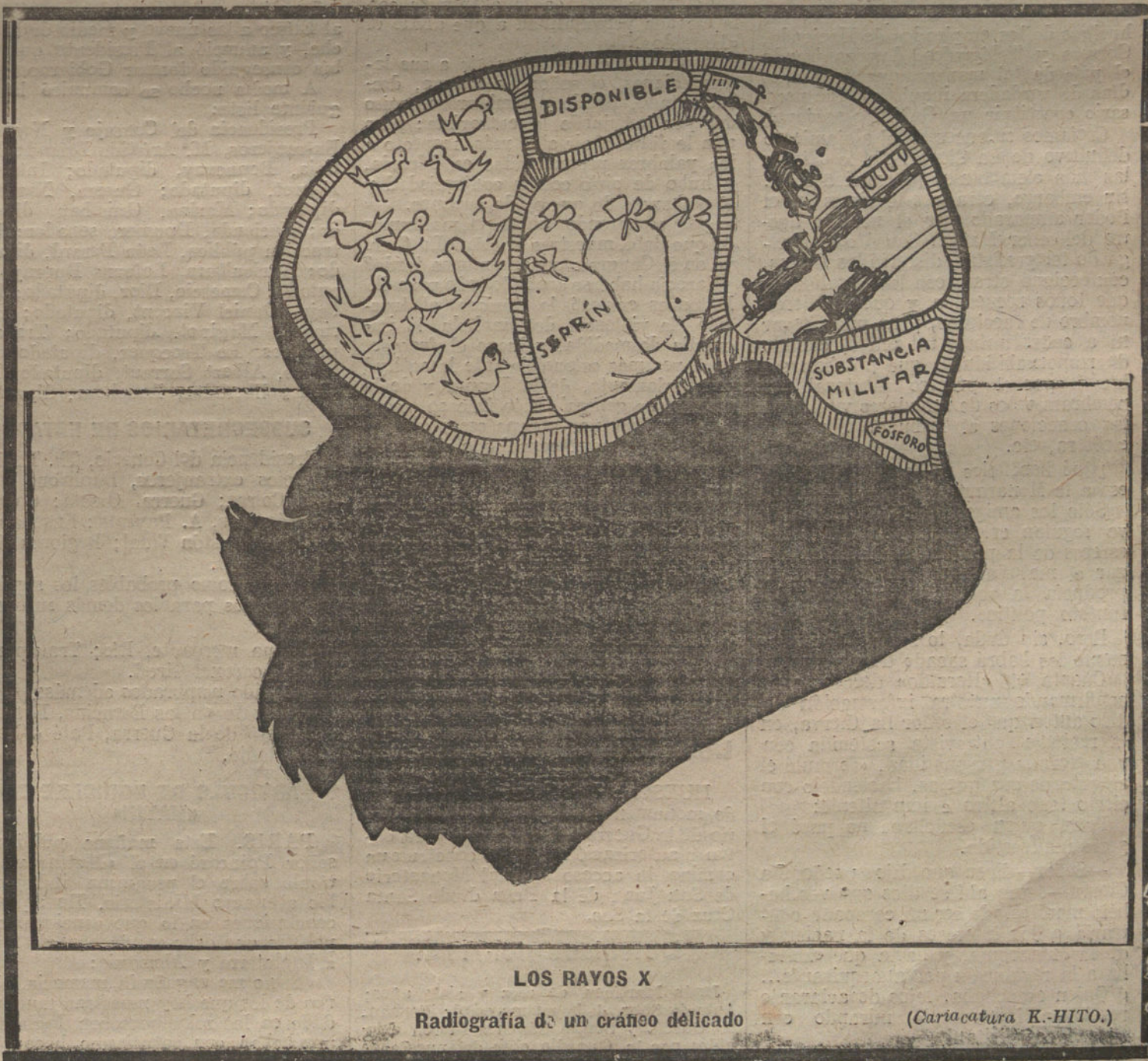
LOS RAYOS X

HUESCA. En Barbastro se ha efectuado el acto de la inauguración de las obras del cuartel en que se ha de alojar el décimo regimiento de Artillería ligera, destinado recientemente a esta plaza.