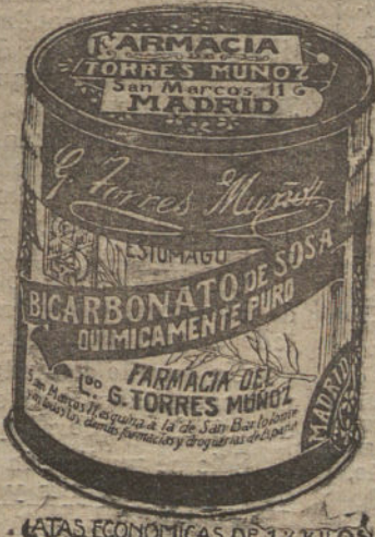
LATAS ECONOMICAS DE 1 1/2 KILOS