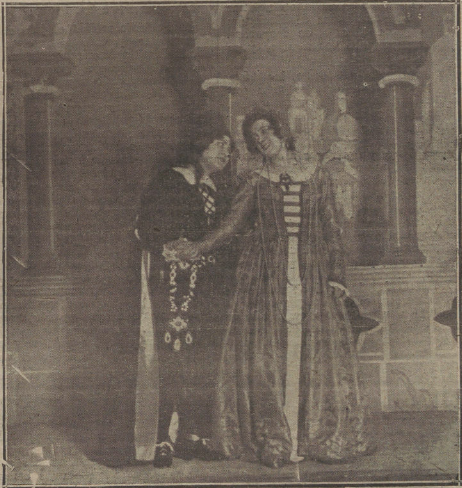
Una escena del boceto de opereta «Su alteza se casa», letra de Sinesio Delgado, música del maestro Luna, que se estrena mañana en el teatro de la Infanta Isabel.

Sólo hubo una excepción, la del director general de Contribuciones, quien