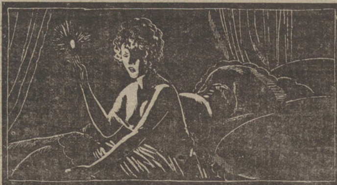
Sentada sobre la almohada, encendiste una cerilla... La llama, ínfima y vacilante, agitó en torno nuestro las siluetas de las cosas que emprendieron una danza de fantasmas...

Como el eco de las últimas palabras de María, yo repetí: