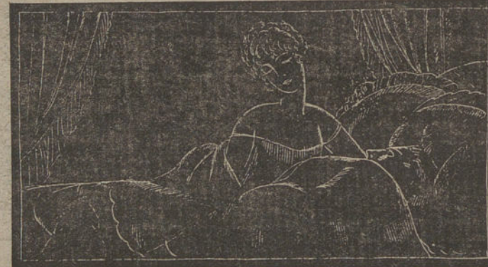
Al cabo, atraída por mis brazos e implorada por mis besos, tornaste al amparo de mi pecho, y volví a encontrarte cobijada en mi caricia, pequeña y frágil como nunca...