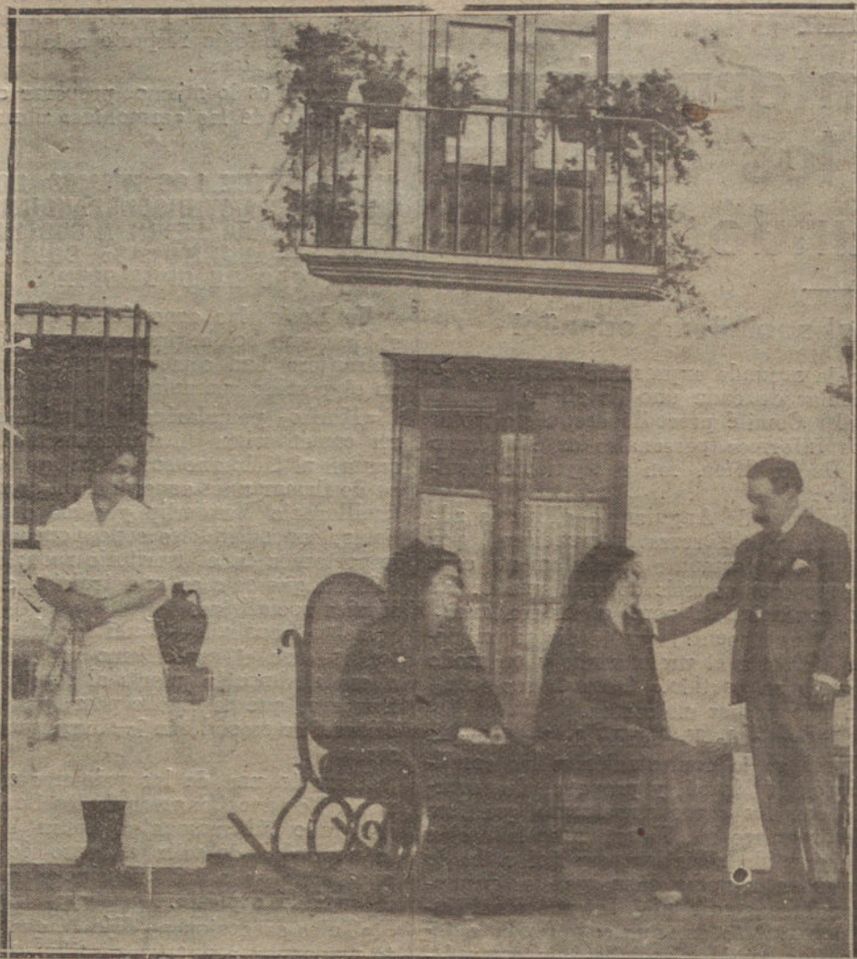
Una escena de la comedia de los hermanos Quintero «Pasionera», que se ha estrenado esta tarde en el teatro de Lara.

MAÑANA MIERCOLES Comida americana Teléfono 32-25