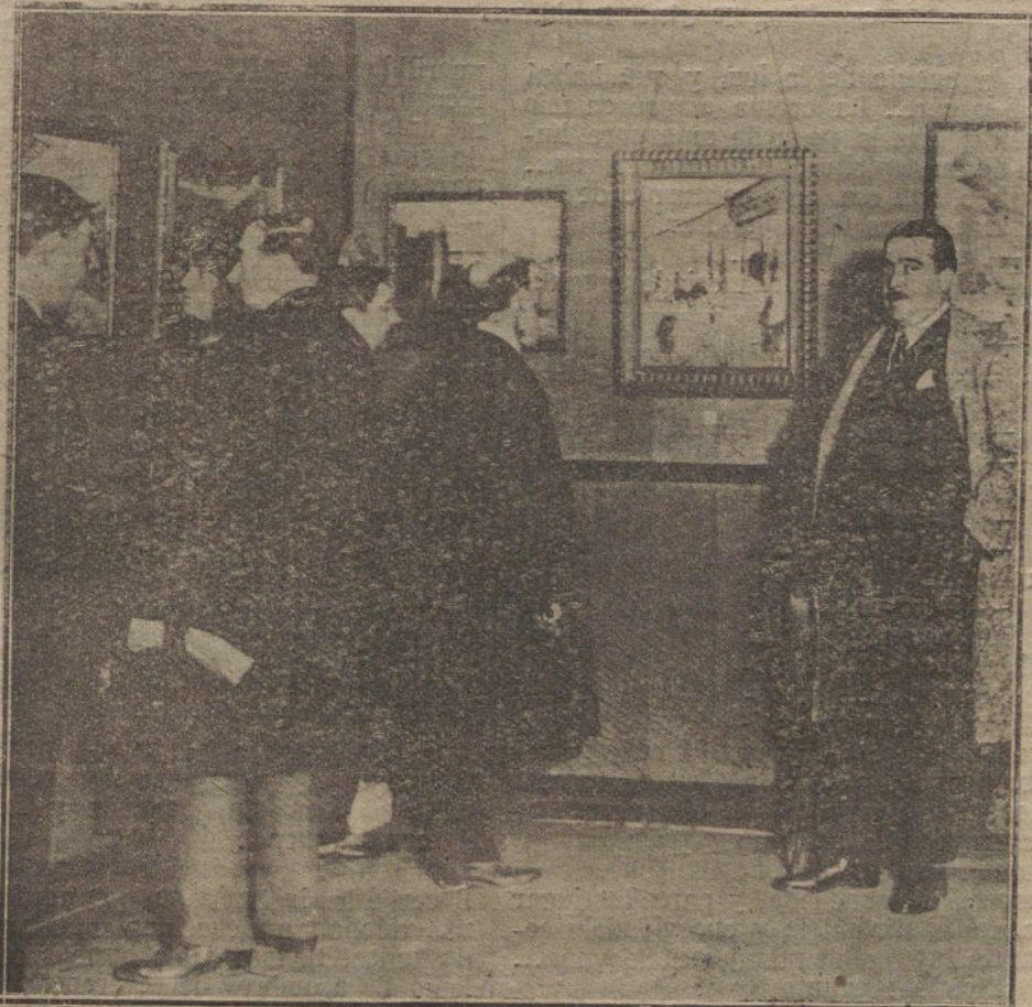
Un detalle de la Exposición de impresiones de Tetañ y Xauen, de Mariano Bertuchi.

«Se anuncia que la Comisión de la Liga de las Naciones ha enviado un ultimatum al general Zeligowski pidiendo la evacuación de Vilna.—Radio.