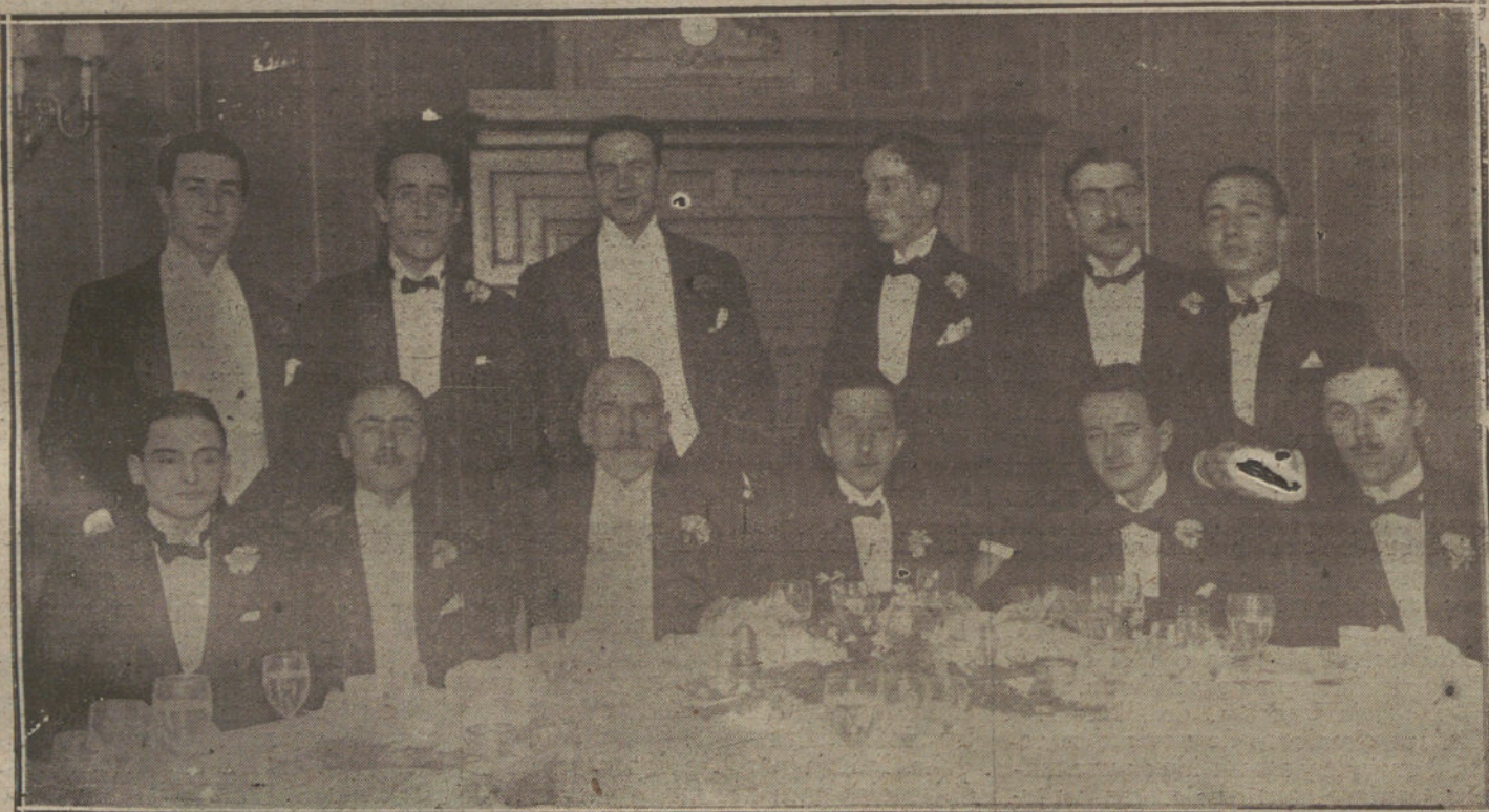
Banquete celebrado en el Ritz por la última promoción diplomática, cuyos alumnos han obtenido plaza en el ministerio de Estado.

BARCELONA. De Manlleu comunican que en las fábricas de tejidos e hilados de algodón de la comarca se ha reducido el trabajo a tres días por semana. La fábrica de Molar se ha cerrado por tiempo indefinido.