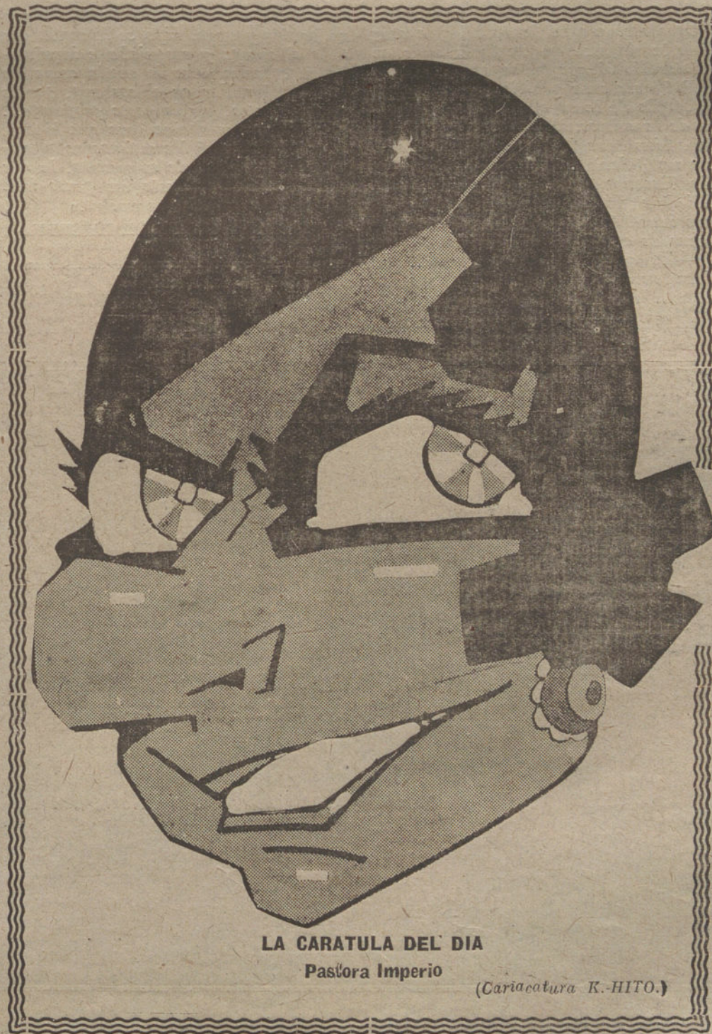
LA CARATULA DEL DIA

Cuatro divisiones griegas, que se componían de 60.000 hombres, han sido derrotadas, y el número de prisioneros se eleva a 6.000.—Radio.