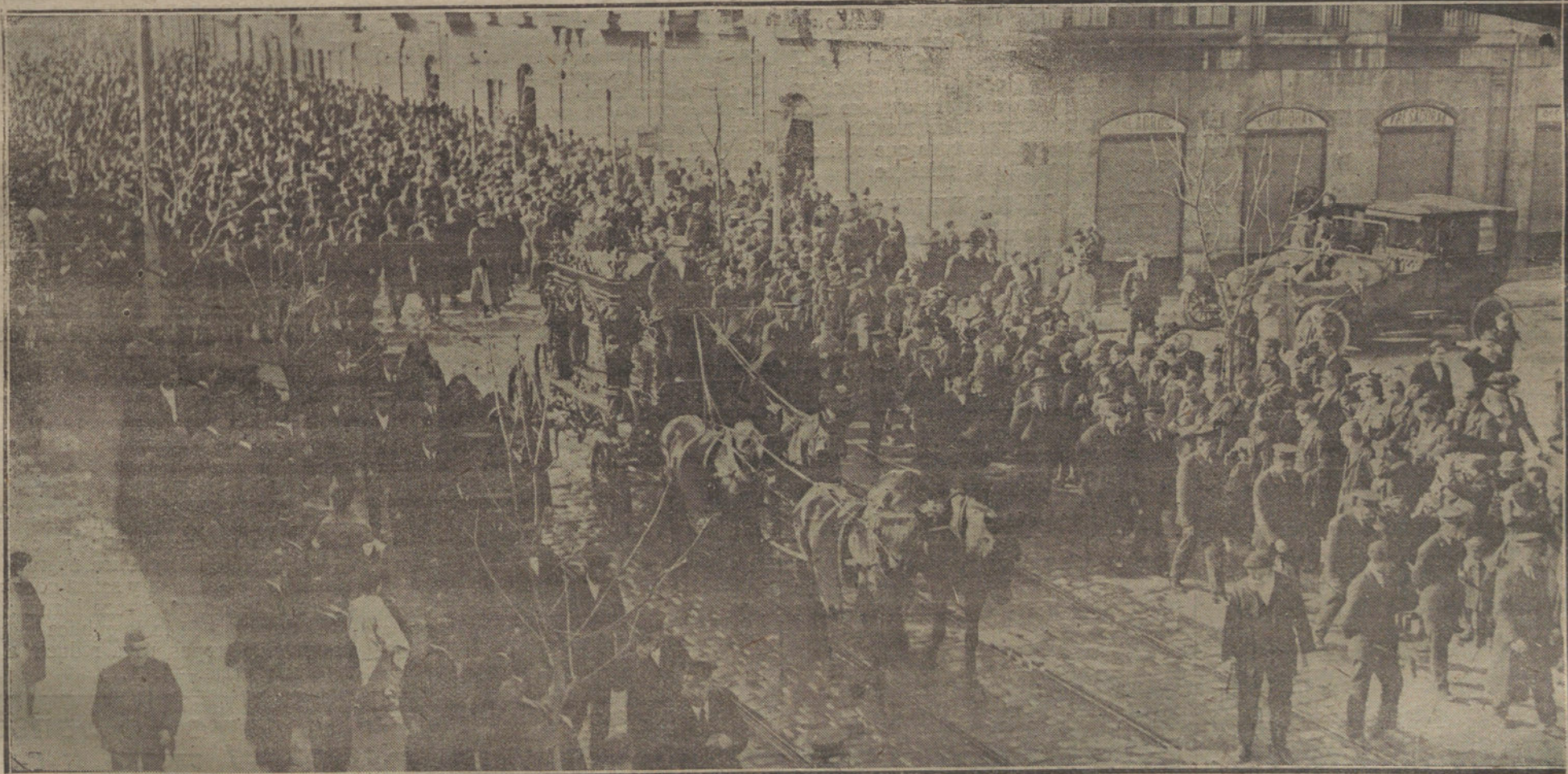
Imponente manifestación de duelo celebrada en Bilbao con motivo del entierro del gerente de los Altos Hornos, muerto a consecuencia de un crimen social.