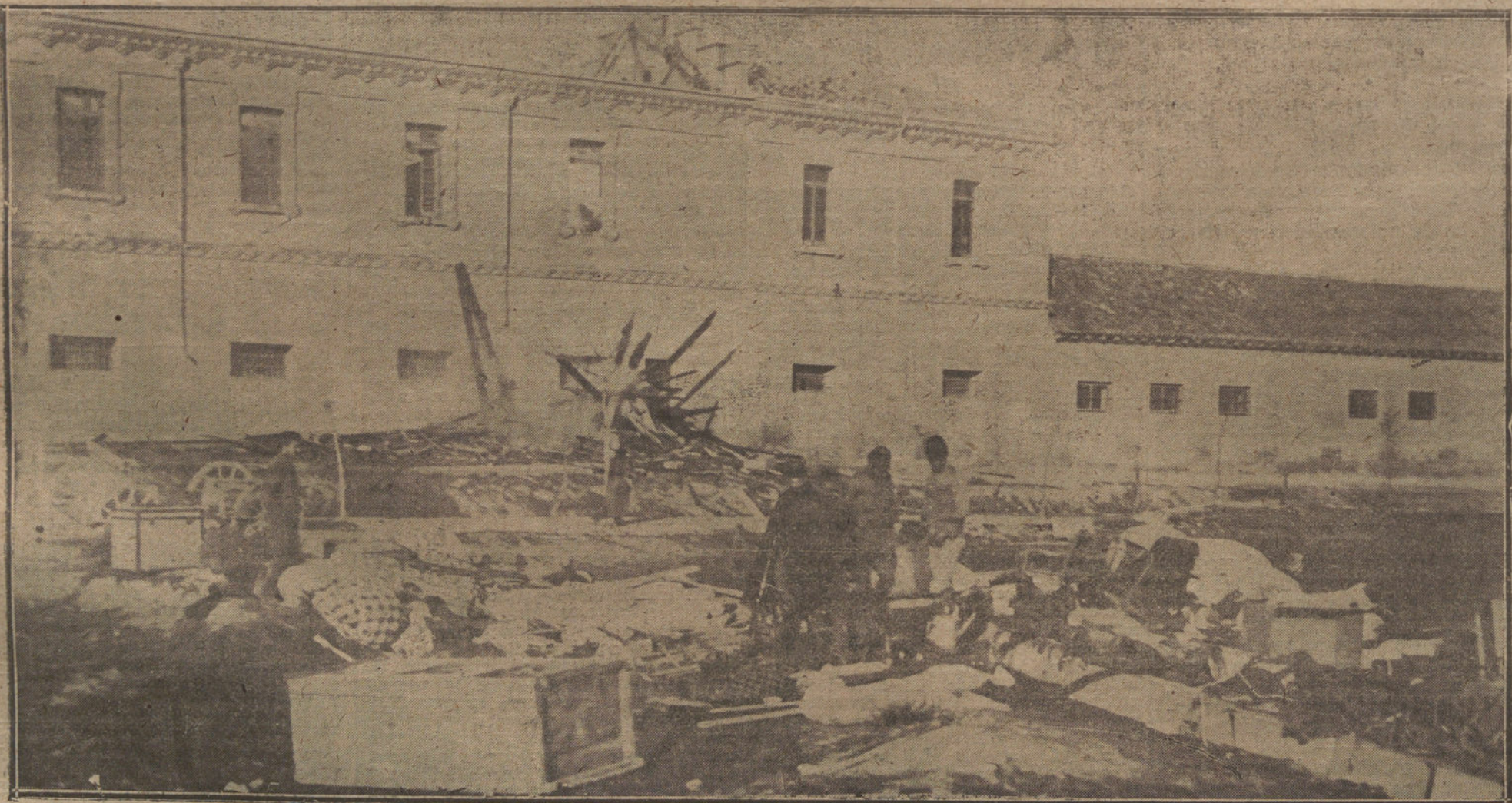
EL INCENDIO DE AYER EN VICALVARO.—Estado en que han quedado los pabellones del cuartel de Artillería, destruidos por el fuego.