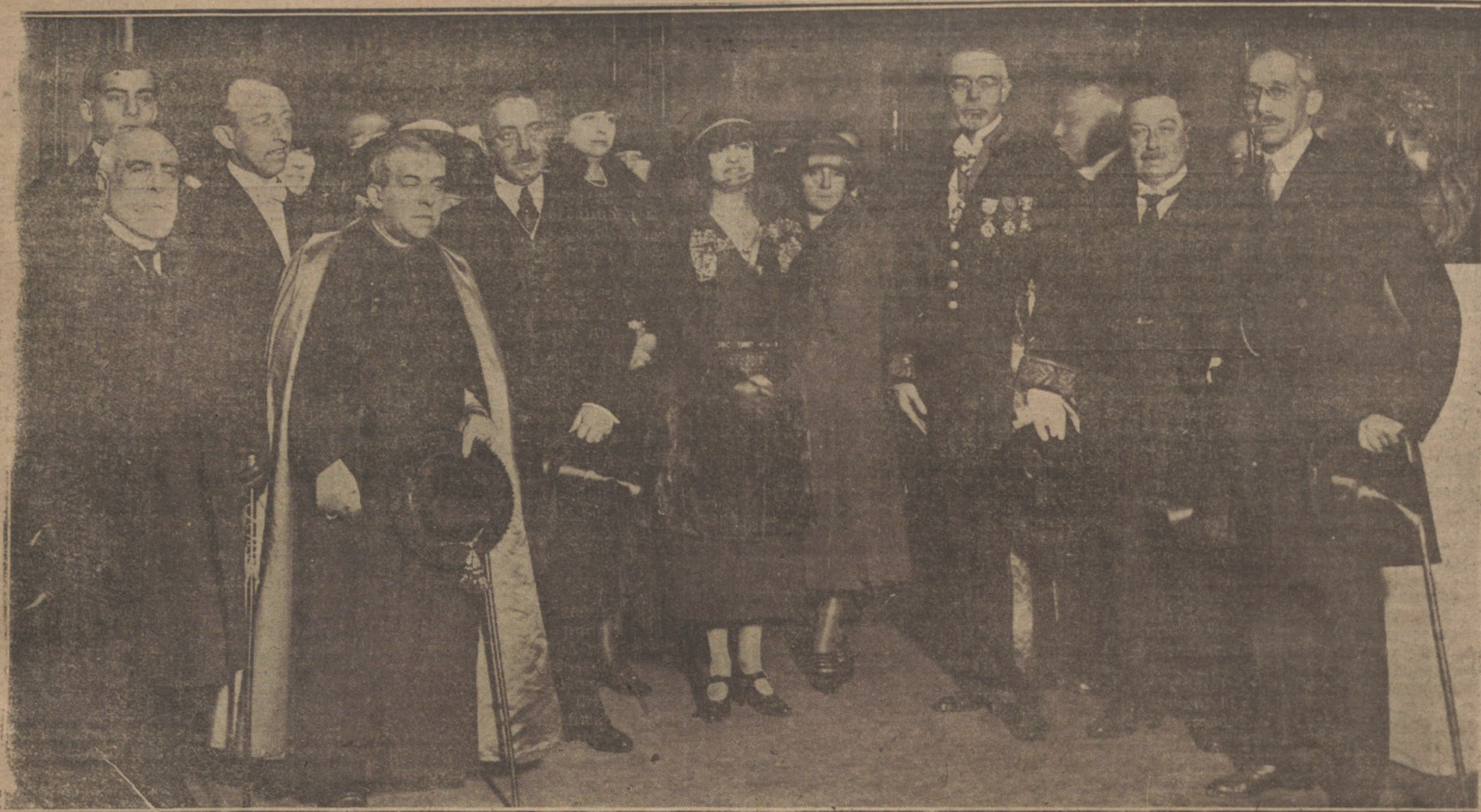
Grupo de autoridades y representaciones locales que asistieron a la apertura de la Exposición de Arte belga, que se celebra actualmente en el Palacio de Bellas Artes de Barcelona.