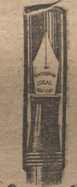
CAPUCHÓN DE SEGURIDAD

se llena sin cuenta gotas en un segundo, por un sencillo levantamiento y cierre de la palanca. Una vez cerrada esta última, el mango queda liso sin ninguna parte saliente que estorbe para escribir o al llevar la pluma en el bolsillo; además lleva un capuchón roscado que cierra herméticamente y es de toda seguridad. Este modelo tiene todas las perfecciones que han creado la fama de la pluma Ideal Waterman.