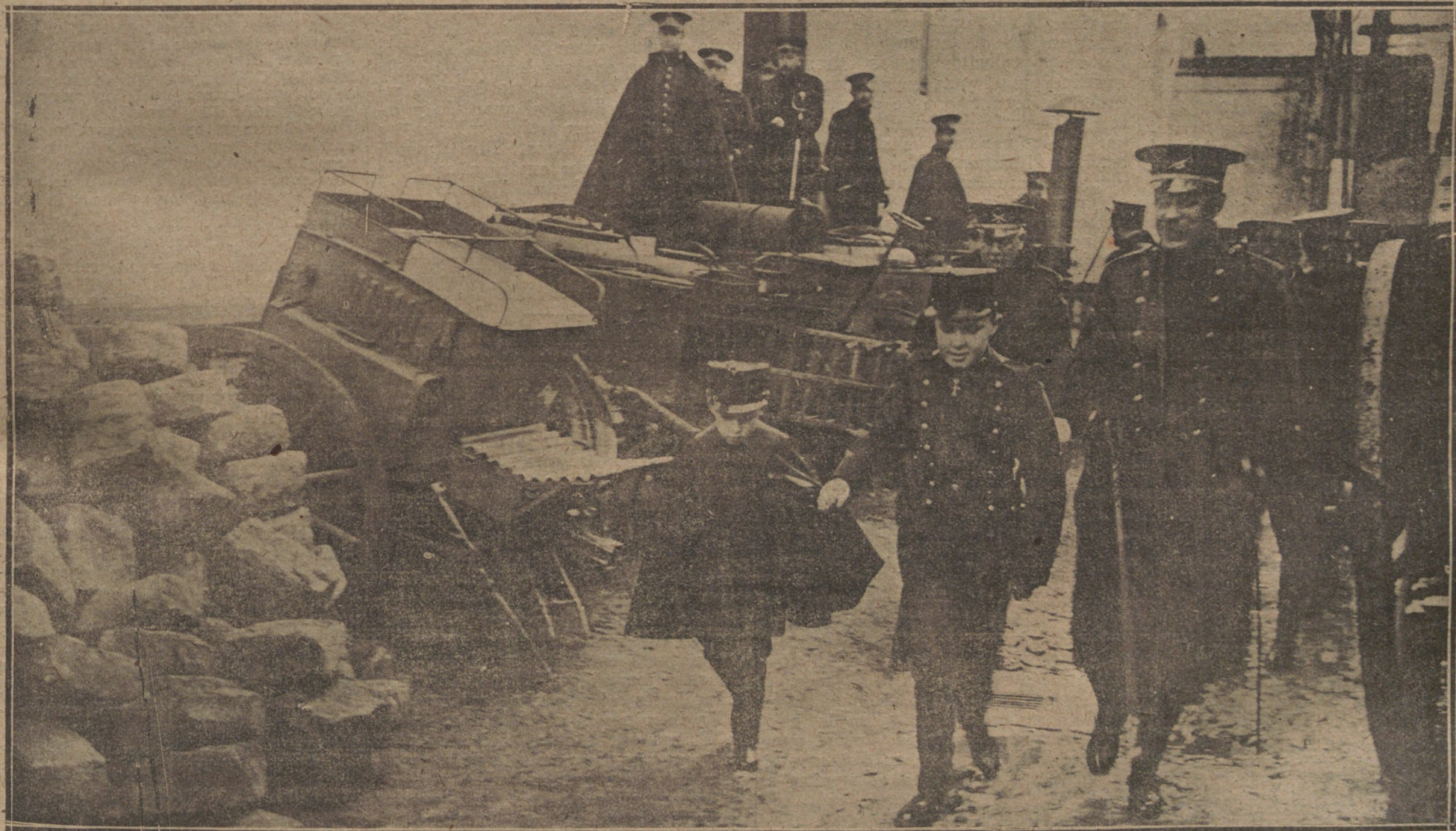
Su Alteza Real el Infantito don Gonzalo, visitando por primera vez el cuartel del regimiento del Rey, acompañado de su augusta hermano el Príncipe de Asturias. (Fot. VIDAL.)

Este recibe numerosas visitas y testimonios de adhesión de personalida-