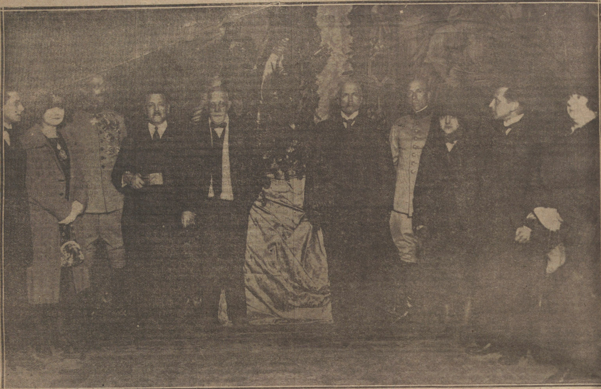
EL MONUMENTO A VARA DEL REY EN BARCELONA.—Inauguración del monumento instalado en uno de los salones del Centro del Ejército y de la Armada.

Información postal, telegráfica y telefónica de su oficina de redacción, dirigida por Rafael Guerrero, Rambla de las Flores, 16 - BARCELONA