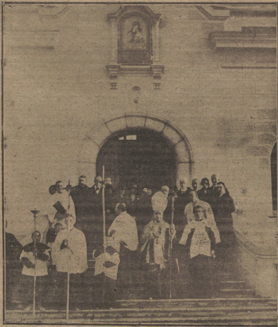
Grupo de autoridades e invitados que asistieron a la inauguración de los nuevos comedores para niños, creados en el Asilo de María Cristina.