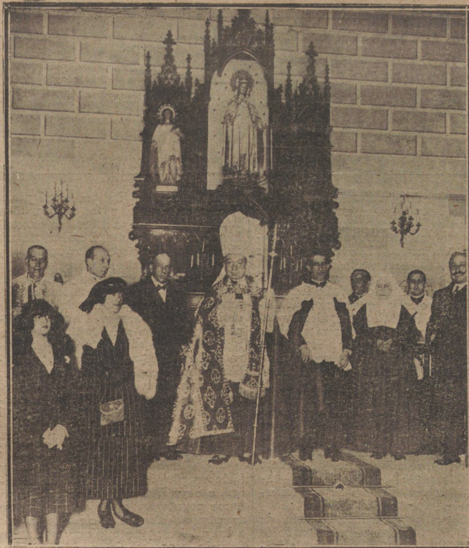
INAUGURACION DE UNA NUEVA CAPILLA EN EL ASILO DE MARIA CRISTINA.—El obispo de Madrid-Alcalá bendiciendo las obras.