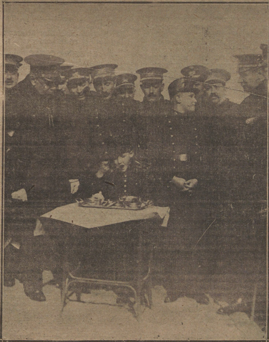
Su Alteza Real el Infantito don Gonzalo probando el rancho durante la visita que ha efectuado al cuartel del regimiento del Rey, acompañado de su hermano el Príncipe de Asturias.

El ex presidente del Consejo señor Allendesalazar manifestó, como síntesis del consejo que había dado a Su Majestad el Rey, que había propuesto la continuación del señor Dato, en el