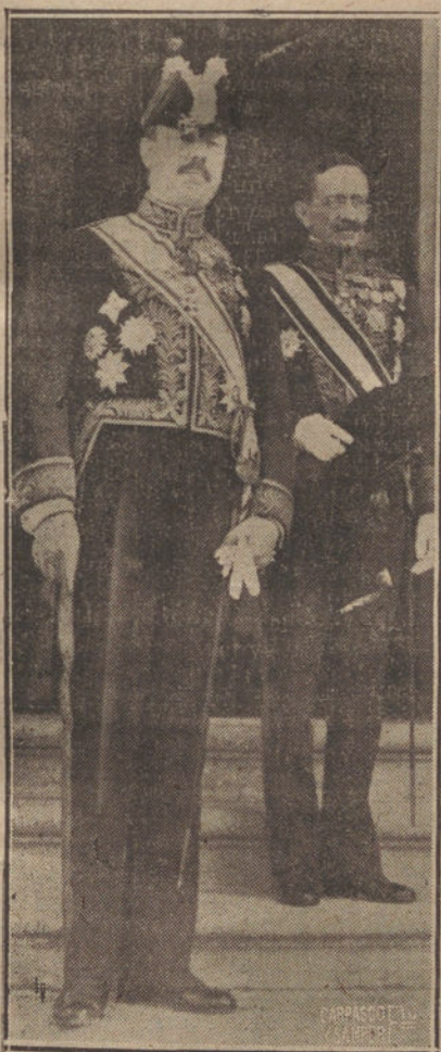
El primer embajador de Bélgica en España, barón de Borchgraeve, saliendo de Palacio.

En los alrededores del Ayuntamiento se había estacionado numeroso público, que, al salir los homenajeados, les tributó una ovación delirante.