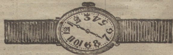
Núm. 2.—Ovalado, áncora de precisión, oro de ley 18 quilates, con pulsera de moiré. Pesetas 140.