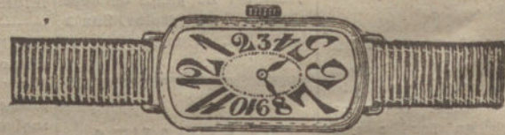
Núm. 4.—Áncora de precisión, 16 rubies, oro de ley 18 quilates, con pulsera de moiré. Pesetas 175.