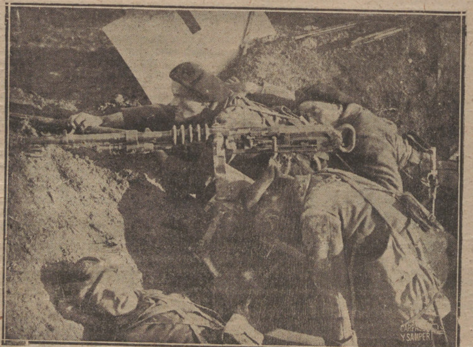
Una emocionante escena de la maravillosa producción cinematográfica ¡YO ACUSO...!, que dice de la horrible tragedia que ha vivido el mundo...