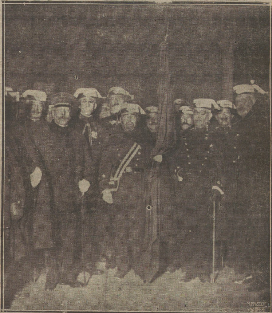
Jefes y oficiales de la Guardia civil que estuvieron anoche en la estación del Mediodía a despedir su bandera, que ha sido enviado a Zaragoza.

Y contesta con la firmeza del que ha estudiado bien el asunto que discute: «Porque ha ocurrido lo siguiente: Marruecos, cuya geografía era casi desconocida, es un país atlántico por excelencia, que tiene por única salida, no ya el Mediterráneo, sino el Océano. Ha ocurrido, pues, que Tánger—la ciudad diplomática y única abierta por el antiguo Gobierno xerifiano a los representantes oficiales de Europa—no fué nunca el puerto natu-