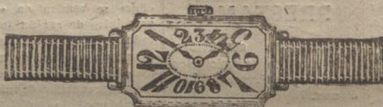
Núm. 5.—Rectangular, áncora de forma, oro de ley 18 quilates, con pulsera de moiré. Pesetas 200.