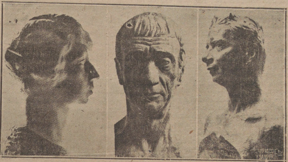
Retratos de la esposa del escultor, el pintor Iturrino y el poeta Morales, obras de Victorio Macho