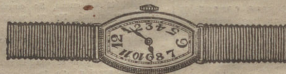
Núm. 6.—«Tonneau», áncora de precisión, oro de ley 18 quilates, con pulsera de moiré. Pesetas 250.

Carpinteros, ebanistas, embaladores Puntas de París, alambres, metal desplegado, grandes existencias a precios de fábrica; visitad esta Casa y os convencereis. A. Garro Rex, Leganitos, 30 y 32.