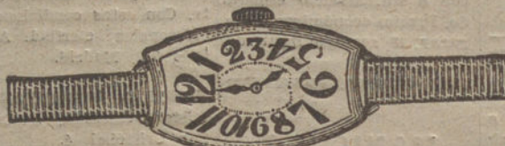
Núm. 3.—«Tonneau» curvado, áncora de forma, oro de ley 18 quilates, con pulsera de moiré. Pesetas 170.