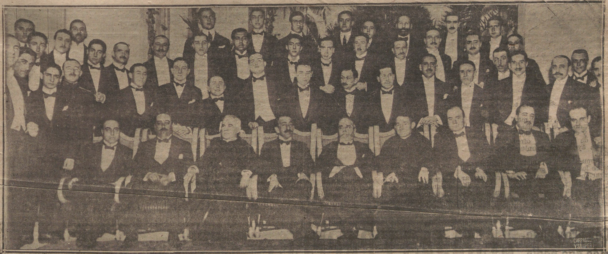
Banquete ofrecido por los ex alumnos de la Universidad del Escorial en el Hotel Ritz a los 17 parlamentarios compañeros suyos, triunfantes en las últimas elecciones.

NO SE DEVUELVEN LOS ORIGINALES GRAFICOS NADA MAS QUE EN EL CASO EN QUE PREVIAMENTE HAYAN SIDO ADQUIRIDOS CON ESA CONDICION.