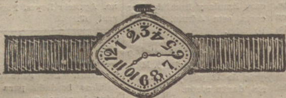
Núm. 1.—Rombo, máquina fina sobre rubies, oro de ley 18 quilates, con pulsera de moiré. Pesetas 110.

Garantía efectiva de buena marcha por cinco años