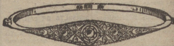
Núm. 3.—Pulsera tres brillantes y diamantes. Pesetas 775.