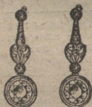
Núm. 4.—Pendientes seis bri- llantes y diamantes. Pesetas 1.500