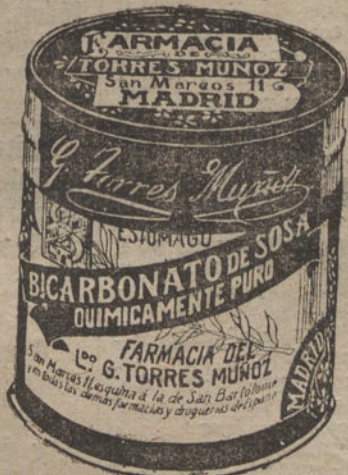
LATAS ECONOMICAS DE 1½ KILOS