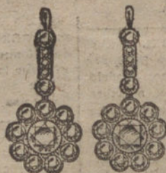
Núm. 6.—Pendientes treinta brillantes. Pesetas 2.375.