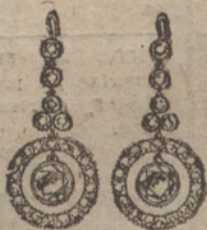
Núm. 3.—Pendientes seis brillantes y diamantes. Pesetas 825.