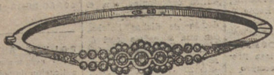
Núm. 1.—Pulsera tres brillantes y diamantes. Pesetas 450.

MONTURAS DE PLATINO FINO Y ORO DE LEY 18 QUILATES CONTRASTADO