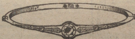
Núm. 5.—Pulsera 3 brillantes y diamantes. Pesetas 1.125.