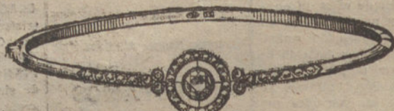
Núm. 2.—Pulsera cinco brillantes y diamantes. Pesetas 600.