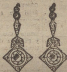
Núm. 3.—Pendientes seis bri- llantes y diamantes Pesetas 1.000