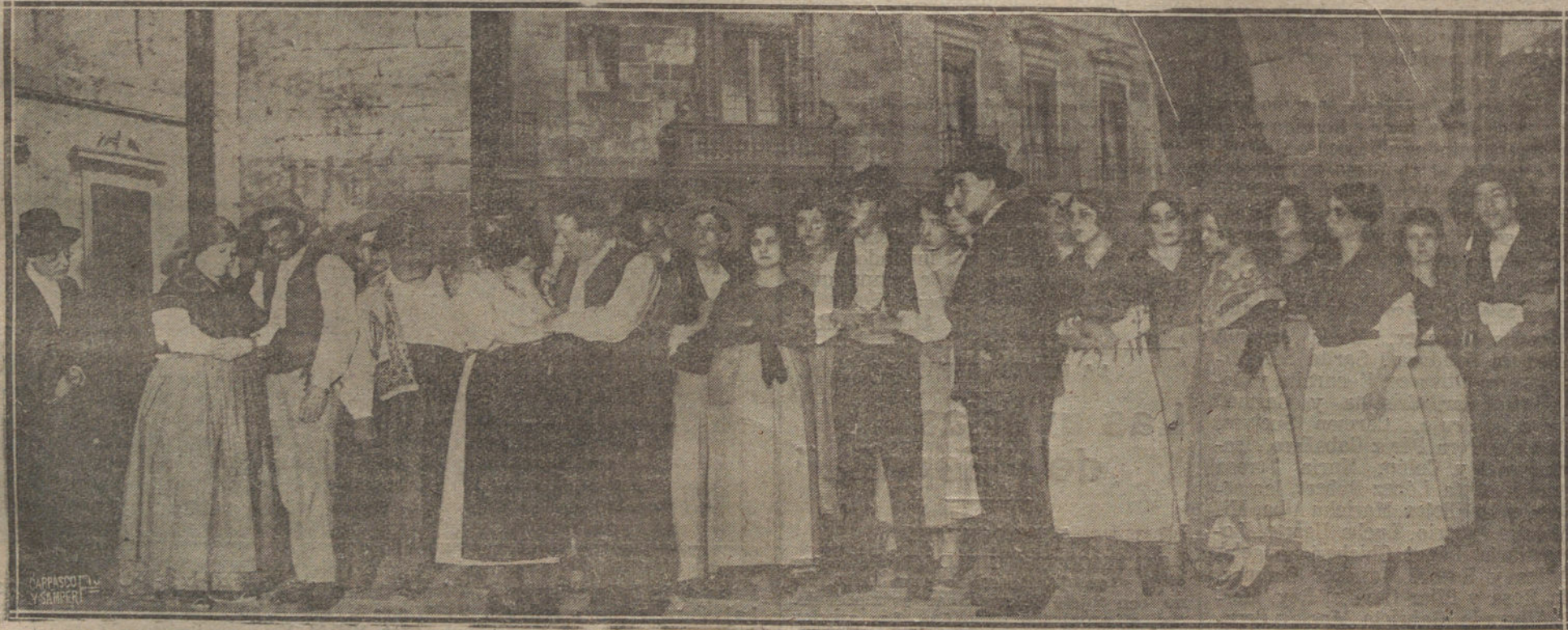
Fin del primer acto de la tragedia «La tierra», original de López Pinillos, que se ha estrenado en el teatro Español.

Nótase la acentuación del descenso de los fletes, como consecuencia de la anomalía del mercado. Si estas circunstancias persistieran, no tardaríamos en saber que estaban amarrados los buques de gran escala, a semejan-