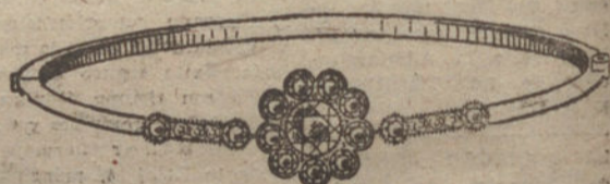
Núm. 6.—Pulsera 20 brillantes. Pesetas 1.825.