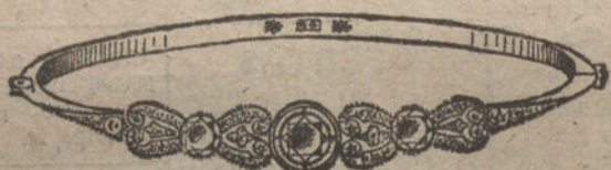
Núm. 4.—Pulsera 3 brillantes y diamantes. Pesetas 900.