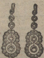
Núm. 3.—Pendientes 10 brillantes y diamantes. Pesetas 450.