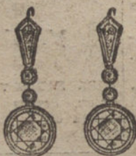
Núm. 5.—Pendientes doce brillantes. Pesetas 2.775.