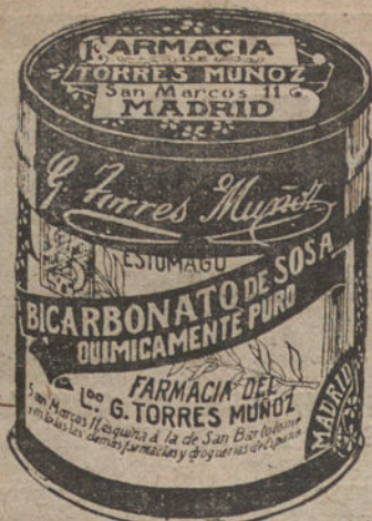
LATAS ECONÓMICAS DE 1 1/2 KILOS