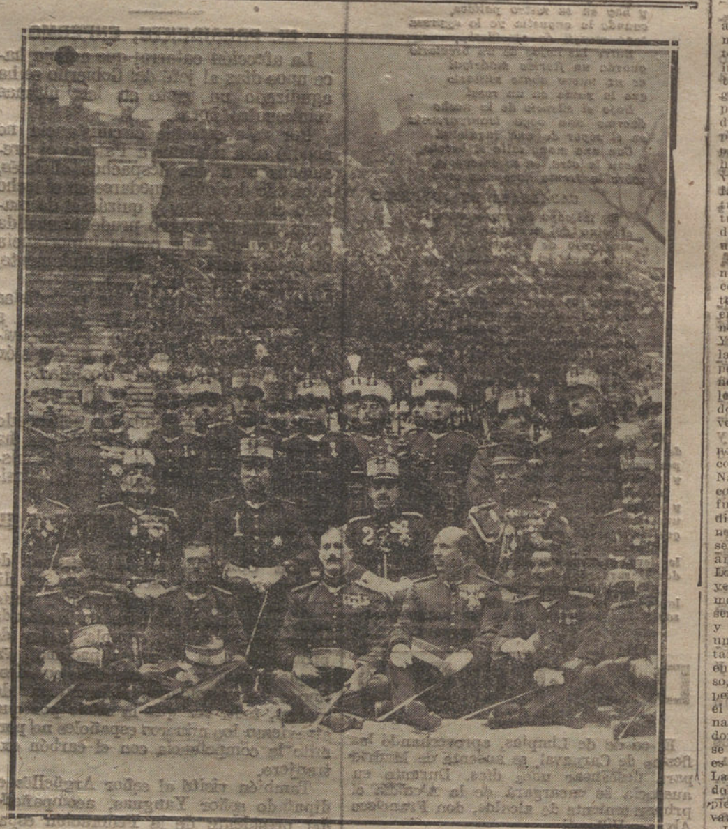
Sus Majestades los Reyes, Don Alberto (I) y Don Alfonso con los jefes y oficiales del regimiento de Wad-Bás, después de tomar posesión el primero del cargo de coronel honorario.