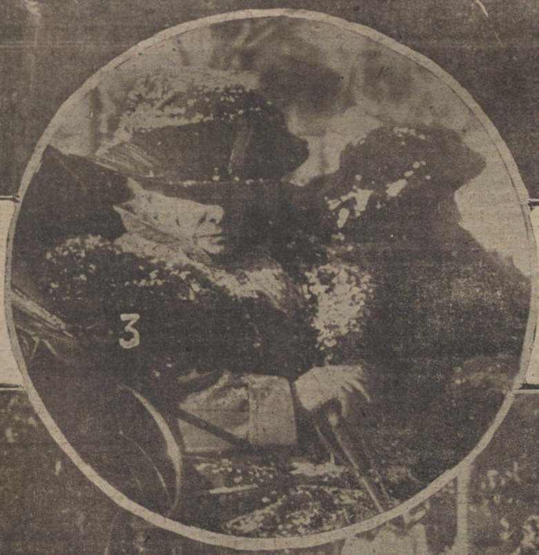
Núm. 1: Carroza titulada «El rápido de Baroda», una de las pocas que se presentaron y a la que se otorgó el tercer premio, único concedido.—Número 2: Su Alteza la Infanta doña Isabel, presenciando el Carnaval desde un coche.—Número 3: Aspecto del paseo de Rosales, donde este año se ha celebrado el concurso de carrozas y disfraces.