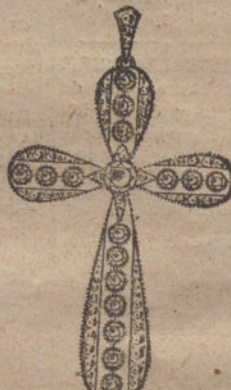
Núm. 7.—17 brillantes y diamantes. Pesetas 650.