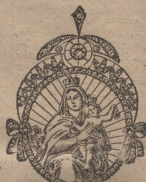
Núm. 8.—6 brillantes y diamantes. Pesetas 600.

A. E. G. Ibérica de Electricidad. Soc. Anónima.