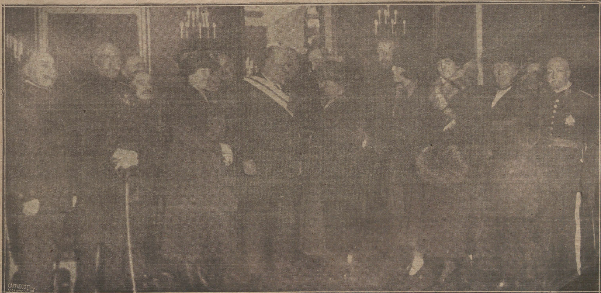
Momento de imponer al ilustre periodista don José Ortega Munilla la gran cruz del Mérito militar, en nombre de la Junta del aguinaldo del soldado, a celebrarse ayer en el ministerio de la Guerra.

Se calcularon por este concepto ingresos por 100.000 pesetas para todo el año, y, como es consiguiente, 75.000 para los nueve primeros meses, y en lugar de esa suma se han obtenido 95.000 pesetas contra 70.000 del año anterior, siendo, por consiguiente, el aumento de 20.000 con relación al calculado, y de 25.000 con relación al año anterior. Pueden aplicarse a este concepto las mismas consideraciones que se hicieron al fundamentar los aumentos obtenidos en el de importación.