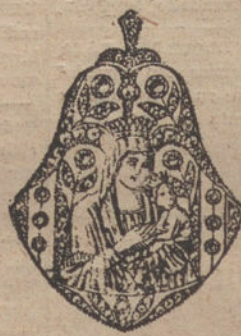
Núm. 3.—10 brillantes y diamantes. Pesetas 500.