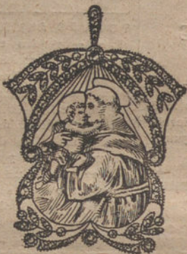
Núm. 5.—12 brillantes y diamantes. Pesetas 550.