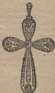
Núm. 4.—5 brillantes y diamantes. Pesetas 450.