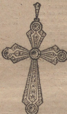
Núm. 6.—5 brillantes y diamantes. Pesetas 575.