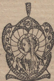
Núm. 2.—9 brillantes y diamantes. Pesetas 425.