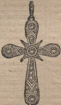
Núm. 1.—5 brillantes y diamantes. Pesetas 375.

CON BRILLANTES DE PRIMERA CALIDAD :: DIAMANTES ROSAS DE HOLANDA MONTURAS DE PLATINO FINO Y ORO DE LEY 18 QUILATES CONTRASTADO