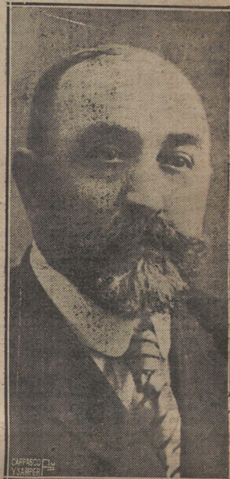
Don Severino Aznar, que ayer ha ingresado en la Real Academia de Ciencias Morales y Políticas.

Ayer tarde se celebró en la Real Academia de Ciencias Morales y Políticas sesión pública y solemne para dar posesión al académico electo don Severino Aznar.