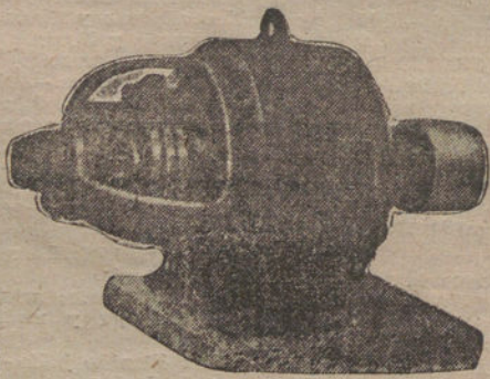
Motores para corriente trifásica.