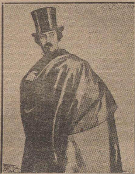
El cartel anunciador de «España»

El caserón en que vivía también era «hoca».