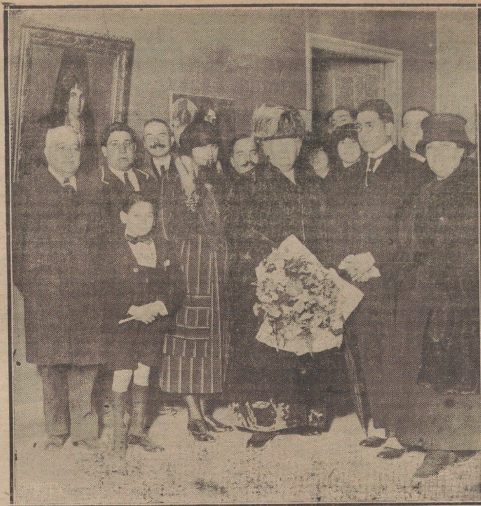
Su Alteza la Infanta doña Isabel durante la visita que hizo ayer a la notable Exposición de cuadros de Cruz Herrera.

Pasaron los meses, y Montllor iba haciendo su camino; se constituyó la Sociedad, encontró entre Barcelona y Madrid el capital necesario; primeramente, cinco millones; después, seis, y, finalmente, hasta nueve, y como se lo proponga encontrará veinte y todos los millones que quiera. Comenzaron seguidamente las obras del Hotel Ritz de Barcelona, y todo el que