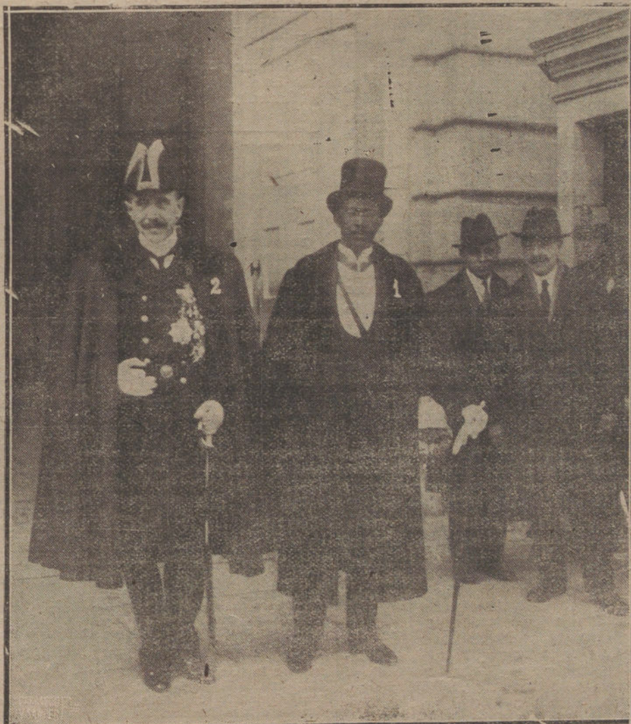
El Presidente de la República de Liberia, Mr. King (1), que fingió ayer a Madrid, saliendo de Palacio acompañado del general Barrera (2), después de haber sido recibido en audiencia por Su Majestad el Rey.

Al intentar separar a un mulo que le impedía el paso, recibió una coz del animal en la cabeza. La coz fue tan formidable, que el animal se rompió la pata por dos sitios, y hubo necesidad de rematarlo.