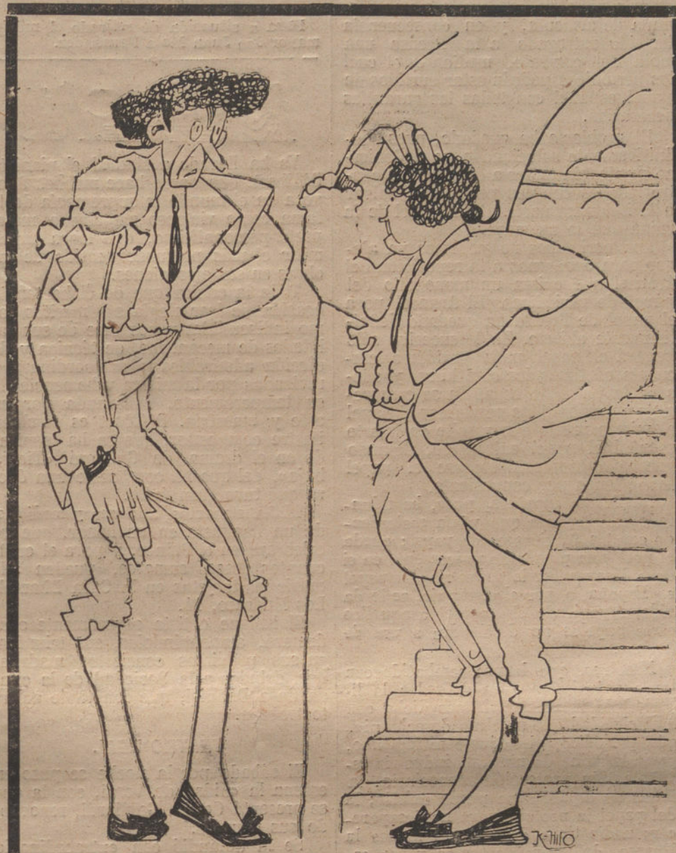
EL PLEITO DE LOS PICADORES