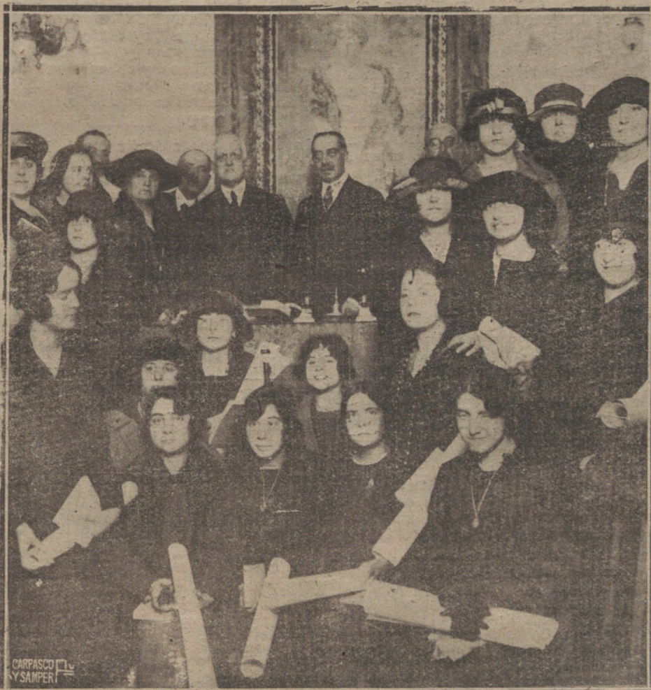
Alumnas de la Escuela del Hogar premiadas en el último curso