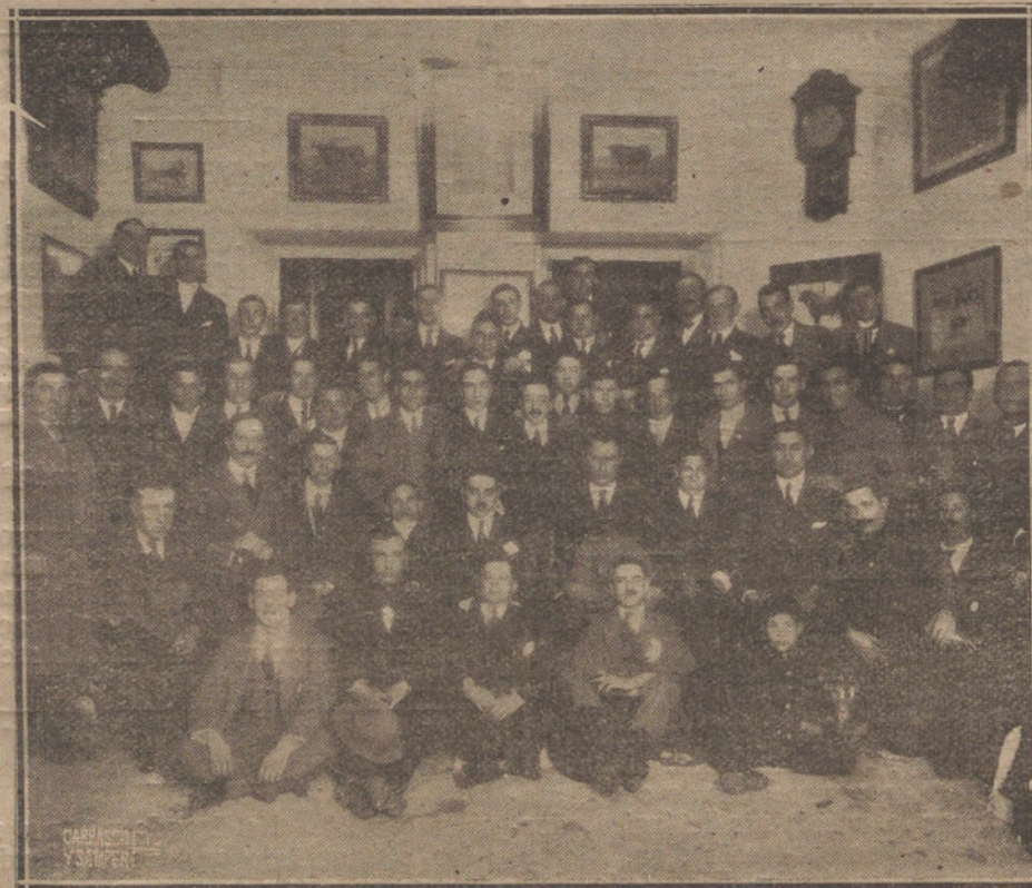
Grupo de asistentes a la inauguración del nuevo «Club Joselito», creado en Sevilla, para perpetuar la memoria del gran torero.

El Tribunal se excusa en que ignoraba mi retraso, pues que no tuve la precaución de anunciar mi salida desde Alicante. Esto será una inadverencia mía, pero no justifica, de ningún modo, una resolución mantenida a todo trance.