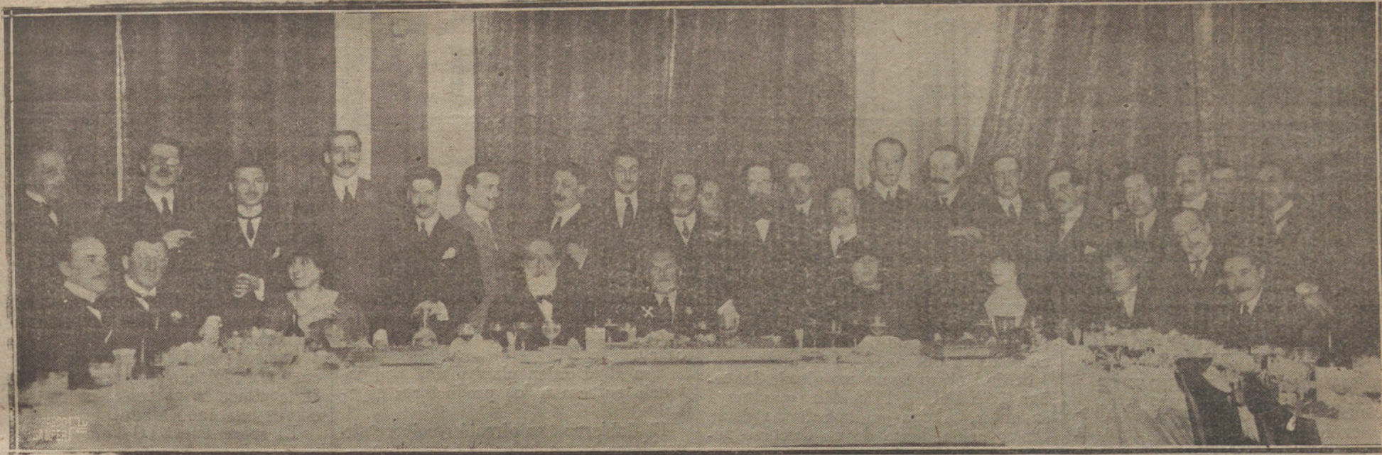
Banquete ofrecido en el Palace Hotel al eminente concertista señor D'Albert.

Al Tribunal le consta, muy luego de mi presentación, de mis explicaciones y protestas y de mis justificantes, que realicé mi regreso en el tren del 9, según lo convenido, pues que para ello se me prolongó la licencia hasta el 10. Y es evidente que, salvo por arte de encantamiento o magia, no me era posible llegar a Madrid antes que el tren que me conducía.