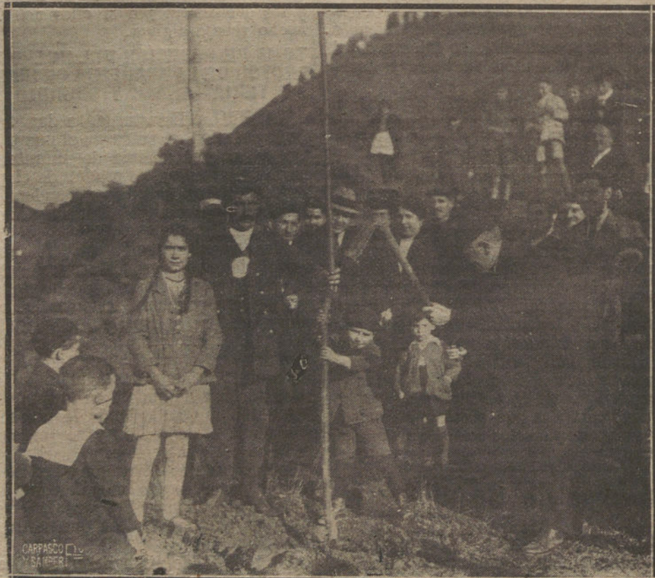
LA FIESTA DEL ARBOL EN RENTERIA. —El alcalde y los alumnos de las escuelas públicas plantando árboles durante el festival.