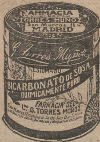
LATAS ECONOMICAS DE 1x KILOS