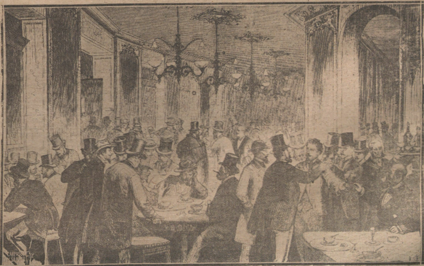
Aspecto interior del café Suizo la noche que se supo la proclamación de Don Alfonso XII.

La sonrisa de sus collares de perlas. RAMÓN GÓMEZ DE LA SERNA