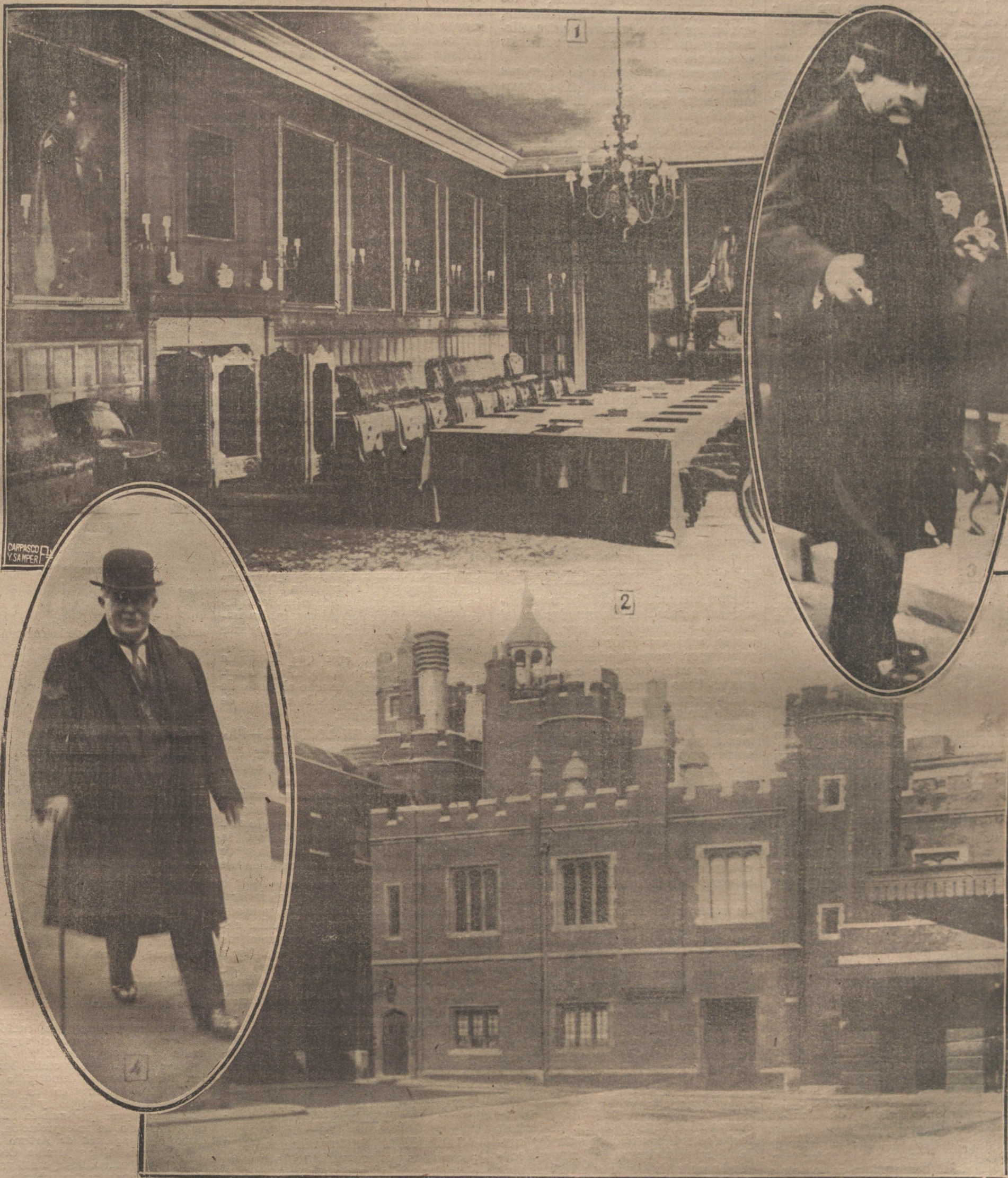
Núm. 1: Salón llamado de retratos del palacio de Saint James, donde se celebra actualmente la Conferencia interaliada de Londres, para decidir la forma en que los alemanes deben pagar la indemnización de guerra y estudiar las contraproposiciones de éstos.— Núm. 2: Vista exterior del palacio de Saint James, donde tienen lugar las deliberaciones diplomáticas.— Núm. 3: Briand saliendo de una de las sesiones.— Núm. 4: Lloyd George saliendo del palacio de Saint James.