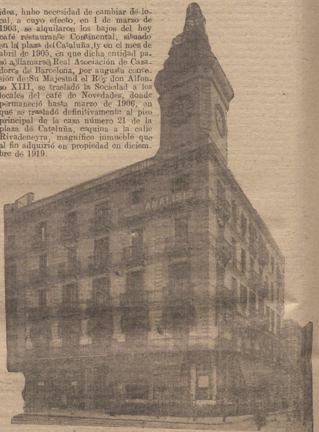
Fachada del soberbio edificio que ocupa la Real Asociación de Cazadores de Barcelona

idea, hubo necesidad de cambiar de local, a cuyo efecto, en 1 de marzo de 1903, se alquilaron los bajos del hoy café restaurante Continental, situado en la plaza de Cataluña, y en el mes de abril de 1905, en que dicha entidad pasó a llamarse Real Asociación de Cazadores de Barcelona, por augusta concesión de Su Majestad el Rey don Alfonso XIII, se trasladó la Sociedad a los locales del café de Novedades, donde permaneció hasta marzo de 1906, en que se trasladó definitivamente al piso principal de la casa número 21 de la plaza de Cataluña, esquina a la calle Rivadeneyra, magnífico inmueble que al fin adquirió en propiedad en diciembre de 1919.